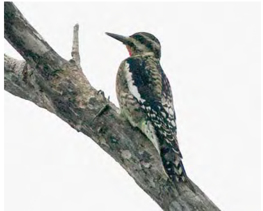
416 Tree Swallow / Boomzwaluw Tachycineta bicolor, high fields, Corvo, Azores, 19 October 2007 417 Chimney Swift / Schoorsteengierzwaluw Chaetura pelagica, Fojo, Corvo, Azores, 25 October 2009 418 American Barn Swallow / Amerikaanse Boerenzwaluw Hirundo rustica erythrogaster, first-winter, high fields, Corvo, Azores, 25 October 2006 419 Yellow-bellied Sapsucker / Geelbuiksapspecht Sphyrapicus varius, first-winter male, Fojo, Corvo, Azores, 29 October 2008