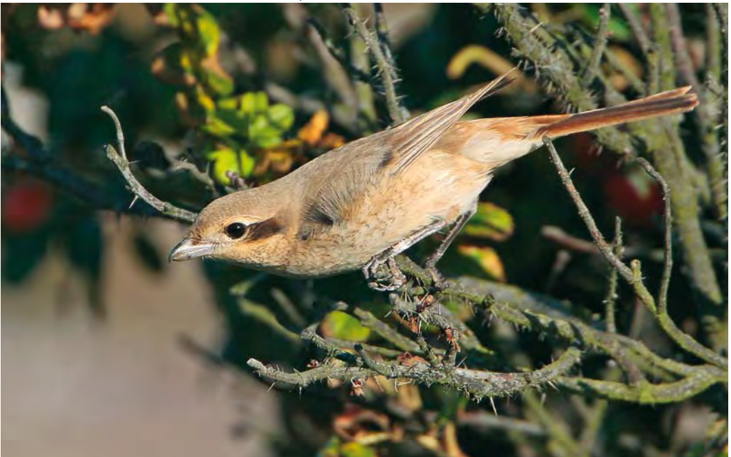
480 Daurian Shrike / Daurische Klauwier Lanius isabellinus , adult female, Den Helder, Noord-Holland, Netherlands, 5 September 2010 ( Martin van der Schalk )