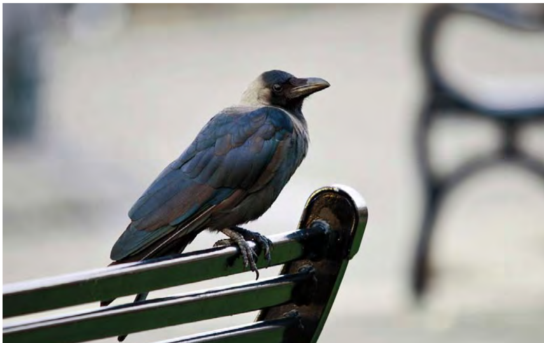
481 House Crow / Huis kraai Corvus splendens , Cobh, Cork, Ireland, 15 September 2010

tember was the first for Denmark in 26 years. Equally remarkable was the first for the Frisian Wadden Sea islands discovered on Ameland, Friesland, on 25 September.