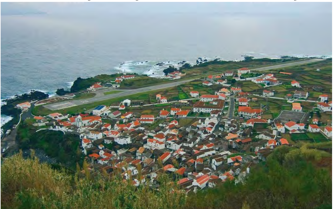
410 View of Corvo village from hill of high fields, Corvo, Azores, 1 November 2006

The primary purpose of this article is to explore that part of the avifauna for which Corvo is most well known – Nearctic vagrants. Recognizing the island's potential for American accidentals, Bannerman & Bannerman (1966) wrote: 'As a haven for vagrants ... [the Azores] must rank very high ... it is on Corvo and Flores that we should expect these overseas wanderers to arrive ... It would be astonishing if Corvo, in time, could not supply an even more interesting list of American migratory species.' It took 39 years for that prediction to be fully realised, when Peter Alfrey set out for Corvo at the height of a multi-decadal cycle of Atlantic storm activity in October 2005. Hoping to see an American landbird or two, he actually found 52 individuals of 17 species (Alfrey 2005). In the five years since that discovery, there have been several interesting developments. First and foremost has been the confirmation that American