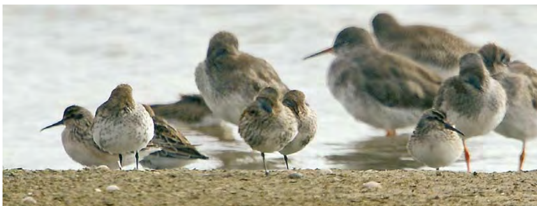
490 Aziatische Goudplevier / Pacific Golden Plover Pluvialis fulva , adult, Ottersaat, Texel, Noord-Holland, 18 augustus 2010 ( Eric Menkveld ) 491 Grijsze Strandloper / Semipalmated Sandpiper Calidris pusilla , met Bonte Strandloper / Dunlin C alpina , 't Vroon, Westkapelle, Zeeland, 23 juli 2010 ( Jaap Denee ) 492 Breedbekstrandloper / Broad-billed Sandpiper Limicola falcinellus , juveniel, Eemshaven-West, Groningen, 24 augustus 2010 ( Martijn Bot ) 493 Breedbekstrandloper / Broad-billed Sandpiper Limicola falcinellus , juveniel, Balgzandpolder, Den Helder, Noord-Holland, 22 augustus 2010 ( Fred Visscher ) 494 Breedbekstrandlopers / Broad-billed Sandpipers Limicola falcinellus , juveniele (twee, links en rechts), Balgzandpolder, Den Helder, Noord-Holland, 25 augustus 2010 ( Jan den Hertog )