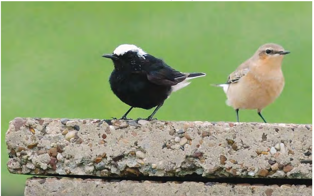
476 White-crowned Wheatear / Witkruintapuit Oenanthe leucopyga (left), with Northern Wheatear / Tapuit O oenanthe , Wremen, Niedersachsen, Germany, 19 September 2010 (Roef Mulder)