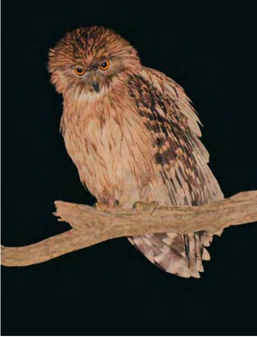
408 Western Brown Fish Owl / Westelijke Bruine Visuil Bubo (zeylonensis) semenowi , blackish-faced adult in pine tree near nest site, Antalya, Turkey, 28 December 2009