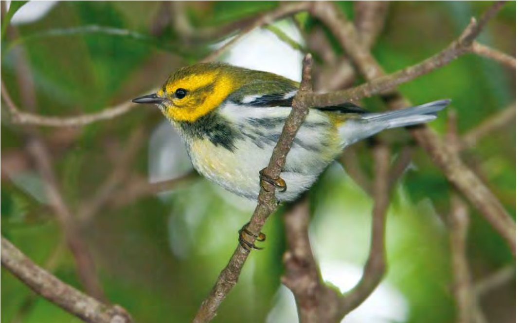
428 Black-throated Green Warbler / Gele Zwartkeelzanger Dendroica virens , first-winter male, Ribeira da Ponte, Corvo, Azores, 10 October 2009 (Vincent Legrand)