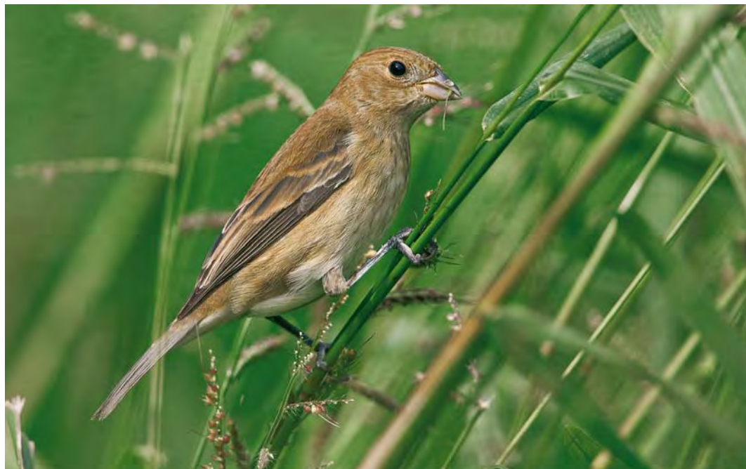
424 Indigo Bunting / Indigogors Passerina cyanea , Ribeira da Ponte, Corvo, Azores, 23 October 2007 (Rafael Armada)