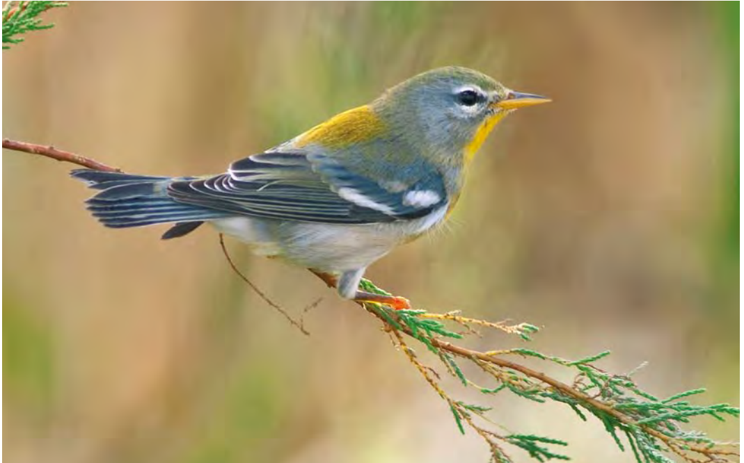
426 Northern Parula / Brilparulazanger Parula americana , first-winter male, power station, Corvo, Azores, 20 October 2009 (David Monticelli)