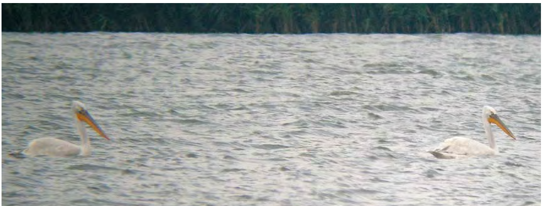
456-457 Pallas's Sandpiper / Steppehoen Syrhaptes paradoxus , Askola, Lappeenranta, Finland, 30 July 2010 ( Pekka Fagel ) 458 Rock Partridge / Steenpatrijs Alectoris graeca , Allgäuer Alpen, Bayern, Germany, 6 June 2010 ( Tobias Epple ) 459 Pallas's Gull / Reuzenzwartkopmeeuw Larus ichtyaetus , adult, with Caspian Gulls / Pontische Meeuwen L. cachinnans , Kummerower See, Mecklenburg-Vorpommern, Germany, 1 August 2010 ( Jan den Hertog ) 460 Dalmatian Pelicans / Kroeskoppelikanen Pelecanus crispus , Kis Balaton, Zala, Hungary, 31 July 2010 ( Rik Winters )