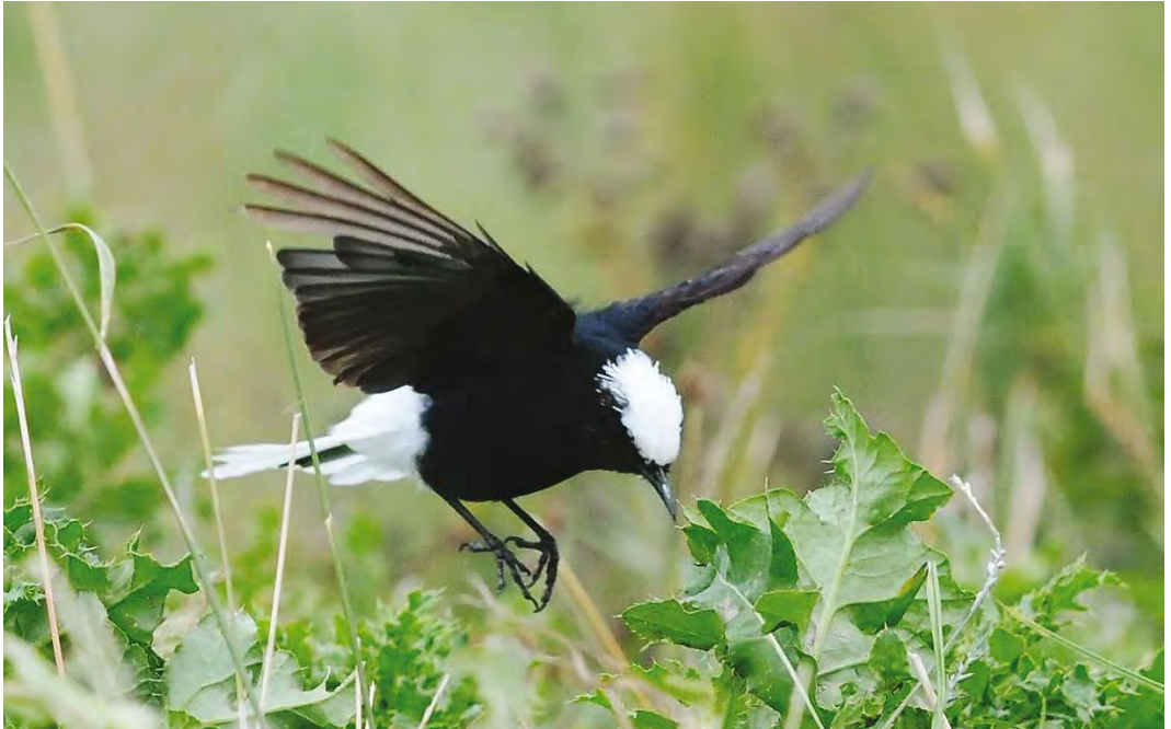
475 White-crowned Wheatear / Witkruintapuit Oenanthe leucopyga , Wremen, Niedersachsen, Germany, 19 September 2010