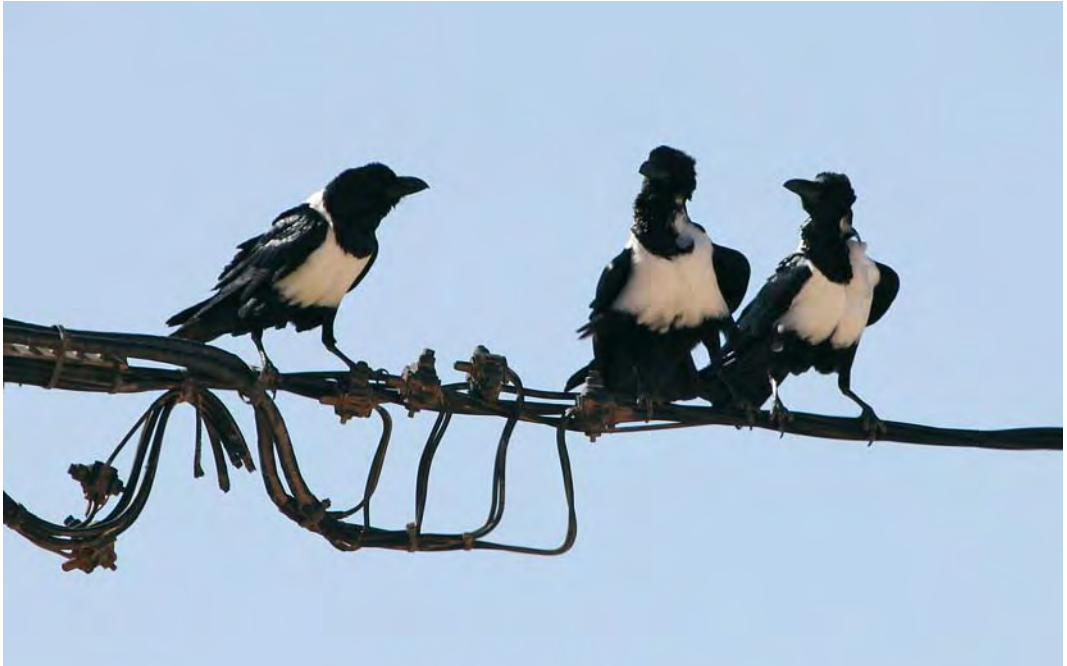
448 Pied Crows / Schildraven Corvus albus , 152 km north-east of Dakhla, Western Sahara, Morocco, 13 December 2009 (Stuart Piner)

with an obvious gape patch were seen, proving that the breeding attempt had been successful (Richard Bonser, Josh Jones, Oliver Metcalf and Plop Pointon; www.go-south.org ).