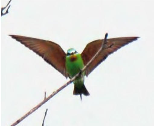
445 Groene Bijeneter / Blue-cheeked Bee-eater Merops persicus , adult, Castricum, Noord-Holland, 16 augustus 2010 (Arnoud B van den Berg)

09:15 tot 09:30 een Groene Bijeneter had gezien bij de Horsmeertjes op Texel, Noord-Holland. Hij maakte een net herkenbaar bewijsplaatje met zijn compactcamera en verliet de plek om een telescoop en betere fotoapparatuur te halen maar na terugkomst was de vogel verdwenen. Hij probeerde zijn collega Jos van den Berg op Texel te bellen maar omdat die in het buitenland verbleef lukte dat niet. Andere pogingen om vogelaars in te lichten werden niet ondernomen. Indien aanvaard mag worden aangenomen dat het dezelfde vogel betrof als bij Castricum.