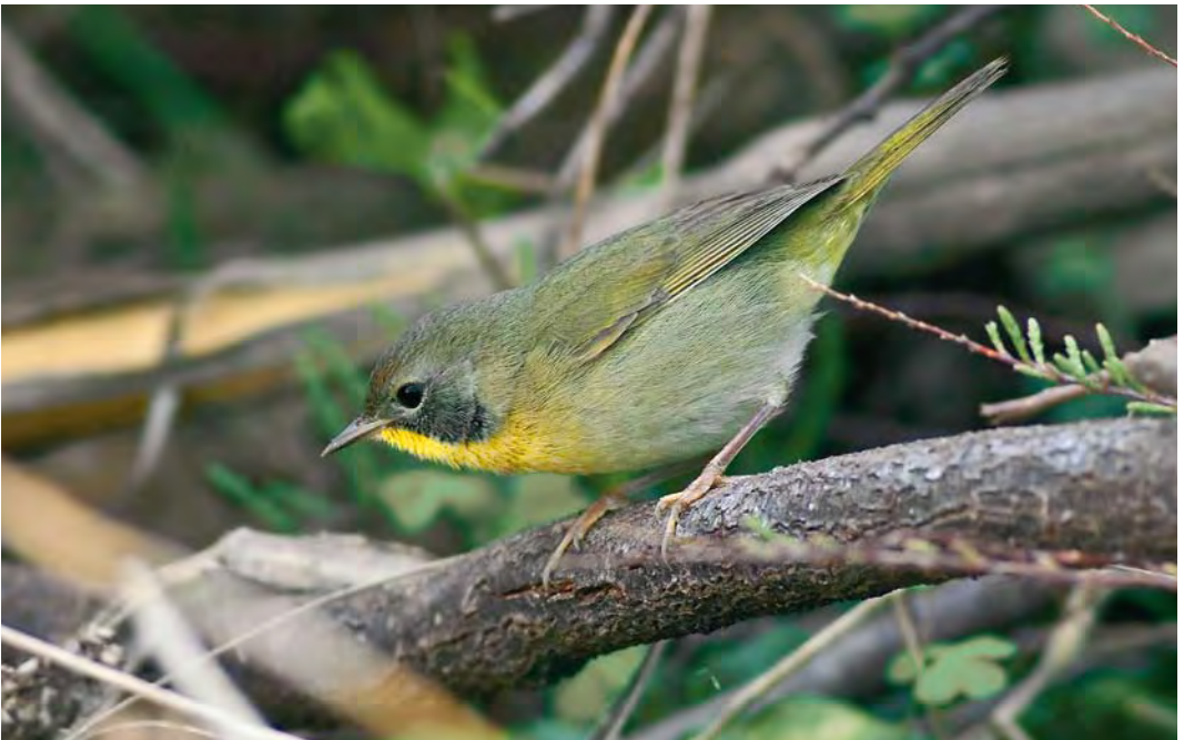
429 Common Yellowthroat / Gewone Maskerzanger Geothlypis trichas , first-winter male, middle fields, Corvo, Azores, 30 October 2008