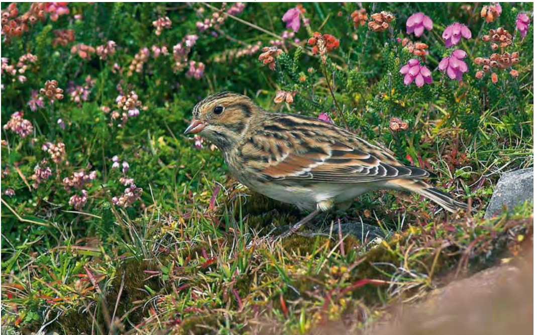
478 Lapland Longspur / Ijsgors Calcarius lapponicus , Inishbofin, Galway, Ireland, 30 August 2010