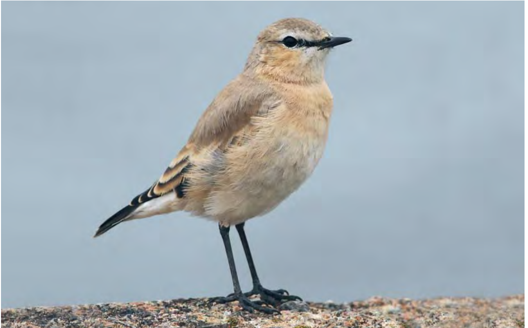
477 Isabelline Wheatear / Izabeltapuit Oenanthe isabellina , Tampere, Finland, 5 September 2010