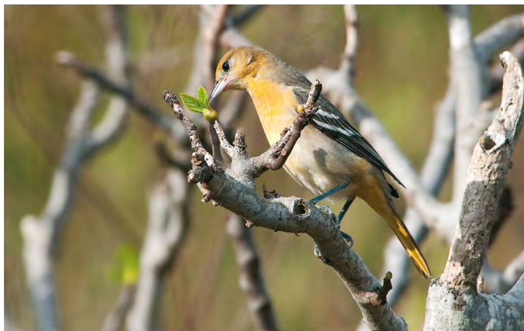
425 Baltimore Oriole / Baltimoreorioepial Icterus galbula , middle fields, Corvo, Azores, 16 October 2009 (Darryl Spittle)