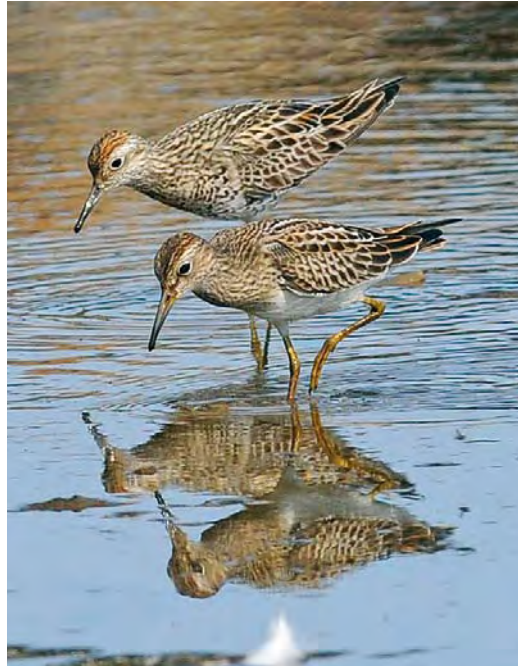
453 Solitary Sandpiper / Amerikaanse Bosruiter Tringa solitaria , Lugar de Baixo, Madeira, 2 September 2010 (Roef Mulder) 454 Sharp-tailed Sandpiper / Siberische Strandloper Calidris acuminata , adult (back), and Pectoral Sandpiper / Gestreepte Strandloper C. melanotos , juvenile, Lugar de Baixo, Madeira, 29 August 2010 (Roef Mulder) 455 Red-necked Stint / Roodkeelstrandloper Calidris ruficollis , adult (front), with Dunlin / Bonte Strandloper C. alpina , juvenile, Weymouth, Dorset, England, 27 August 2010 (Paul F Baker)