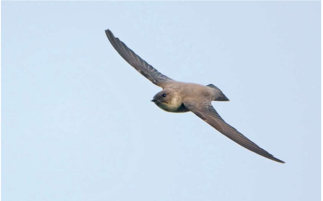
72 Eurasian Crag Martin / Rotszwaluw Ptyonoprogne rupestris , first-year, Maastricht, Limburg, Netherlands, 7 December 2009 (René Weenink)