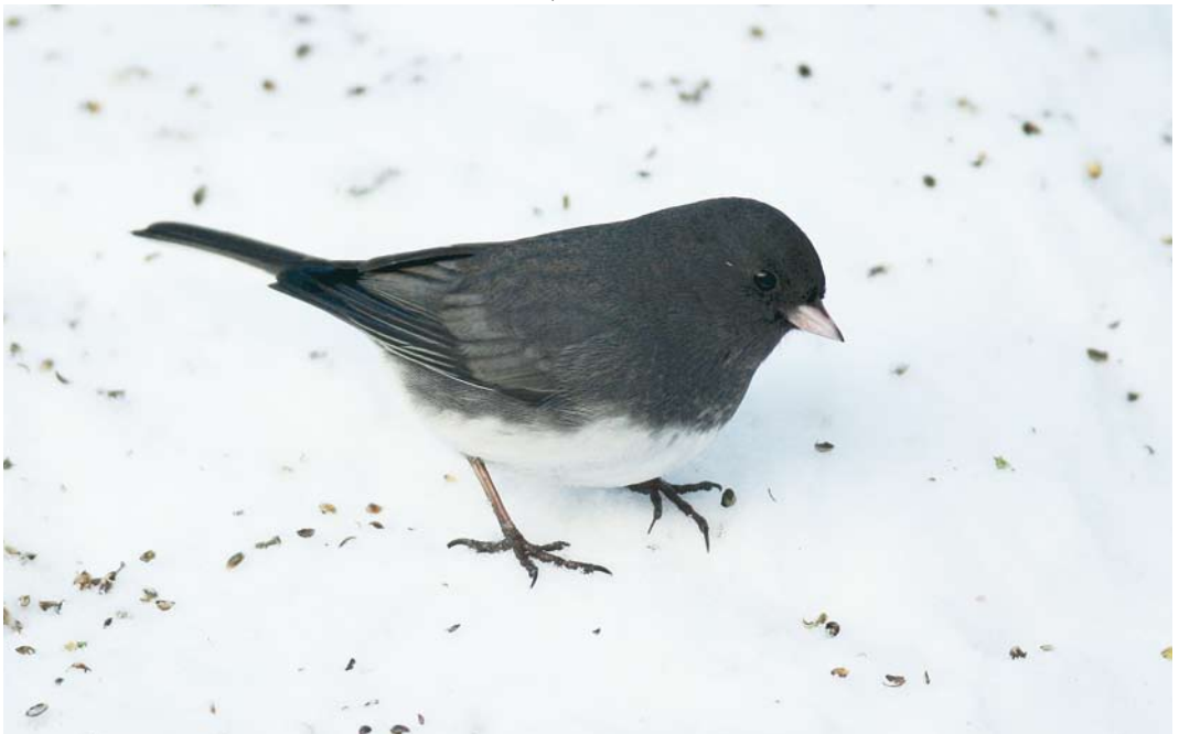
73 Dark-eyed Junco / Grijze Junco Junco hyemalis , adult male, Grimstad, Aust-Agder, Norway, 3 January 2010 (Tommy A Andersen)