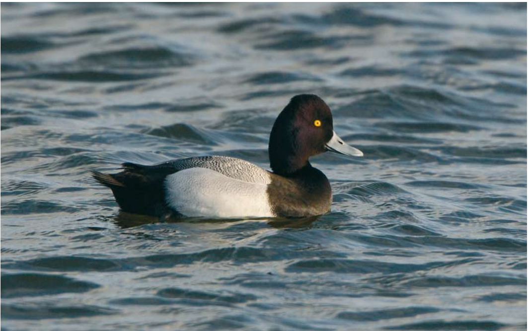
511 Lesser Scaup / Kleine Topper Aythya affinis , male, Oude Zeug, Noord-Holland, 23 March 2009