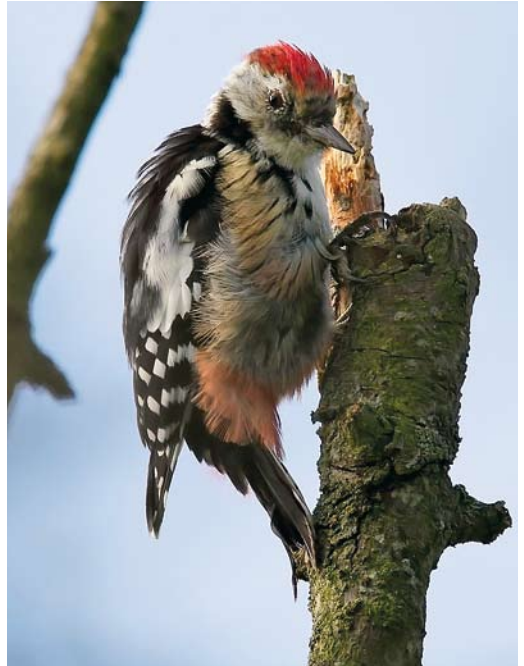
599 Jufferkraanvogel / Demoiselle Crane Grus virgo , eerstejaars, Westduinpark, Den Haag, Zuid-Holland, 9 oktober 2010 ( Garry Bakker ) 600 Middelste Bonte Specht / Middle Spotted Woodpecker Dendrocopos medius , Hollum, Ameland, Friesland, 25 september 2010 ( Geert Lamers ) 601 Bijeneters / European Bee-eaters Merops apiaster , Dijkwielen, Wieringermeer, Noord-Holland, 5 september 2010 ( Jankees Schwiebbe )