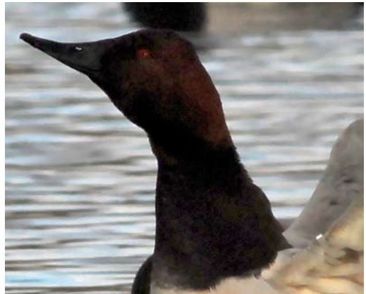
507 Ross's Geese / Ross' Ganzen Anser rossii , Waal en Burg, Texel, Noord-Holland, 28 September 2009 508 Green-winged Teal / Amerikaanse Wintertaling Anas carolinensis , male, Dijkmanshuizen, Texel, Noord-Holland, 4 April 2009 509 Canvasback / Grote Tafeleend Aythya valisineria , adult male, Noordhollands Duinreservaat, Castricum, Noord-Holland, 12 January 2008. Note wing-clip on left wing, which led to recirculation of this record and subsequently to removal of this species from the Dutch list.

Greenland White-fronted Goose / Groenlandse Kogans Anser albifrons flavirostris 14,66,1 9 October to 22 November, Hoorn, Terschelling , Friesland, adult, photographed, videoed (A Ouwkerk, M Feenstra, J Vink et al). 2005 12 November, Kampereiland, Kampen , Overijssel, photographed (G J ter Haar, C Fikkert et al).