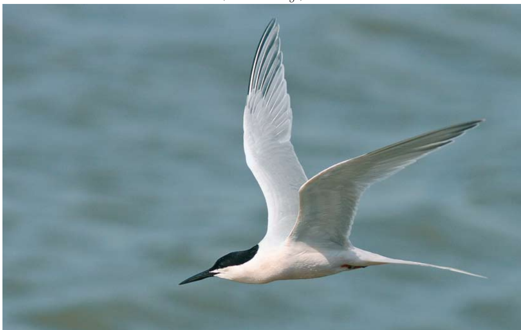
516 Roseate Tern / Dougalls Stern Sterna dougallii , adult, Stellendam, Zuid-Holland, 7 May 2009