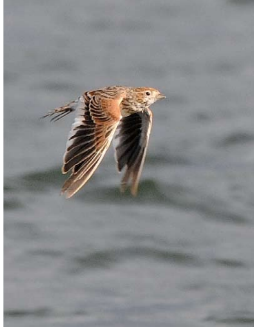
574 Red-flanked Bluetail / Blauwstaart Tarsiger cyanurus , Helgoland, Schleswig-Holstein, Germany, 14 October 2010 575 White-winged Lark / Witvleugelleeuwerik Melanocorypha leucoptera , Holmögadd, Västerbotten, Sweden, 23 September 2010 576 Hornemann's Redpoll / Groenlandse Witsuitbarmsijs Carduelis hornemanni hornemanni , Fair Isle, Scotland, 24 October 2010