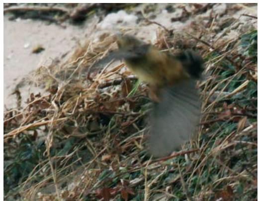
525 Red-spotted Bluethroat / Roodsterblauwborst Luscinia svecica svecica , De Cocksdorp, Texel, Noord-Holland, 18 May 2008 526 Spaanse Mus / Spanish Sparrow Passer hispaniolensis , male, Maasvlakte, Zuid-Holland, 20 April 2009 527 Iberian Chiffchaff / Iberische Tjiftjaf Phylloscopus ibericus , Haarlem, Noord-Holland, 7 June 2009 528 River Warbler / Krekelzanger Locustella fluviatilis , Nietap, Drenthe, 11 June 2009 529 Rufous-tailed Rock Thrush / Rode Rotslijster Monticola saxatilis , male, Veenhuizerstukken, Groningen, 1 May 2009 530 Pallas's Grasshopper Warbler / Siberische Sprinkhaanzanger Locustella certhiola , Maasvlakte, Zuid-Holland, 3 October 2009