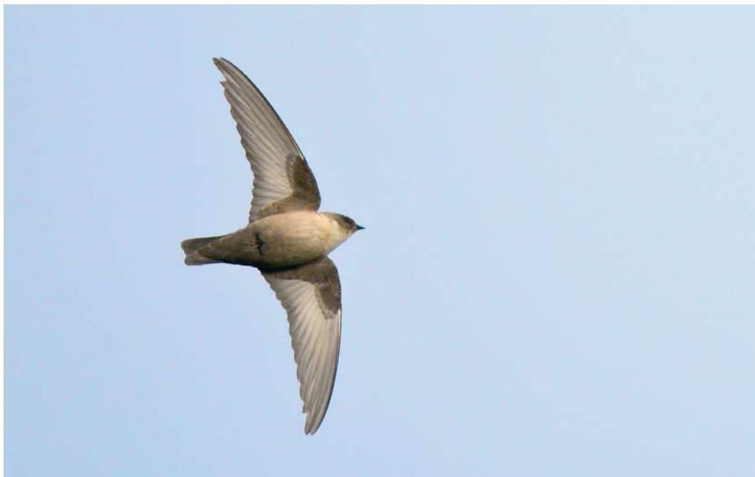
515 Eurasian Crag Martin / Rotszwaluw Ptyonoprogne rupestris , first-year, Sint Pietersberg, Maastricht, Limburg, 3 December 2009