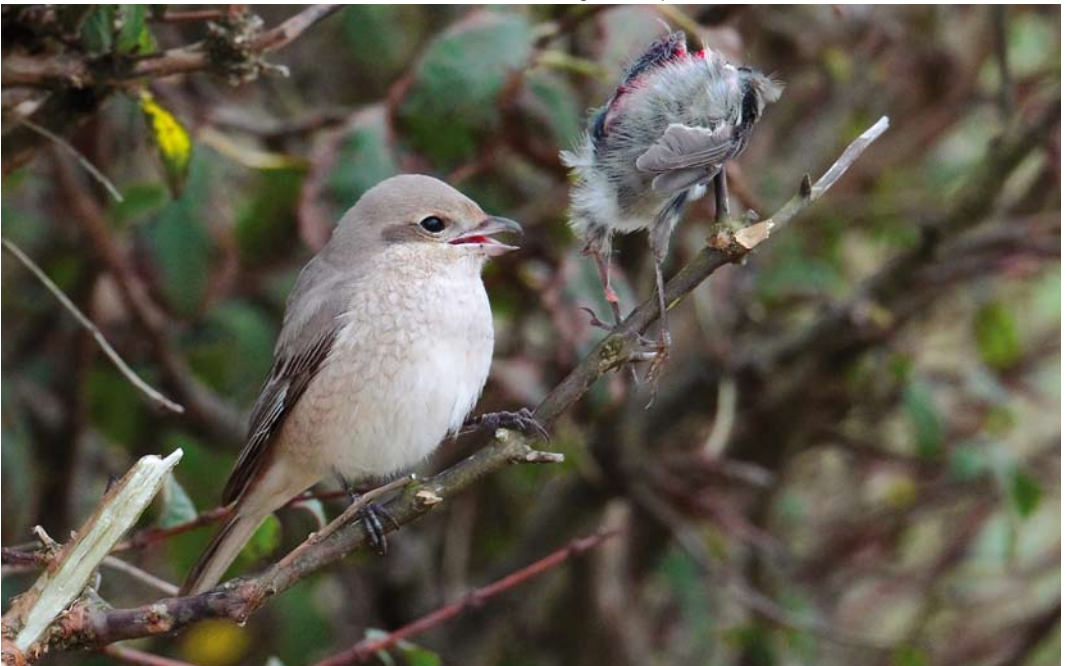
578 Daurian Shrike / Daurische Klauwier Lanius isabellinus , first-year, Spiggie, Mainland, Shetland, Scotland, 12 October 2010