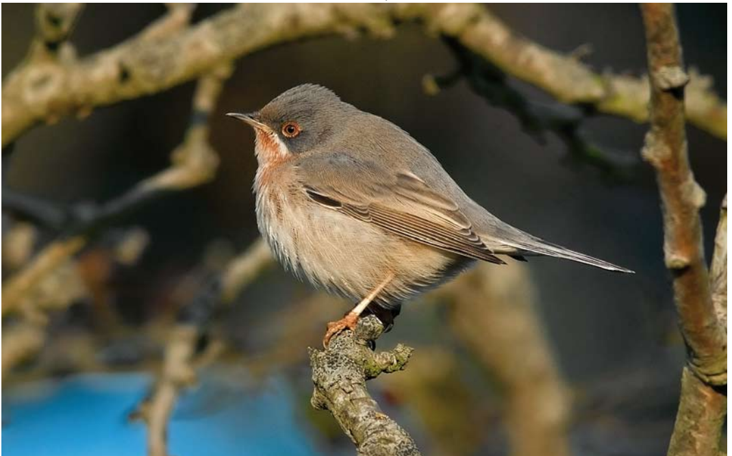
603 Baardgrasmus / Subalpine Warbler Sylvia cantillans , mannetje, Eierland, Texel, Noord-Holland, 9 oktober 2010