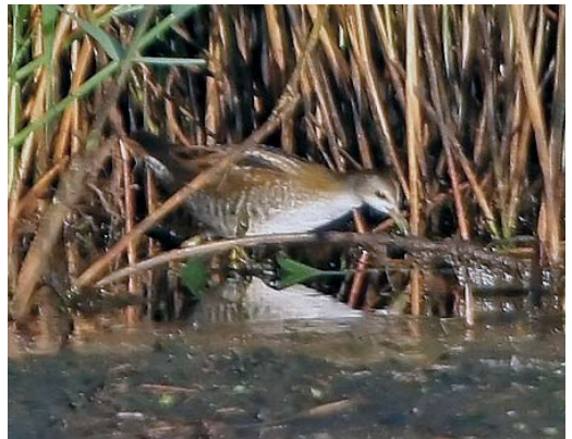
517 Black-winged Pratincole / Steppevorkstaartplevier Glaucopis tringoides , Strijen, Zuid-Holland, 6 November 2009 (Martin van der Schalk) 518 Alpine Swift / Alpengierzwaluw Apus melba , Kamperhoek, Flevoland, 3 April 2009 (Toy Janssen) 519 Buff-breasted Sandpiper / Blonde Ruiters Tryngites subruficollis , adult, Texel, Noord-Holland, 11 June 2009 (René Pop) 520 Long-toed Stint / Taigastrandloper Calidris subminuta , juvenile, Vreugderijkerwaard, Overijssel, 25 October 2009 (Jaap Denee) 521 White-rumped Sandpiper / Bonapartes Strandloper Calidris fuscicollis , first-year, Dijksgatsweide, Wieringermeer, Noord-Holland, 16 October 2009 (Harm Niesen) 522 Little Crane / Klein Waterhoen Porzana parva , juvenile, Groene Jonker, Zevenhoven, Zuid-Holland, 11 August 2009 (Marianne Wustenhoff)