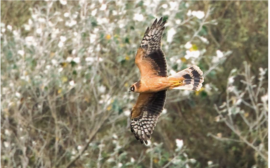
602 Steppekiekendief / Pallid Harrier Circus macrourus , eerstejaars, Petten, Noord-Holland, 4 oktober 2010 (Jos van den Berg)