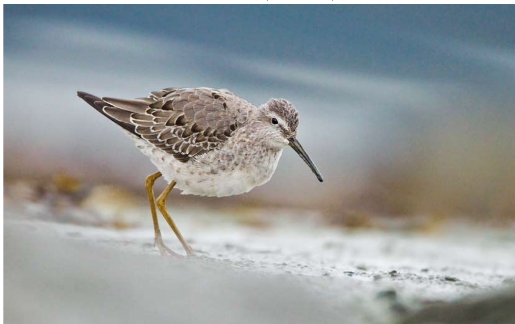
563 Stilt Sandpiper / Steltstrandloper Calidris himantopus , first-year, Stjørdal, Nord-Trøndelag, Norway, 17 October 2010 (Christian Tiller)