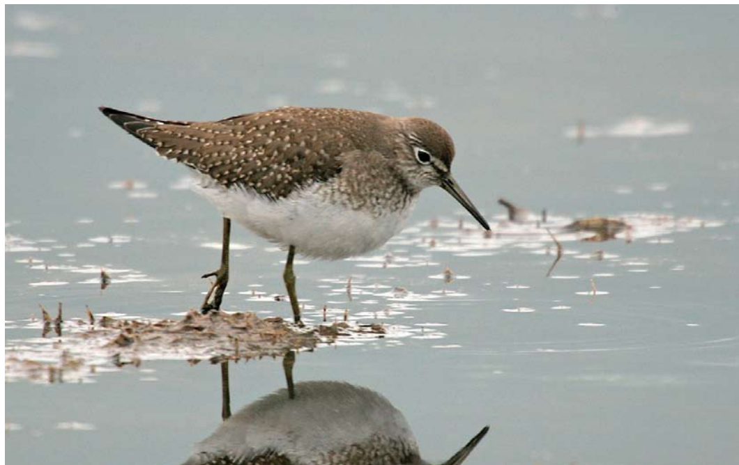
562 Solitary Sandpiper / Amerikaanse Bosruiter Tringa solitaria , Seaton, Devon, England, 14 October 2010