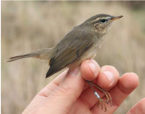
90 Bruine Boszanger / Dusky Warbler Phylloscopus fuscatus , Noordhollands Duinreservaat, Castricum, Noord-Holland, 11 november 2009