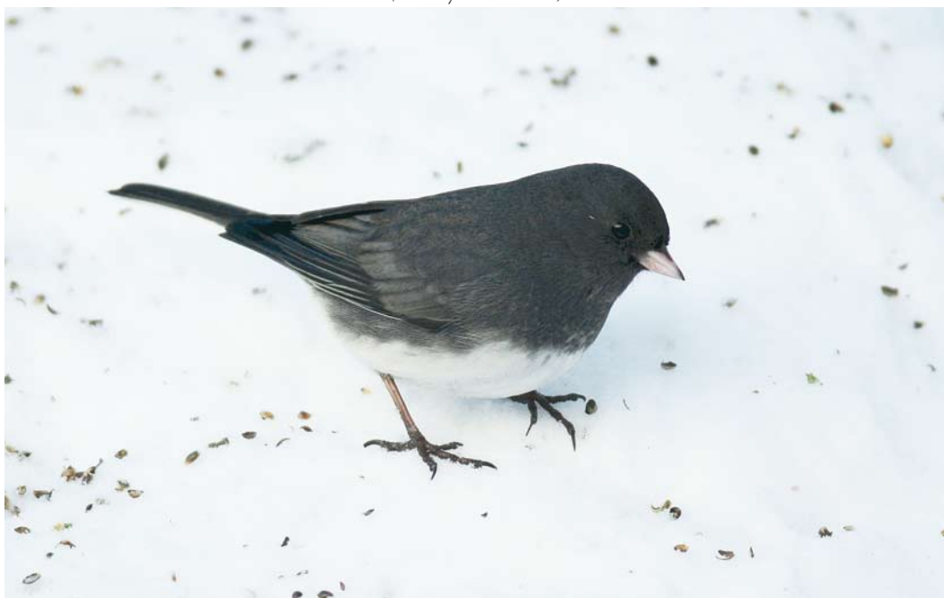
73 Dark-eyed Junco / Grijze Junco Junco hyemalis , adult male, Grimstad, Aust-Agder, Norway, 3 January 2010 (Tommy A Andersen)