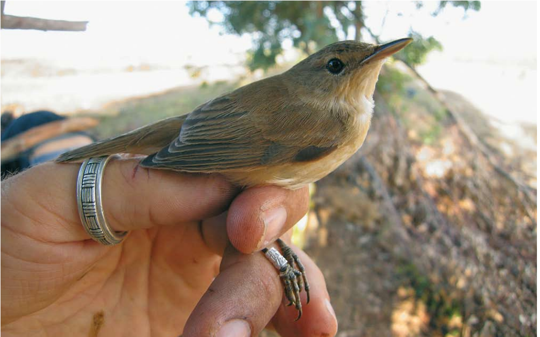
45 Local Moroccan reed warbler / karekiet Acrocephalus , Larrache, lower Loukkos, Morocco, 11 September 2009