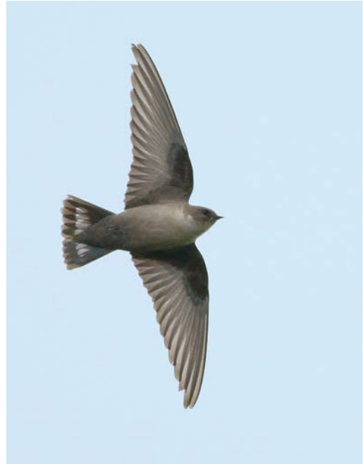
93 Rotszwaluw / Eurasian Crag Martin Ptyonoprogne rupestris , eerstejaars, Maastricht, Limburg, 7 december 2009 (Jorrit Vlot)