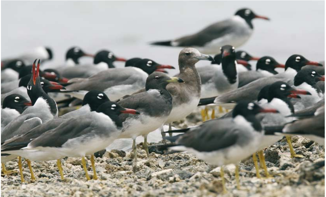
30 Sooty Gulls / Hemprichs Meeuwen Larus hemprichii , second-summer (centre left) and first-summer (centre right), and White-eyed Gulls / Witoogmeeuwen L. leucophthalmus , adult, El Gouna, Egypt, 10 May 2007 (Edwin Winkel). Second-summer Sooty as adult summer but with duller hood, feet and bill. Bill also lacking red tip and bib not yet complete. First-summer brighter than bird in plate 23 and still has typical pale juvenile-look. 31 Sooty Gull / Hemprichs Meeuw Larus hemprichii , adult summer, and White-eyed Gulls / Witoogmeeuwen L. leucophthalmus , adult, El Gouna, Egypt, 10 May 2007 (Edwin Winkel). Brownish upperparts and blackish hood of Sooty divided by clearly visible white collar, especially when neck is stretched. Legs are yellowish and fresh yellow bill has black ring and red tip. This bird, however, shows incomplete red tip, indicating that it is probably in its third summer.