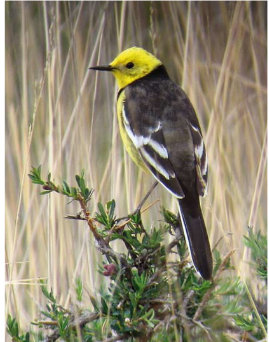
7 Black-backed Citrine Wagtail / Zwartrugcitroenkwikstaart Motacilla citreola calcarata , Tuura Suu, Kyrgyzstan, 31 May 2007 (Vincent van der Spek)

Summers can be hot, with temperatures in the high 30s. Springtime is usually pleasantly warm but it may rain at any time and, in this time of year, it is wise to bring a warm pull-over for high-altitude birding as well as a raincoat. Kyrgyzstan's avifauna is characterized by a mixture of species that also occur in south-eastern Europe, like European Roller Coracias garrulus , European Bee-eater Merops apiaster and Pied Wheatear Oenanthe pleschanka , steppe and desert species like Pallas's Sandgrouse Syrhaptus paradoxus and Mongolian Finch Bucanetes mongolicus , and Sino-Himalayan species like Himalayan Snowcock Tetraogallus himalayensis , the sought-after Ibisbill Ibidorhyncha struthersii , Eversmann's Redstart Phoenicurus erythronotus , Blue-capped Redstart P. coeruleocephalus and various rosefinches Carpodacus . Several species that occur as vagrant in Europe will raise the pulse of many birders, such as Citrine Wagtail Motacilla citreola , Paddyfield Acrocephalus agricola , Blyth's Reed A dumetorum , Greenish Phylloscopus trochiloides and Hume's Leaf Warbler P. humei , Azure Tit Cyanistes cyanus , and Red-tailed Lanius phoenicuroides (breeder), Daurian L. isabellinus (only on