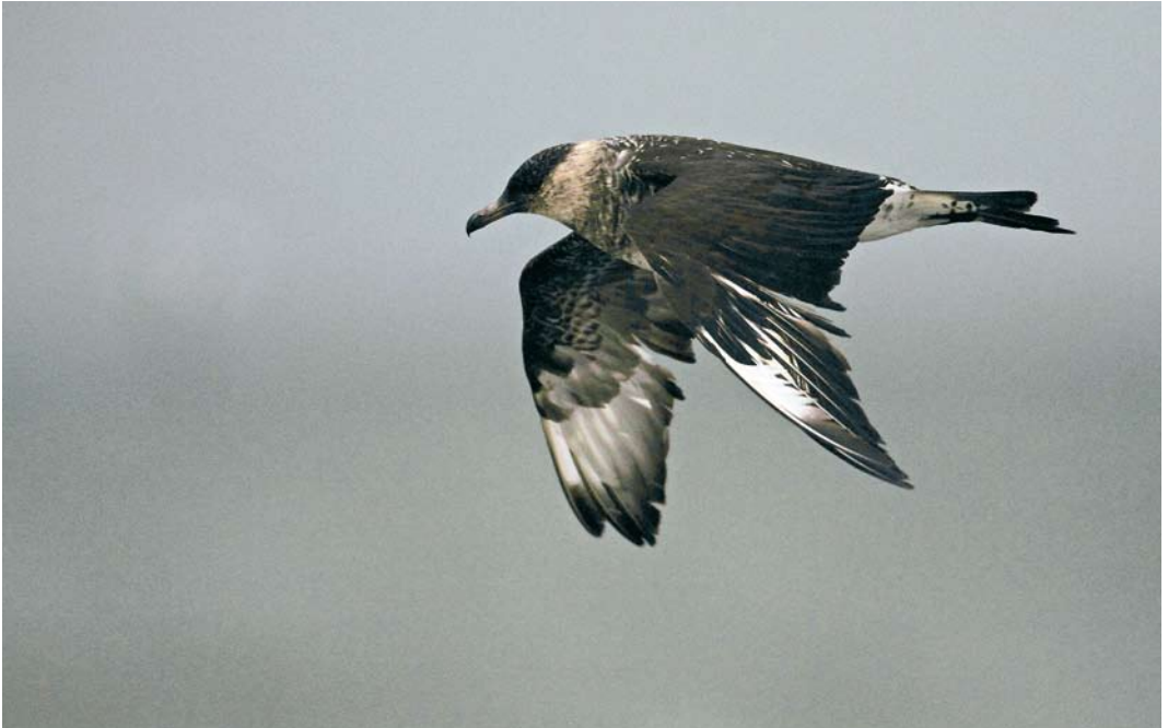
79 Middelste Jager / Pomarine Skua Stercorarius pomarinus , adult, Noordzee ten noorden van Ameland, Friesland, 28 november 2009