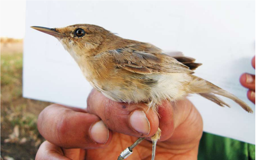
42 Local Moroccan reed warbler / karekiet Acrocephalus , adult, Larrache, lower Loukkos, Morocco, 7 September 2009 ( Pascal Provost ) 43 Local Moroccan reed warbler / karekiet Acrocephalus (left) and migrant Eurasian Reed Warbler / Kleine Karekiet A. scirpaceus , Larrache, lower Loukkos, Morocco, 9 September 2009 ( Pascal Provost ) 44 Local Moroccan reed warbler / karekiet Acrocephalus , Larrache, lower Loukkos, Morocco, 11 September 2009 ( Pascal Provost )