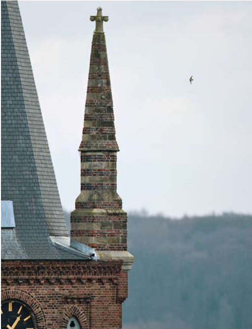
92 Rotszwaluw / Eurasian Crag Martin Ptyonoprogne rupestris , eerstejaars, Maastricht, Limburg, 10 december 2009 (Ran Schols)