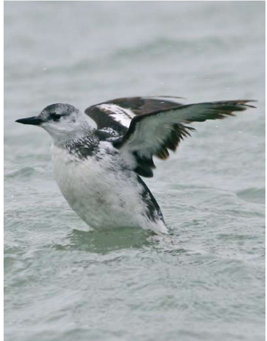
83 Steppevorkstaartplevier / Black-winged Pratincole Glareola nordmanni , Strijen, Zuid-Holland, 7 november 2009 84 Zwarte Zeekoet / Black Guillemot Cephus grylle , eerstejaars, Brouwersdam, Zeeland, 21 december 2009 85 Rosse Franjepoot / Red Phalarope Phalaropus fulicarius , eerste-winter, De Cocksdorp, Texel, Noord-Holland, 28 november 2009