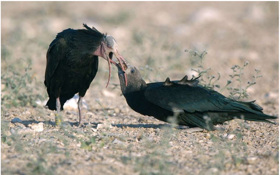
58 Northern Bald Ibises / Kaalkopibissen Geronticus eremita , adult feeding young, Palmyra, Syria, 13 July 2006

Could there still be undiscovered colonies in the