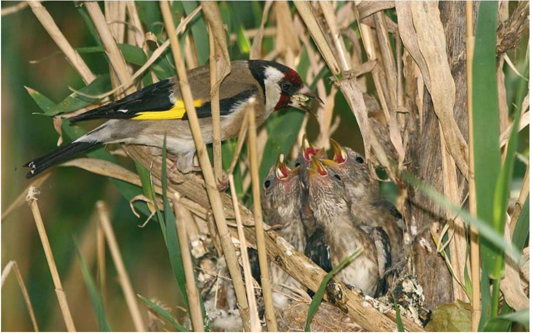
60 European Goldfinch / Putter Carduelis carduelis feeding its chicks, Azuqueca de Henares, Guadalajara, Spain, June 2009 ( Luis Miguel Ruiz Gordón ) 61 Eurasian Reed Warbler / Kleine Karekiet Acrocephalus scirpaceus , feeding same chicks of European Goldfinch / Putter Carduelis carduelis as in plate 60, Azuqueca de Henares, Guadalajara, Spain, June 2009 ( Luis Miguel Ruiz Gordón )