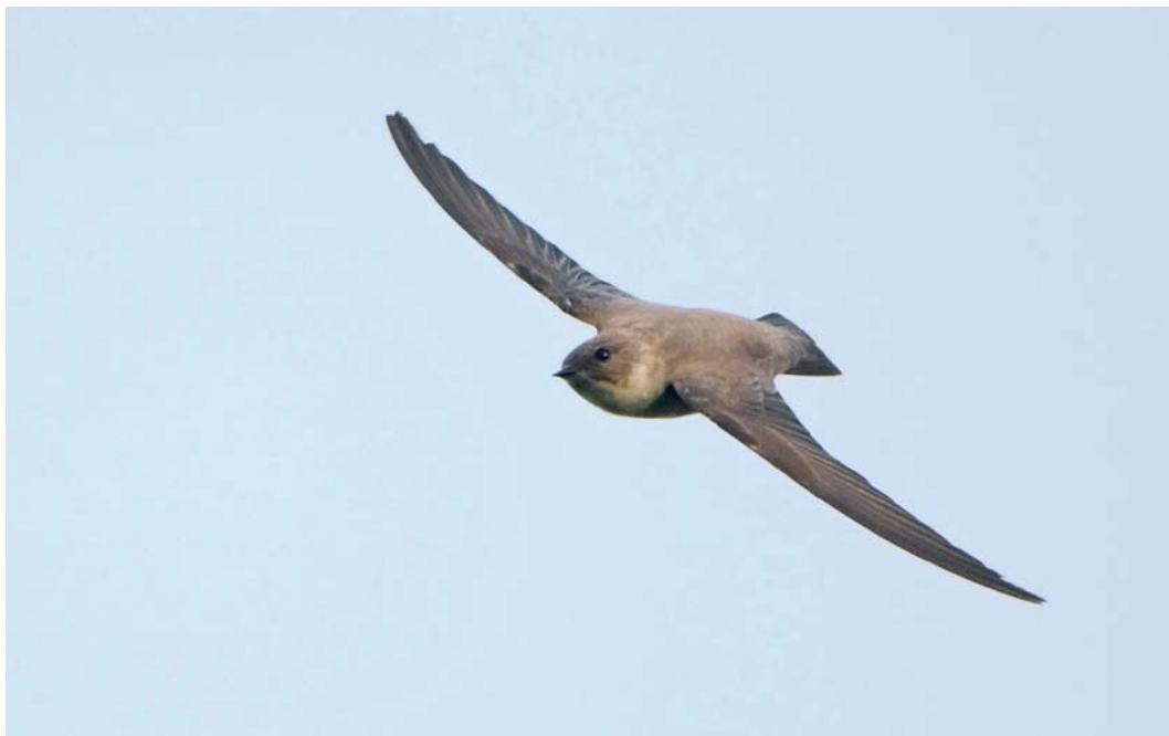
72 Eurasian Crag Martin / Rotszwaluw Ptyonoprogne rupestris , first-year, Maastricht, Limburg, Netherlands, 7 December 2009 (René Weenink)