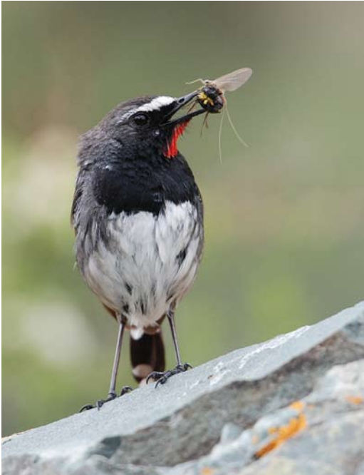
6 Himalayan Rubythroat / Zwartborstnachttegaal Luscinia pectoralis , adult male, May Saz, Kyrgyzstan, 26 June 2008