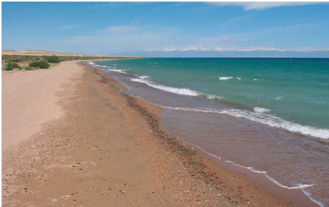
14 Issyk Kul lake at Ak Sai, Kyrgyzstan, 28 May 2007 ( Vincent van der Spek )