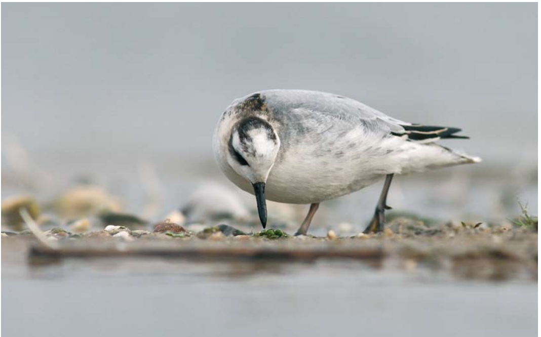
80 Rosse Franjepoot / Red Phalarope Phalaropus fulicarius , eerste-winter, Azewijn, Gelderland, 6 november 2009