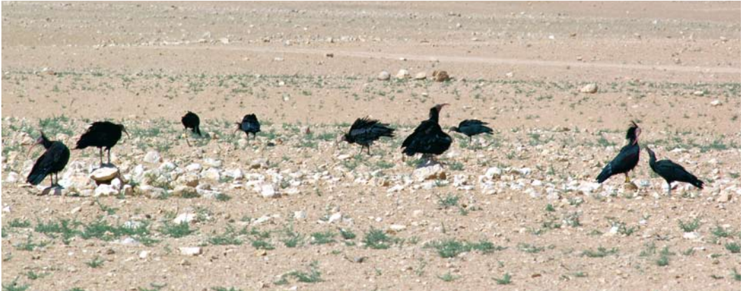
59 Northern Bald Ibises / Kaalkopibissen Geronticus eremita , Palmyra, Syria, March 2008

Middle East? This appears increasingly unlikely. Up to 14 birds were found wintering at Taif in the highlands of Yemen in 1985, which led to speculation about a possible breeding population in south-western Arabia, but numbers dwindled away and there have been no records for at least 15 years. In retrospect, these were probably Syrian birds. A massif in northern Iraq has suitable cliffs; a colony there is a remote possibility. A visit to the desert mountains of central Syria is a sobering experience: some of the precipices still bear the distinctive droppings of extinct colonies and until recently it was possible to find ibis feathers at their base. It appears that colonies containing 100s of pairs survived in the central Syrian desert into the 1980s (Serra et al 2009). Conservationists arrived too late to save them.