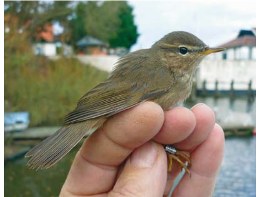
91 Bruine Boszanger / Dusky Warbler Phylloscopus fuscatus , eerstejaars, Gemaal Leemans, Den Oever, Noord-Holland, 22 november 2009

werd op 7 december gemeld bij Deventer, Overijssel. Door de trektellers werd een mager aantal van 31 Strandleeuweriken Eremophila alpestris genoteerd, waaronder één exemplaar op 8 november in De Grote Peel bij Meijel, Noord-Brabant. Het najaarstotaal (september-december) kwam daarmee uit op 187. Van 30 november tot 12 december vloog een Rotszwaluw Ptyonoprogne rupestris dagelijks rond boven de Sint Pietersberg bij Maastricht, Limburg; hoewel het om het zevende of achtste exemplaar voor Nederland ging was er slechts eenmaal eerder een twitchbaar geval (van twee exemplaren). Boerenzwaluwen Hirundo rustica werden nog gemeld op 2 december bij Sint-Michielsgestel, Noord-Brabant, op 3 december bij Enkhuizen, Noord-Holland, en op 4 december bij Nunspeet, Gelderland. Een late Huiszwaluw Delichon urbicum vloog op 9 december boven Kampen, Overijssel. Een Roodstuitzwaluw Cecropis daurica werd op 20 november om 09:46 gefotografeerd boven het Paulinaschor bij Biervliet, Zeeland, en om 11:15 werd vermoedelijk dezelfde c 7 km oostelijker in Terneuzen, Zeeland, opgemerkt.