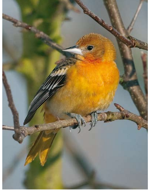
94 Baltimoretroepiaal / Baltimore Oriole Icterus galbula , eerste-winter, Oudorp, Alkmaar, Noord-Holland, 8 januari 2010 95-96 Baltimoretroepiaal / Baltimore Oriole Icterus galbula , eerste-winter, Oudorp, Alkmaar, Noord-Holland, 7 januari 2010