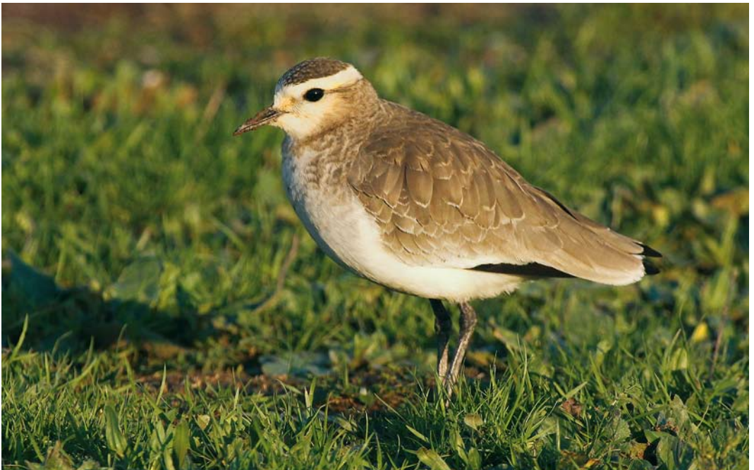
67 Sociable Lapwing / Steppekievit Vanellus gregarius , first-year, Benviuda, Alentejo, Portugal, 7 January 2010