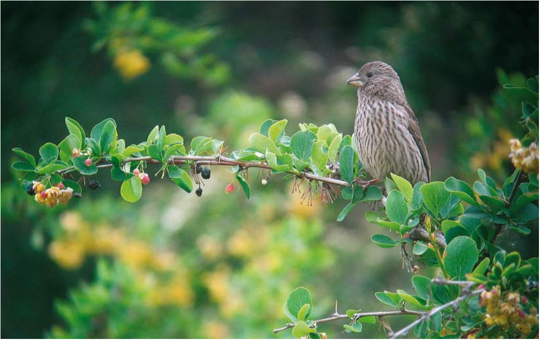
20 Red-mantled Rosefinch / Roze Roodmus Carpodacus rhodochlamys , female, Grigorievka, Kyrgyzstan, 25 May 2007 (Vincent van der Spek) 21 Red-tailed Shrike / Turkestaanse Klauwier Lanius phoenicuroides , female, Chon Kemin, Kyrgyzstan, 23 May 2007 (Vincent van der Spek) 22 Isabelline Wheatear / Izabeltapuit Oenanthe isabellina , Ak Soy, Kyrgyzstan, 25 May 2009 (Vincent van der Spek)