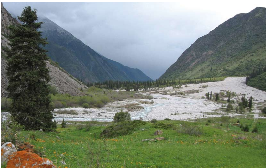
15 Mountain view at Ala Archa, Kyrgyzstan, 21 May 2007 ( Vincent van der Spek )