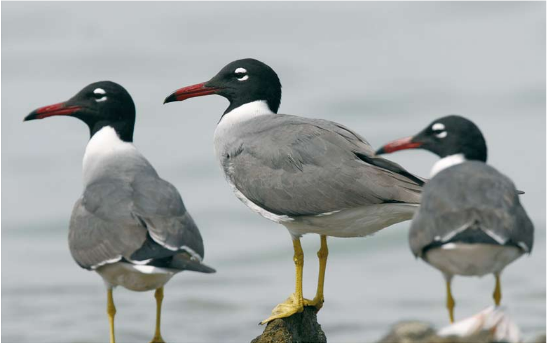
32 White-eyed Gulls / Witoogmeeuwen Larus leucophthalmus , adult summer, El Gouna, Egypt, 9 May 2007 (Edwin Winkel). Note striking appearance, with charcoal black hood, deep red bill with black tip, flashing white neck-band and fresh yellow legs. 33 Sooty Gull / Hemprichs Meeuw Larus hemprichii , adult (centre), and White-eyed Gulls / Witoogmeeuwen L. leucophthalmus , adult, El Gouna, Egypt, 10 May 2007 (Edwin Winkel)