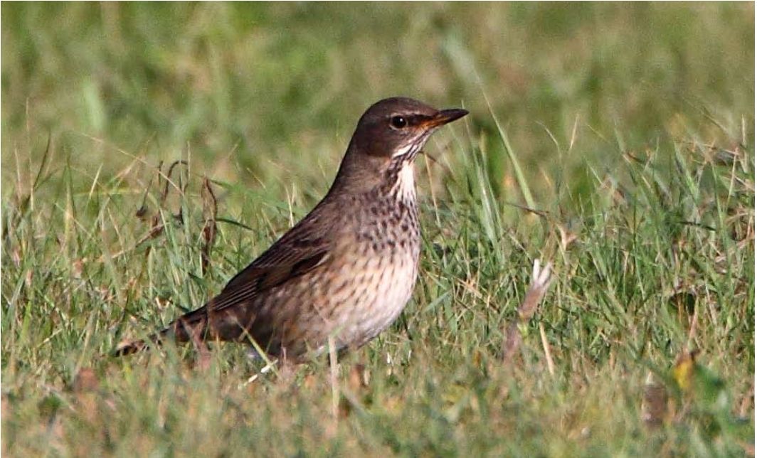
89 Zwartkeellijster / Black-throated Thrush Turdus atrogularis , adult vrouwtje, 't Horntje, Texel, Noord-Holland, 31 oktober 2009