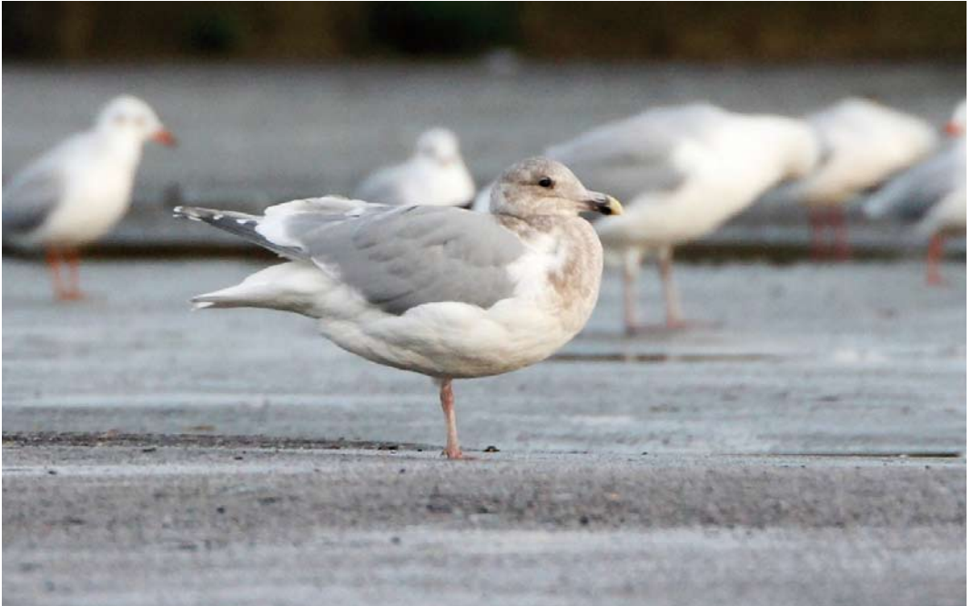
62-63 Glaucous-winged Gull / Beringmeeuw Larus glaucescens , fourth calendar-year, Århus, Midtjylland, Denmark, 27 November 2009