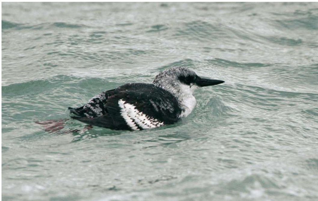
77 Zwarte Zeekoet / Black Guillemot Cephus grylle , eerstejaars, Brouwersdam, Zeeland, 4 december 2009