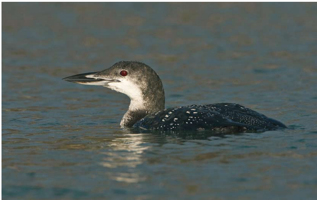
81 Ijsduiker / Great Northern Loon Gavia immer , adult, West-Terschelling, Terschelling, Friesland, 11 december 2009