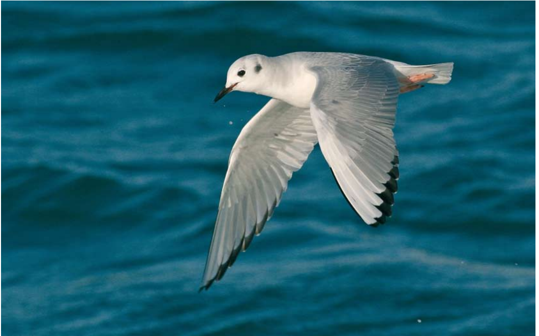
66 Bonaparte's Gull / Kleine Kokmeeuw Chroicocephalus philadelphia , adult, Tarragona, Catalunya, Spain, 6 January 2010