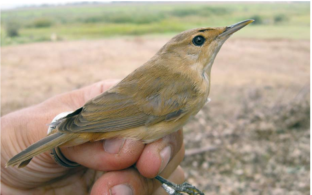
46 Local Moroccan reed warbler / karekiet Acrocephalus , Larrache, lower Loukkos, Morocco, 13 September 2009