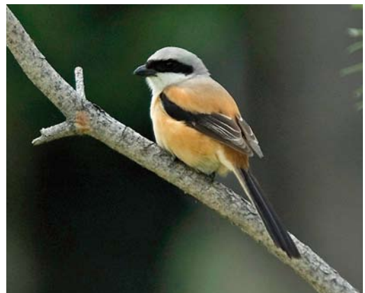
8 Azure Tit / Azuurmees Cyanistes cyanus , adult, Grigorievka, Kyrgyzstan, 25 May 2007 (Vincent van der Spek) 9 Common Rosefinch / Roodmus Carpodacus erythrinus ferghanensis , male, Grigorievka, Kyrgyzstan, 25 May 2007 (Vincent van der Spek) 10 Grey-headed Goldfinch / Grijskopputter Carduelis carduelis caniceps/parapanisi , Chon Kemin, Kyrgyzstan, 22 May 2007 (Vincent van der Spek) 11 Eversmann's Redstart / Eversmanns Roodstaart Phoenicurus erythronotus , Ala Archa, Kyrgyzstan, 21 May 2007 (Peter Hoppenbrouwers) 12 Golden Eagle / Steenarend Aquila chrysaetos , chick, Temir Kanat, Kyrgyzstan, 29 May 2007 (Vincent van der Spek) 13 Long-tailed Shrike / Langstaartklauwier Lanius schach , Bishkek, Kyrgyzstan, 20 May 2007 (Peter Hoppenbrouwers)