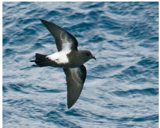
51-52 White-bellied Storm Petrel / Witbuikstormvogeltje Fregetta grallaria , between South Georgia and Gough Island (45°S, 21°W), 6 April 2009 (Steve N G Howell). Note narrow black leading edge to underwing, relatively small black hood and clean-cut, almost parallel-sided borders to large white belly patch on these two individuals. Distinct toe projections (score 2.5-3) suggest they are a smaller form of South Atlantic White-bellied Storm Petrel (cf plate 55). 53 Black-bellied Storm Petrel / Zwartbuikstormvogeltje Fregetta tropica , northeast of South Georgia (51°S, 30°W), 4 April 2009 (Steve N G Howell). Classically marked individual (belly score 4.5), but with no toe projection. 54 Black-bellied Storm Petrel / Zwartbuikstormvogeltje Fregetta tropica , at sea east-northeast of Campbell Island, New Zealand, 19 November 2008 (Steve N G Howell). Although this heavily marked individual (belly score 5, toe projection 3) agrees with classic field guide illustrations, such well-marked birds are probably in a minority in many areas of this species' range.

wings of Atlantic White-bellied have a narrower black leading edge than on Black-bellied (plate 50-55). Given that Haase did not specifically describe the extent of black on the chest and underwing, or any toe projection, these features cannot be evaluated, and the last is not relevant to Atlantic birds, anyway.