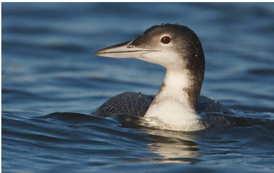
82 Ijsduiker / Great Northern Loon Gavia immer , eerstejaars, Harderhaven, Flevoland, 22 november 2009