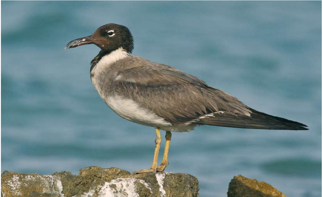
34 White-eyed Gull / Witoogmeeuw Larus leucophthalmus , adult moulting to winter plumage, El Gouna, Egypt, 8 September 2008 ( Edwin Winkel ). Late summer birds become darker by a reddish-brown tinge on upperparts and head due to wear. Leg colour also warmer now compared with unnatural yellow of adult winter and summer. Bill already blackish and first fresh grey scapulars starting to appear. 35 White-eyed Gull / Witoogmeeuw Larus leucophthalmus , adult winter, El Gouna, Egypt, 5 October 2007 ( Edwin Winkel ). Hood showing white spots and flecks, especially on chin and throat. Bare parts duller than in adult summer, legs paler yellow and red bill with blackish wash.