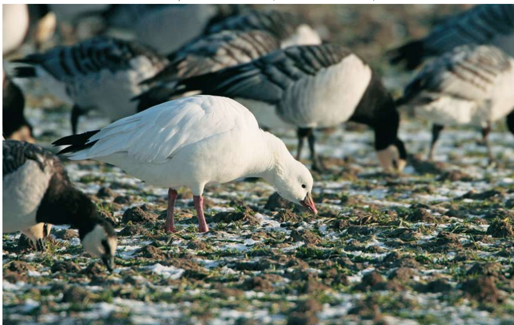
78 Ross' Gans / Ross's Goose Anser rossii , met Brandganzen / Barnacle Geese Branta leucopsis , Haamstede, Zeeland, 19 december 2009 (Martin van der Schalk)