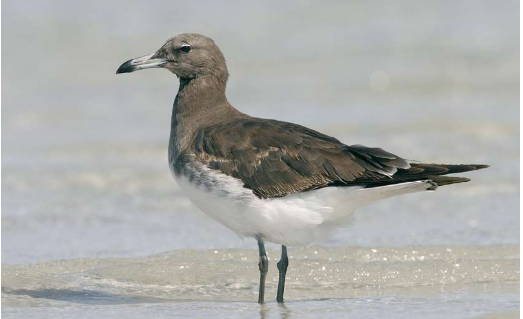
23 Sooty Gull / Hemprichs Meeuw Larus hemprichii , first-summer, El Gouna, Egypt, 16 May 2007 ( Edwin Winkel ). Mantle and scapulars are dark and uniform but coverts still show some faded juvenile feathers. Pointed and worn primaries also still juvenile. 24 Sooty Gull / Hemprichs Meeuw Larus hemprichii , second-winter, El Gouna, Egypt, 11 October 2007 ( Edwin Winkel ). Uniform chocolate-brown except for the head which is still very pale, as in most first-winters. Note new second generation primaries with rounded tip and greenish legs compared with greyish ones of younger bird in plate 23.