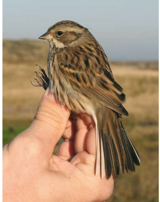
2-3 Maskergors / Black-faced Bunting Emberiza spodocephala oligoxantha , eerstejaars vrouwtje, Noordhollands Duinreservaat, Castricum, Noord-Holland, 18 november 2007

dicht duingras begroeid valleetje, waar hij ondanks zorgvuldig zoeken niet meer werd teruggevonden. De waarneming is door de Commissie Dwaalgasten Nederlandse Avifauna (CDNA) aangevaard als derde geval en het betreft het 16e geval voor Europa.