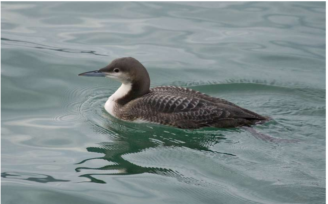
65 Pacific Loon / Pacifische Parelduiker Gavia pacifica , first-year, Santoña, Cantabria, Spain, 7 December 2009