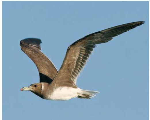
26 White-eyed Gull / Witoogmeeuw Larus leucophthalmus , juvenile, El Gouna, Egypt, 5 October 2007 (Edwin Winkel). Typical bird with whitish face and chin, buffy scales on upperparts, all-black bill and dull yellow legs. 27 White-eyed Gull / Witoogmeeuw Larus leucophthalmus , juvenile, El Gouna, Egypt, 8 September 2008 (Edwin Winkel). Black bill, yellowish legs and whitish chin characteristic but less pronounced bird than bird in plate 26. 28 White-eyed Gull / Witoogmeeuw Larus leucophthalmus , second-winter, El Gouna, Egypt, 10 October 2007 (Edwin Winkel). Hood and bare parts still very like first-summer but upperparts now concolorous. Scattered brown-tipped feathers visible and greater coverts darker than in adult. 29 Sooty Gull / Hemprichs Meeuw Larus hemprichii , adult moulting to winter plumage, El Gouna, Egypt, 14 September 2009 (Edwin Winkel). All striking features have gone and bird is more uniform in coloration. Head has turned brown and white neck-ring and eyelid less prominent. Green bill (including markings) and legs inconspicuous but red orbital ring suddenly stands out! Flight-feathers and tail very worn and about to be moulted.

white partial eye-ring above and below the eye (eye-lids) are conspicuous (these eye-lids gave the species its scientific and English name). In winter, White-eyed also becomes duller. The neck collar turns almost grey and the black hood shows white streaks, most prominently on forehead, chin and throat. The legs become more green and the red of the bill gets a blackish wash.