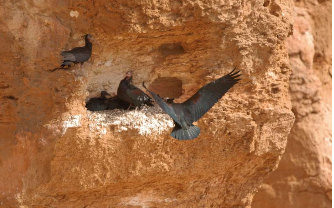
56 Northern Bald Ibises / Kaalkopibissen Geronticus eremita , Palmyra, Syria, 20 June 2006 (Mahmud Abdallah)