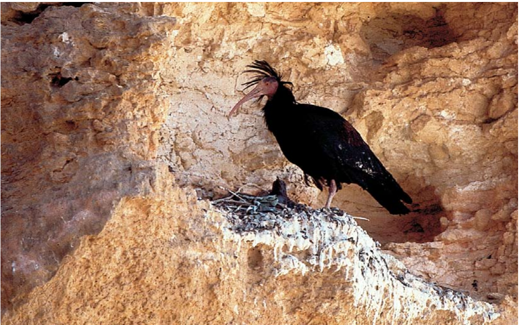
57 Northern Bald Ibis / Kaalkopibis Geronticus eremita , adult, Palmyra, Syria, spring 2008