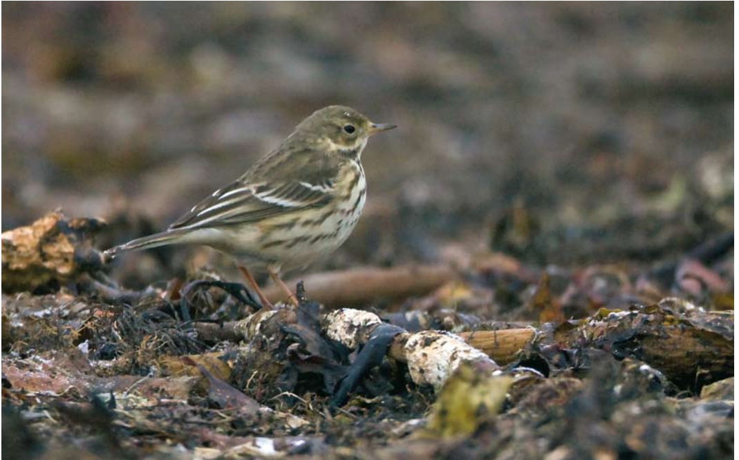
74 Siberian Buff-bellied Pipit / Siberische Waterpieper Anthus rubescens japonicus , Nordhassel, Lista, Vest-Agder, Norway, 19 December 2009