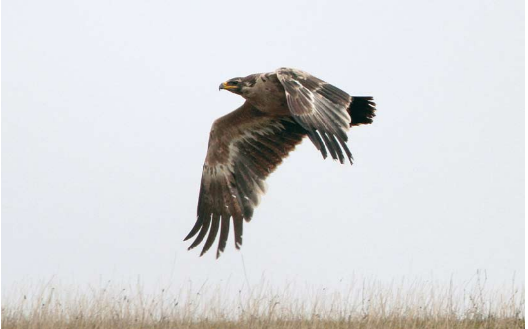
64 Steppe Eagle / Stepparend Aquila nipalensis , Skabersjö, Skåne, Sweden, 14 November 2009 (Martin van der Schalk)