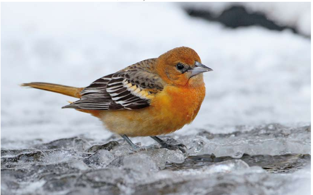
75 Baltimore Oriole / Baltimoretroepiaal Icterus galbula , first-winter, Oudorp, Alkmaar, Noord-Holland, Netherlands, 9 January 2010 (Martin van der Schalk)