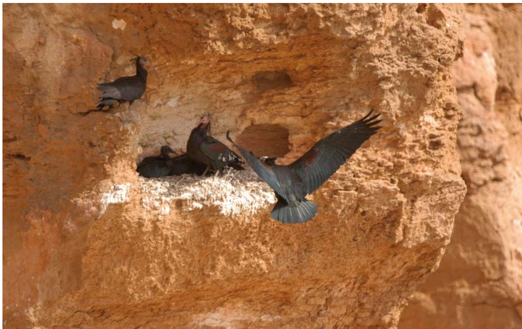
56 Northern Bald Ibises / Kaalkopibissen Geronticus eremita , Palmyra, Syria, 20 June 2006 (Mahmud Abdallah)