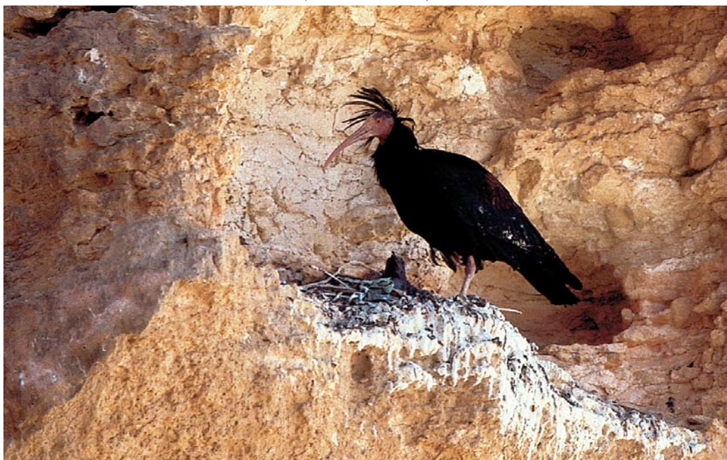
57 Northern Bald Ibis / Kaalkopibis Geronticus eremita , adult, Palmyra, Syria, spring 2008 (Mahmud Abdallah)