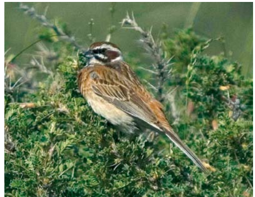
16 Masked Wagtail / Maskerkwikstaart Motacilla personata , Temir Kanat, Kyrgyzstan, 29 May 2007 (Vincent van der Spek) 17 Red-fronted Serins / Roodvoorhoofdkanaries Serinus pusillus , Grigorievka, Kyrgyzstan, 25 May 2007 (Vincent van der Spek) 18 White-bellied Dipper / Witbuikwaterspreeuw Cinclus cinclus leucogaster , May Saz, Kyrgyzstan, 14 July 2009 (Machiel Valkenburg) 19 Meadow Bunting / Weidegors Emberiza cioides , Jeti Ögüz, Kyrgyzstan, 27 May 2007 (Peter Hoppenbrouwers)

attract waders like Terek Sandpiper and with some luck one may stumble upon a Lesser Sand Plover Charadrius mongolus . South of Issyk Kul there are more mountainous areas with alpine species. The river valley west of the village of Tuura-Suu, south of the western shores of the big lake, might be the nearest spot from Bishkek to see one of the most remarkable waders of the world: Ibisbill. The species is more common further east but this area can be reached within half a day from the capital. To reach this site you pass the beautiful Tuura-Suu gorge, with its typical lower mountainous species. Cinereous Vultures Aegypius monachus are not uncommon here.