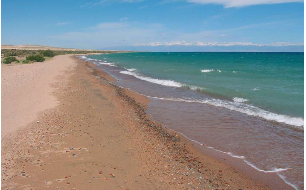
14 Issyk Kul lake at Ak Sai, Kyrgyzstan, 28 May 2007