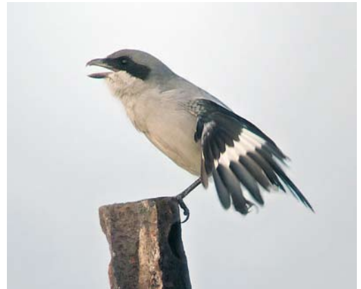
68 Bufflehead / Buffelkopeend Bucephala albeola , first-winter male, Marisma Blanca, Cantabria, Spain, 7 January 2010 ( Daniel López Velasco ) 69 Hooded Merganser / Kokardezaagbek Lophodytes cucullatus , Ponta Delgada, São Miguel, Azores, 4 January 2010 ( Gerbrand Michielsen ) 70 Brown Shrike / Bruine Klauwier Lanius cristatus , first-year, Staines Moor, Surrey, England, 29 October 2009 ( David Hutton ) 71 Desert Grey Shrike / Woestijnklapekster Lanius elegans algeriensis , Siracusa, Sicily, Italy, 23 November 2009 ( Andrea Corso )

Spain, the first-year female Belted Kingfisher Megaceryle alcyon near Cartagena from 16 November to 6 December was relocated 15 km to the east at Albuñón on 4 January and still present in mid-January. In a paper on the parapatric White-backed Woodpecker Dendrocopos leucotos and Lilford's Woodpecker D. l. lilfordi , morphological differences, biogeography and ideas on taxonomic treatments were presented (J-L Grangé & F Vuilleumier in Nos Oiseaux 56: 195-222, 2009); it is estimated that at least 3400 pairs of Lilford's survive in mountain areas of southern Europe (in Pyrenees, central Italy, Balkan countries, northern Greece, a few mountain areas in Turkey, and Caucasus) and a possible contact zone is mentioned for the northern Balkans. The authors do not want to propose a formal species rank for Lilford's before this is confirmed by a more comprehensive and comparative study that includes the owstoni white-backed woodpecker on Amami, Japan.