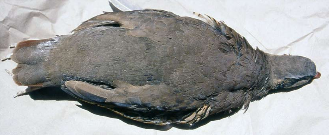
106 Sicilian Rock Partridge / Siciliaanse Steenpatrijs Alectoris (graeca) whitakeri , collected at Malvagna, Nebrodi, Sicily, Italy ( Angelo Scuderi ). Even more uniform bird than in plate 104, showing homogenous upperparts of whitakeri .