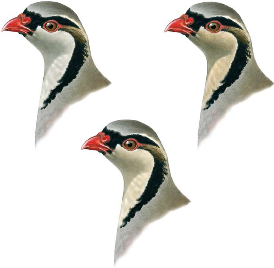
FIGURE 5 Variability of head pattern in Sicilian Rock Partridge / Siciliaanse Steenpatrijs Alectoris (graeca) whitakeri (Lorenzo Starnini). Below: typical bird, showing off-white throat with pale isabelline hue; upper right: frequent pattern with intense creamy-drab isabelline tinge; upper left: greyish tinged throat, similar to several saxatilis . Note ear-coverts stripe pattern and colour and black collar pattern.

2004, Baratti et al 2005, Barbanera et al 2005, 2009ab, Barilani et al 2007ab). However, back in 1934, when Schiebel described whitakeri , there were apparently no introduced chukar in Sicily, therefore also pure birds may show an isabelline or creamy tinge.