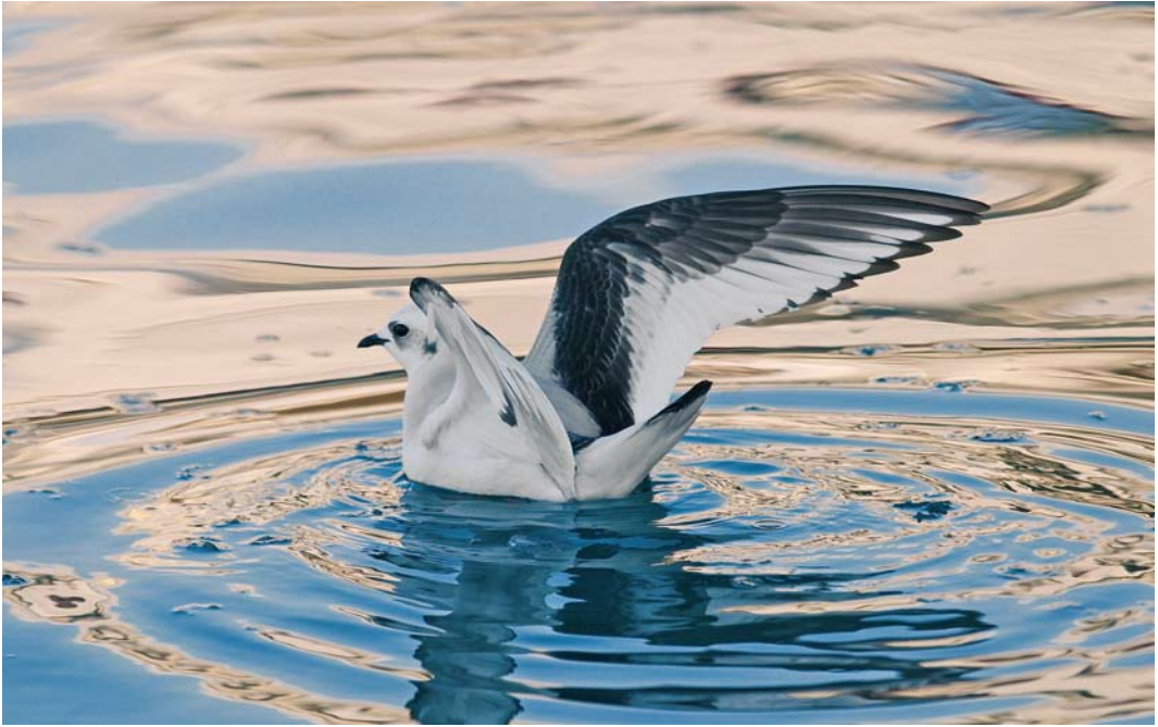
164 Ross's Gull / Ross' Meeuw Rhodostethia rosea , first-winter, Toftir, Eysturoy, Faeroes, February 2010

Netherlands since 2005. At Kalmthoutse Heide, Oost-Vlaanderen, a female with five young in 2009 constituted the first breeding ever for Belgium. The fifth Hooded Merganser Lophodytes cucullatus for the Azores stayed from 28 December 2009 to at least mid-March at Ponta Delgada, São Miguel. In freezing winter weather, a female-type paired up with a male Smew at Zwartewater, Overijssel, between 15 January and 24 February. Long-staying male American Black Ducks Anas rubripes occurred, for instance, on Achill Island, Mayo, Ireland, into March, at Melrakkaslétta, Iceland, until at least 11 February, on Tresco, Scilly, England, until 11 February and at Hlíðarvatn, Selvogur, Iceland, until at least 10 February. In Cornwall, England, a male occurred at Dozmary Pool from 16 February into March. In the Netherlands, an unringed confiding male Baikal Teal A formosa stayed in ice-free water at Almelo, Overijssel, from 30 January to 24 February. In Ireland, both a hybrid and a pure bird were seen at Tacumshin, Wexford, between 5 January and 23 February (cf Dutch Birding 32: 52, 2010). The wintering population in Korea increased from a declining 75 000 in the early 1990s to over one million in 2009; this spectacular increase is believed to be linked to lots of land reclaiming as well as to a decline in hunting pressure.