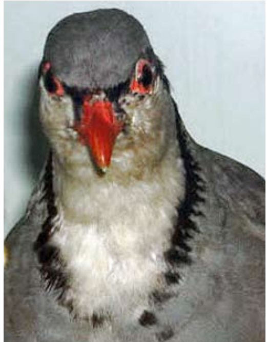
117 Sicilian Rock Partridge / Siciliaanse Steenpatrijs Alectoris (graeca) whitakeri (collected at Monte Etna, Sicily, Italy), Museo ornitologico di Randazzo, collezione Angelo Priolo, Italy ( Andrea Corso ). Bird with broken collar and creamy tinged throat.

more with mantle; the same applies for the neck side and/or neck base. Nominate graeca is paler, more diffusely and intensely tinged greyish or cerulean-grey, though some birds are duller and darker, approaching whitakeri . The median upperwing-coverts in whitakeri show the least amount of greyish-bluish tinge on the inner web. The upperparts of orlandoi are the palest and the most cerulean-grey to cold greyish.