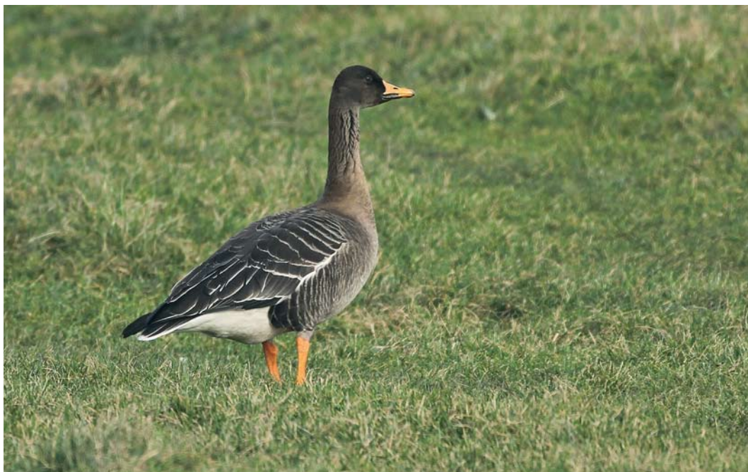
182 Taigarietgans / Taiga Bean Goose Anser fabalis , Retranchement, Zeeland, 17 februari 2010 (Johan Buckens)