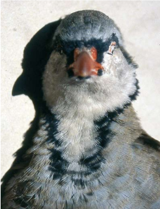
116 Sicilian Rock Partridge / Siciliaanse Steenpatrijs Alectoris (graeca) whitakeri , collected at Malvagna, Sicily, Italy, late autumn ( Angelo Scuderi ). Same specimen as in plate 112-115.