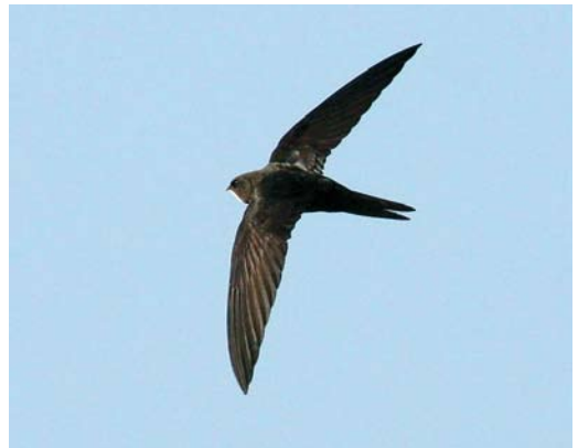
122 Common Swift / Gierzwaluw Apus apus apus , Selby, North Yorkshire, England, 12 July 2008 (Ross Ahmed). Worn, non-juvenile bird. Note that small white throat patch does not reach past eye and is sharply set off from dark head. 123 Asian Common Swift / Aziatische Gierzwaluw Apus apus pekinensis , Koko Nor (now known as Qinghai lake), Qinghai province, China, 27 May 2008 (Paul French). Note dark head without obvious eye-mask. 124 Common Swift / Gierzwaluw Apus apus apus , Selby, North Yorkshire, England, 15 July 2008 (Ross Ahmed). Non-juvenile bird with full crop. 125 Common Swift / Gierzwaluw Apus apus apus , Selby, North Yorkshire, England, 15 July 2008 (Ross Ahmed). Non-juvenile bird. Note dark head without obvious eye-mask; pale throat is sharply set off from rest of head and forehead is dark.

plumage or abrasion that could be used to separate adults from first-years, so all birds caught were classed as adults. Studies on known first-year swifts will be important to establish criteria for identification of this age group. Currently, however, there are no variations in appearance that can be attributed to differences in age.