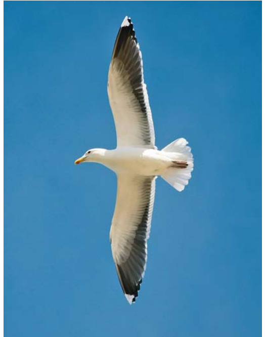
173 Lappet-faced Vulture / Oorgier Torgos tracheliotus , Shalatin, Egypt, 3 March 2010 ( Frédéric Jiguet ) 174 Cape Gull / Afrikaanse Kelpmeeuw Larus dominicanus vetula , adult, Khnifiss lagoon, Western Sahara, Morocco, 8 March 2010 ( Kris De Rouck ) 175 Spoon-billed Sandpiper / Lepelbekstrandloper Eurynorhynchus pygmeus , Pak Thale, Thailand, 12 January 2010 ( Edwin Winkel )