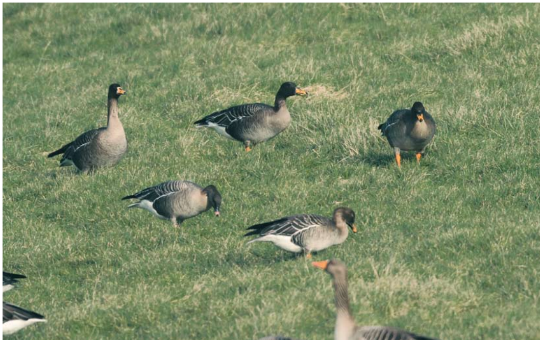
181 Taigarietgans / Taiga Bean Geese Anser fabalis , met Kleine Rietgans / Pink-footed Goose A brachyrhynchus en Grauwe Gans / Greylag Goose A anser , Retranchement, Zeeland, 17 februari 2010