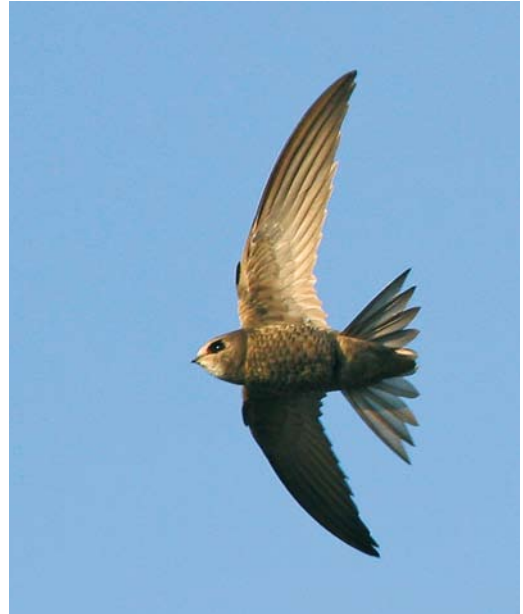
126 Common Swift / Gierzwaluw Apus apus apus , Selby, North Yorkshire, England, 15 July 2008. Same bird as in plate 124. Note essentially dark head, with limited white throat patch (not reaching past eye).