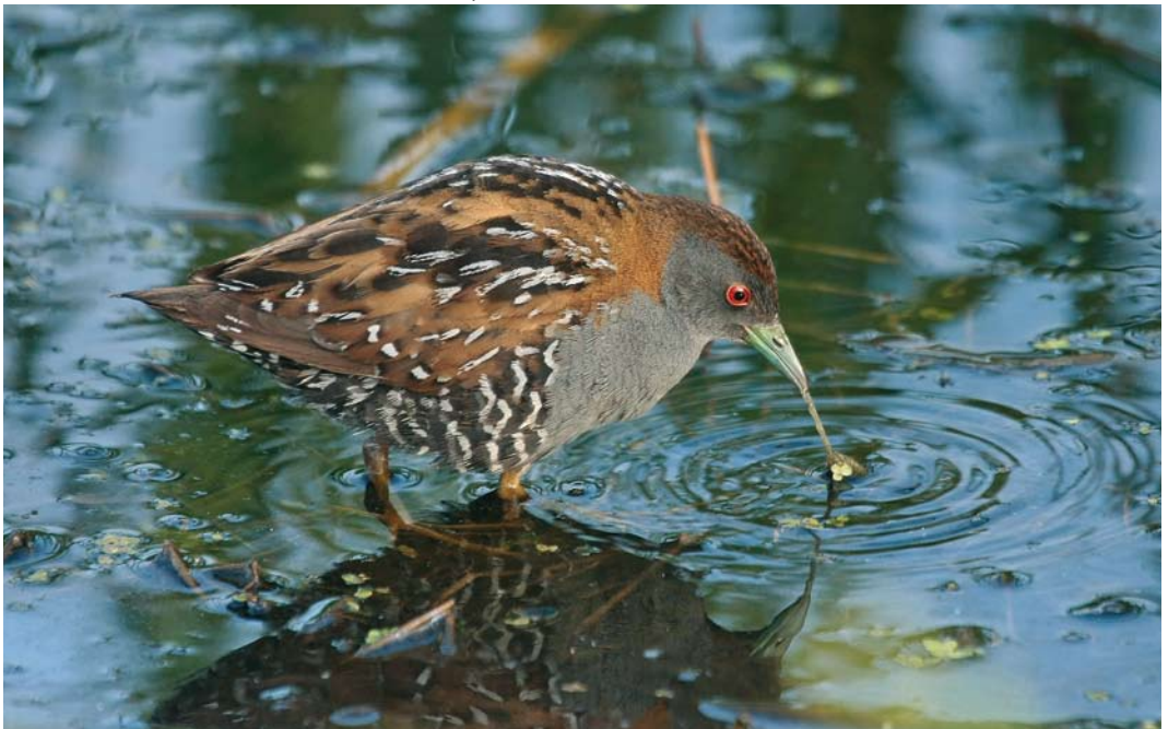
148 Kleinst Waterhoen / Baillon's Crake Porzana pusilla , mannetje, Groene Jonker, Zevenhoven, Zuid-Holland, 13 juni 2009