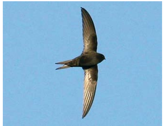
134 Common Swift / Gierzwaluw Apus apus apus , Backworth, Northumberland, England, 4 August 2008 (Ross Ahmed). Note dark head without obvious eye-mask and only small throat patch sharply set off from rest of head. This bird is an example of an adult that has started its primary moult near the breeding grounds. 135 Pallid Swift / Vale Gierzwaluw Apus pallidus , South Gare, Cleveland, England, 2 November 2005 (Ian Boustead). Head looking paler brown than body, with blackish eye-mask. In upperwing of some pallidus , all greater primary coverts appear distinctly paler than outer primaries, as is the case here. This is not usually shown by apus but see the pekinensis in plate 132. 136 Asian Common Swift / Aziatische Gierzwaluw Apus apus pekinensis , Koko Nor (now known as Qinghai lake), Qinghai province, China, 27 May 2008 (Paul French). Head looking essentially dark, like body. 137 Common Swift / Gierzwaluw Apus apus apus , Selby, North Yorkshire, England, 15 July 2008 (Ross Ahmed). Non-juvenile bird. In addition to blackish plumage, note dark head and scaling of undertail-coverts more prominent than on belly/flanks.

to put more emphasis on a few other characters that may be less dependent on light conditions (cf Chantler 1990, Chantler & Driessens 2000, van Duivendijk 2008). These may be helpful when dealing with the large colour variation in swifts (as described above). They are: 1 general shape; 2 head pattern; 3 pattern of scaling on underparts; and 4 features in under- and upperwing.