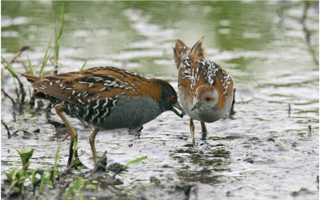
147 Kleinst Waterhoen / Baillon's Crake Porzana pusilla , mannetje en vrouwtje, Groene Jonker, Zevenhoven, Zuid-Holland, 15 juni 2009 ( Edwin Winkel )