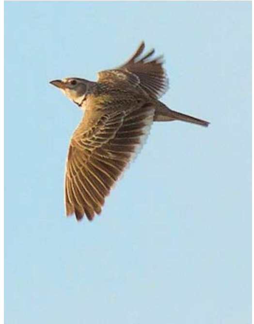
236 Eurasian Crag Martin / Rotszwaluw Ptyonoprogne rupestris , Hernar, Hordaland, Norway, 5 May 2011 ( Julian Bell ) 237 Calandra Lark / Kalanderleeuwerik Melanocorypha calandra , Paal 48, Vlieland, Friesland, Netherlands, 8 May 2011 ( Jurrien van Deijk ) 238 Forster's Tern / Forsters Stern Sterna forsteri , adult, Tacumshin, Wexford, Ireland, 13 May 2011 ( Killian Mullarney )