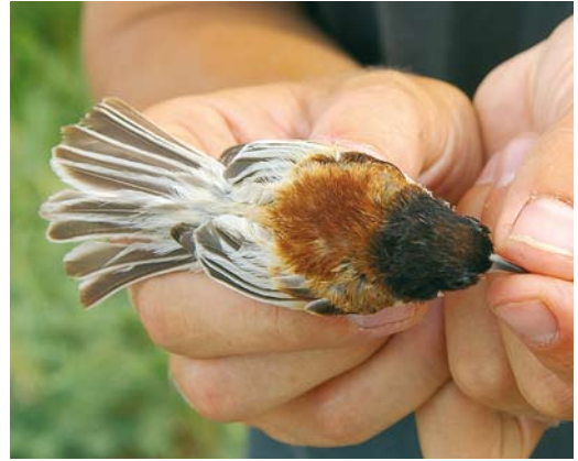
200 Black-headed Penduline Tit / Zwartkopbuidelmees Remiz macronyx ssaposhnikowi , male, Topar lakes, Almaty province, Kazakhstan, 25 June 2008 ( René van Dijk ). Same individual as in plate 201. Note black crown-feathers interspersed with some chestnut feathers and broad white fringes of tail- and flight-feathers.