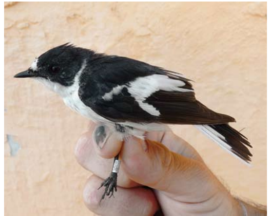
249 Masked Wagtail / Maskerkwikstaart Motacilla personata , Jahra pool reserve, Kuwait, 1 March 2011 ( Khaled Al-Ghanem ) cf Dutch Birding 33: 143, 2011 250 Mongolian Finch / Mongoolse Woestijnvink Rhodopechys mongolicus , Sabah Al-Ahmad Reserve, Kuwait, 8 April 2011 ( Khaled Al-Ghanem ) 251 Eastern Black Redstart / Oosterse Zwarte Roodstaart Phoenicurus ochruros phoenicuroides , second calendar-year male, Isla Grosa, Murcia, Spain, 23 March 2011 ( José Antonio Barba ) 252 Semicollared Flycatcher / Balkanvliegenvanger Ficedula semitorquata , adult male, Cabrera, Balearic Islands, Spain, 17 April 2011 ( Eduardo do Amengual Ramis )

tee, the numbers appear to be higher than previously thought; for instance, between 31 March and 18 April eight were found in a short section of tamarisks along the Mansour lake near Ouarzazate. A Blyth's Reed Warbler Acrocephalus dumetorum trapped at Eemshaven, Groningen, on 6 May was by far the earliest for the Netherlands; previous records were in September-October (eight) and late June (three). A male Moustached Warbler A melanopogon , presumably an Eastern Moustached Warbler A m mimica , was singing at Lehrte, Niedersachsen, Germany, on 3-4 April.