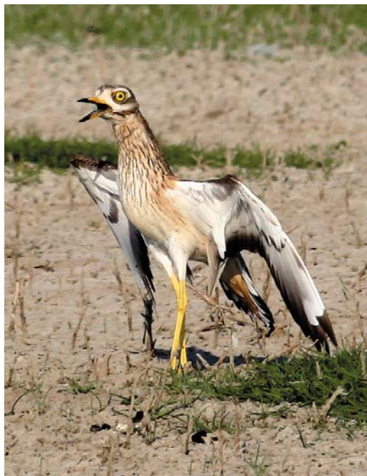
253 Ross' Meeuw / Ross's Gull Rhodostethia rosea , adult winter, Oosterse Bekade Gorzen, Numansdorp, Zuid-Holland, 24 april 2011 ( Kris De Rouck ) 254 Griel / Eurasian Stone-curlew Burhinus oedicnemus , Oudeland van Strijen, Zuid-Holland, 25 april 2011 ( Lodewijk Ouwens ) 255 Ross' Meeuw / Ross's Gull Rhodostethia rosea , adult winter, Oosterse Bekade Gorzen, Numansdorp, Zuid-Holland, 24 april 2011 ( Filip De Ruwe )