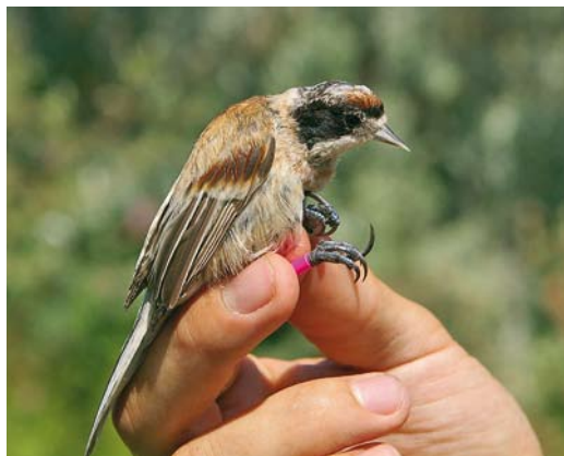
202 Black-headed Penduline Tit / Zwartkopbuidelmee Remiz macronyx ssaposhnikowi , female, Topar lakes, Almaty province, Kazakhstan, 26 June 2008

and flanks. Males with a caspicus -like appearance seem to be indistinguishable from true caspicus : comparing these males with the few photographs available on the internet (eg, www.birds-online.ru/gallery/thumbnails.php?album=104 ) and descriptions in the literature of caspicus (Harrap & Quinn 1996, Madge 2008), no consistent differences in plumage could be found. All observed females resembled nominate pendulinus of Eurasian but differed from these in having a clear red fringe on the head above the forehead patch extending to the side of the crown and in having