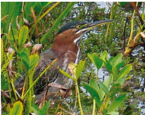
188 Groene Reiger / Green Heron Butorides virescens , Amsterdam, Noord-Holland, 14 september 2006

stand van het aan de overkant van het water gelegen Marignane, het internationale vliegveld van Marseille, Bouches-du-Rhône, en hemelsbreed 30 km ten oosten van de Camargue. De precieze data zijn van 16 december 2006 tot en met 2 mei 2007 (een melding op 5 november is niet aanvaard), van 31 oktober 2007 tot en met 4 mei 2008 en van 8 november 2008 tot en met 6 mei 2009 (cf Dutch Birding 28: 325, 2006, 29: 45, 255-256, 2007, 30: 124, 2008, 31: 125, 190, 2009, Reeber & Comité d'homologation national 2009). In de winters van 2009/10 en 2010/11 werd hij niet meer gezien. Hij viste hier meestal aan een waterzuiveringskanaaltje bij een bruggetje van de weg van Berre richting de zoutpannen van de lagune en was ook geregeld in de nabijgelegen jachthaven te vinden.