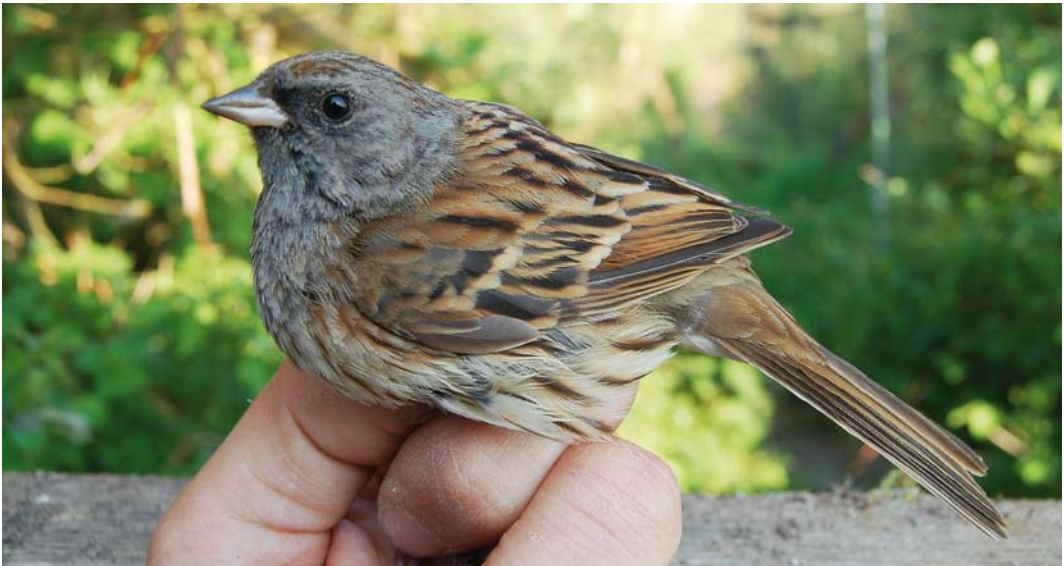
270 Maskergors / Black-faced Bunting Emberiza spodocephala , adult mannetje, Zwanenwater, Noord-Holland, 7 mei 2011 (Peter Spannenburg)

BLACK-FACED BUNTING On 7 and 9 May 2011, an adult male Black-faced Bunting Emberiza spodocephala was trapped at a site closed for the public at Zwanenwater, Noord-Holland, the Netherlands. If accepted, this is the fourth record for the Netherlands and the first in spring. The previous ones were trapped between 28 October and 18 November in 1986, 1993 and 2007.