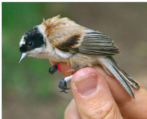
203 White-crowned Penduline Tit / Witkruinbuidelmee Remiz coronatus coronatus , male, Dzhabagly, South Kazakhstan, Kazakhstan, 1 June 2008 (Sander Bot). Typical individual. 204 White-crowned Penduline Tit / Witkruinbuidelmee Remiz coronatus coronatus , female, Topar lakes, Almaty province, Kazakhstan, 13 June 2008 (Sander Bot). Note paler appearance with greyer crown-feathers and paler mantle compared with males of same species in plate 203 and 205.

In both studied subspecies, females differed from males in the same way as in Eurasian Penduline Tit: females have a smaller and less well defined mask, are duller and have less bright chestnut on the back than males. We studied nominate coronatus in the foothills of the western Tien Shan mountain range in southern Kazakhstan (42°25'N, 70°29'E). Males resemble Eurasian in plumage but the black of their mask is generally larger and extends onto the nape. This character is variable: in some males the black of the mask extends only marginally onto the nape, while in others the nape is completely black, leaving only the crown white. Compared with Eurasian, males also lack the red-brown fringe bordering the mask above the bill. Identifying female coronatus from Eurasian might be more difficult. They show a variable amount of black on the nape but to a lesser extent and more diffuse compared with males, while some females lack the dark markings on the nape altogether. These females might still be identified by the col-