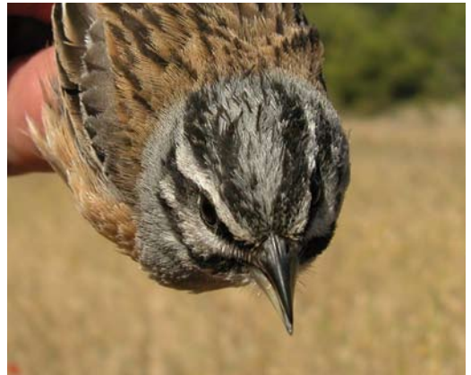
215-216 Grijze Gors / Rock Bunting Emberiza cia , adult mannetje, Pina de Ebro, Zaragoza, Spanje, 18 juni 2009 (Javier Blasco-Zumeta) 217-218 Grijze Gors / Rock Bunting Emberiza cia , tweede-kalenderjaar mannetje, Pina de Ebro, Zaragoza, Spanje, 12 juni 2009 (Javier Blasco-Zumeta)

soort een veel minder markante koptekening heeft. Zowel Huisgors als Gestreepte missen daarnaast de sterk donker gestreepte warmbruine bovendelen. Verder ontbreken bij Gestreepte de oranjebruine, egaal gekleurde onderdelen begrensd door de grijze borst. Huisgors heeft wel egaal gekleurde onderdelen, zelfs met scherp begrensd grijze borst maar de borst is gestreept (Byers et al 1995, Svensson et al 2010). Van Huisgors is in Nederland een waarneming van een ontsnapte vogel bekend, in Wieringerwerf, Noord-Holland, in oktober 2008. Voor het uitsluiten van (andere) ontsnapte gorzen wordt verwezen naar Cazemier (2006). Met name Weidegors E. coides (Oost-Azië), Rotsgors E. godlewskii (Oost-Azië), Socotragors E. socotrana (endeem van Socotra, Jemen), Zevenstrengengors E. tahapisi (tropisch Afrika en Arabisch Schiereiland), Stewarts