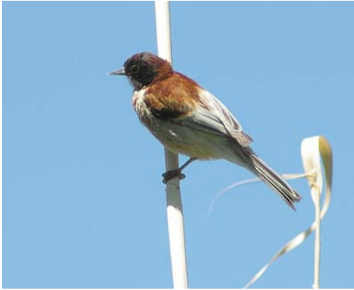
199 Black-headed Penduline Tit / Zwartkopbuidelmees Remiz macronyx ssaposhnikowi , male, Topar lakes, Almaty province, Kazakhstan, 18 June 2008. This individual looks identical to Eurasian Penduline Tit R. pendulinus caspius . Note chestnut crown and nape, white throat and broad white fringes of tail- and flight-feathers.