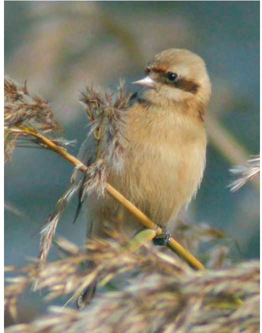
211 Chinese Penduline Tit / Chinese Buidelmeees Remiz consobrinus , female, Beidaihe, Hebei, China, 13 October 2003 (Mike Parker). Mask is less conspicuous in females.

Eurasian Penduline Tits. This suggests that this subspecies is also polygamous, although clearly more observations are required in order to establish the species' breeding system.