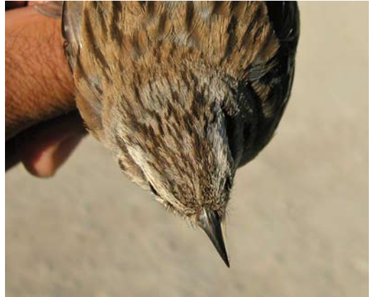
219-220 Grijze Gors / Rock Bunting Emberiza cia , adult vrouwtje, Pina de Ebro, Zaragoza, Spanje, 18 juni 2009 (Javier Blasco-Zumeta) 221-222 Grijze Gors / Rock Bunting Emberiza cia , tweede-kalenderjaar vrouwtje, Pina de Ebro, Zaragoza, Spanje, 27 juni 2009 (Javier Blasco-Zumeta)