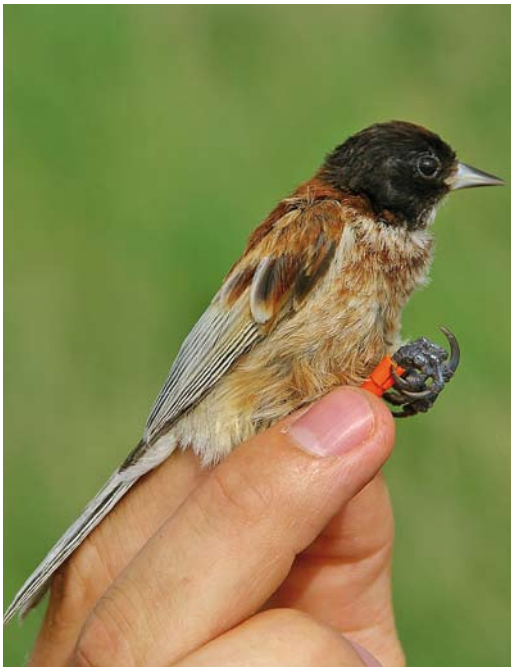
201 Black-headed Penduline Tit / Zwartkopbuidelmees Remiz macronyx ssaposhnikowi , male, Topar lakes, Almaty province, Kazakhstan, 25 June 2008 ( René van Dijk ). Same individual as in plate 200. Intermediate bird. Note extensive red-brown markings on breast and white throat.

feather-tips and a paler throat. Both sexes possibly show substantial variation in head pattern but from available literature it is not possible to get a clear picture of the morphological variation. Hence it is unclear whether macronyx can always be safely distinguished from hybrids caspius x macronyx in the Caspian Sea region. The fact that menzbieri Eurasian Penduline Tit hybridises with neglectus Black-headed along the south-western coast adds to the complexity around the Caspian Sea. Unfortunately, little is known about the Caspian Sea situation and further research is required to acquire more information about morphology and hybridisation of the (sub)species in this region.