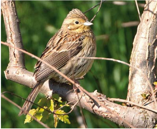
269 Cirlgors / Cirl Bunting Emberiza cirlus , vrouwtje, Westkapelle, Zeeland, 4 mei 2011 (Co van der Wardt)