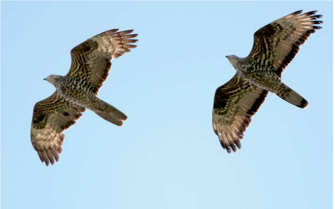
167 European Honey Buzzard / Wespëndief Pernis apivorus , adult female (left) and adult male, Falsterbo, Skåne, Sweden, 28 August 2007. Both birds show carpal patches and only five primaries are clearly fingered. Male has obviously different tail pattern compared with male Crested Honey Buzzard P ptilorhyncus , being largely pale. Yellow iris of male is visible. 168 Crested Honey Buzzard / Aziatische Wespëndief Pernis ptilorhyncus , adult female, Chokpak pass, Kazakhstan, 22 September 2003. Pattern on remiges and especially primaries indicate female. In dark-morph bird like this, carpal patch all dark along with rest of underwing-coverts, making this feature useless. Large and bulky appearance, with broad wings and six fingered primaries are good for ptilorhyncus . Secondary pattern is more typical than in bird in plate 163: more barring is visible and it runs all the way to body without disappearing under wing-coverts. Tail barring more obvious than would be expected for female European Honey Buzzard P apivorus , being more reminiscent of tail pattern of male apivorus .