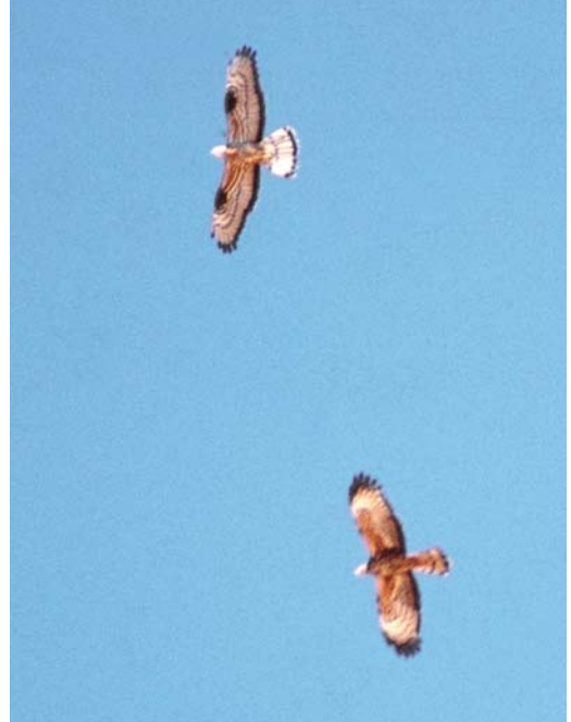
175 Crested Honey Buzzard / Aziatische Wespindief Pernis ptilorhyncus , female, pale morph (below), with European Honey Buzzard / Wespindief P.apivorus , Eilat, Israel, mid-May 2001 ( Barak Granit ). Note broader wings of ptilorhyncus than apivorus , with six fingered primaries and dark gorget. Extensive dark outer primaries may indicate second calendar-year plumage.

Orientalis records are considered by the Oman Bird Records Committee; this record was submitted as a hybrid between orientalis and apivorus . If accepted as such, it would be the first for Oman.