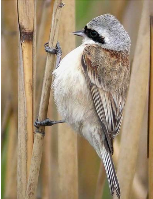
210 Chinese Penduline Tit / Chinese Buidelmeees Remiz consobrinus , male, Beidaihe, Hebei, China, 6 May 2005. Note diagnostic narrow 'bandit mask'.