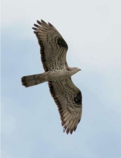
174 European Honey Buzzard / Wespindief Pernis apivorus , adult male, Kasmala, Altay kraj, southern Siberia, Russia, 24 June 2009. Pale-morph bird showing typical slim appearance and five fingered primaries, as well as clear and contrasting carpal patch. Tail pattern and yellow iris also typical for male apivorus . Photograph taken at far eastern edge of breeding range of apivorus , very close to supposed overlap zone with Crested Honey Buzzard P.ptilorhyncus .