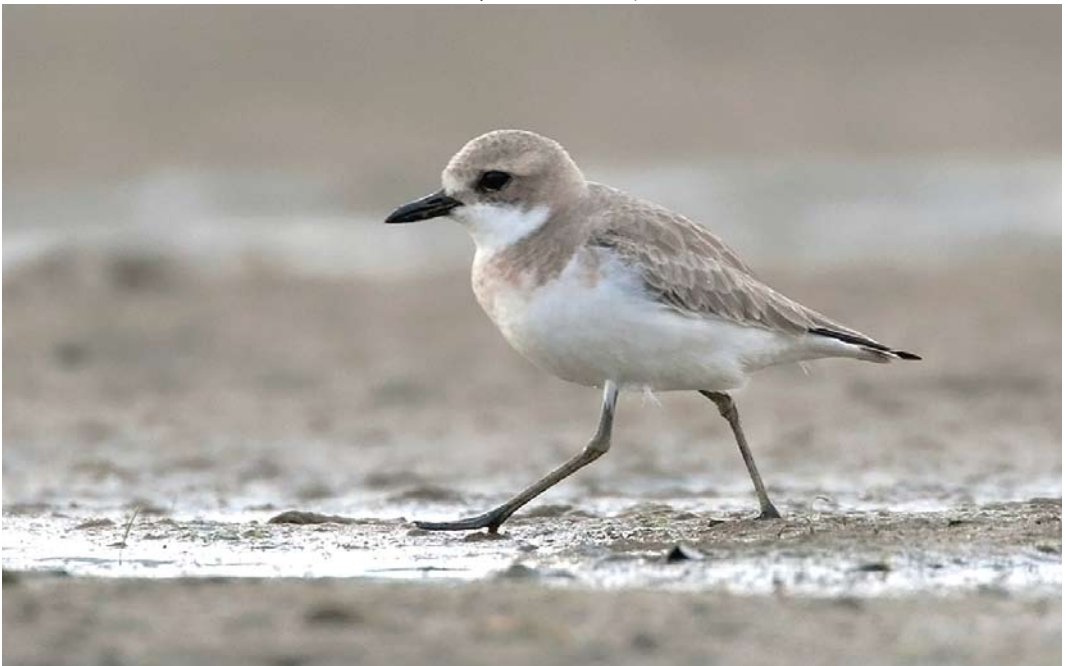
257 Woestijnplevier / Greater Sand Plover Charadrius leschenaultii , adult vrouwtje, Liendense Waard, Batenburg, Gelderland, 28 april 2011 (Harvey van Diek)