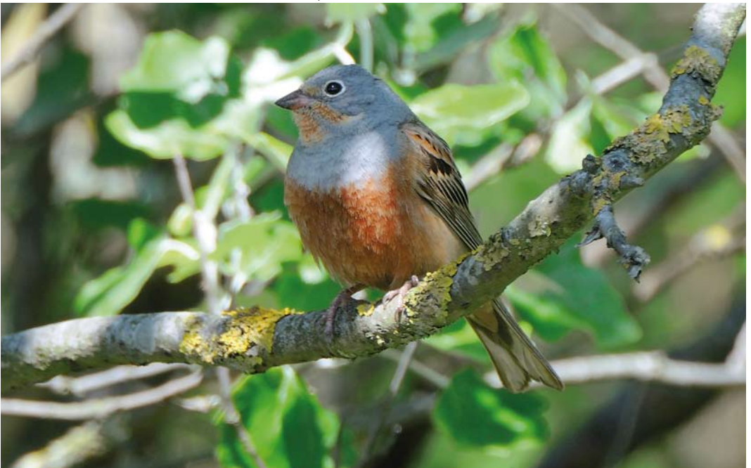
248 Cretzschmar's Bunting / Bruinkeelortolaan Emberiza caesia , male, Rottumerplaat, Groningen, Netherlands, 13 May 2011