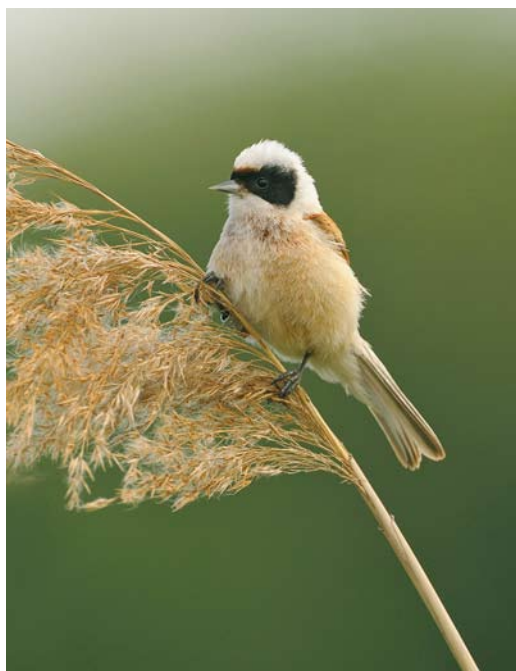
196 Eurasian Penduline Tit / Buidelmees Remiz pendulinus pendulinus , male, Gelderland, Netherlands, 14 May 2008. Typical individual.