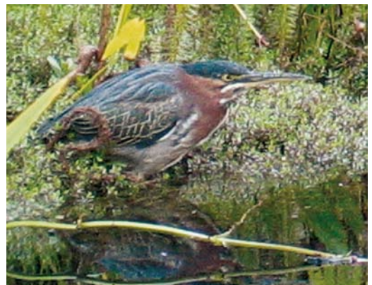
189 Groene Reiger / Green Heron Butorides virescens , Amsterdam, Noord-Holland, 19 september 2006 (Effendi Haidar)

BOVENDELEN Mantel vlekkerig bruingrijs met groenige tint. Schouderveren blauwgrijs met smalle witte schacht-