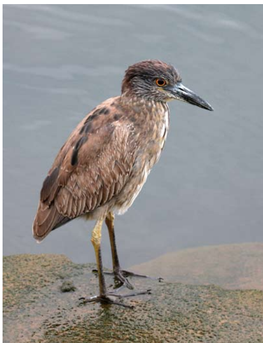
231 Yellow-crowned Night Heron / Geelkruinkwak Nyctanassa violacea , first-year, Funchal, Madeira, 27 March 2011