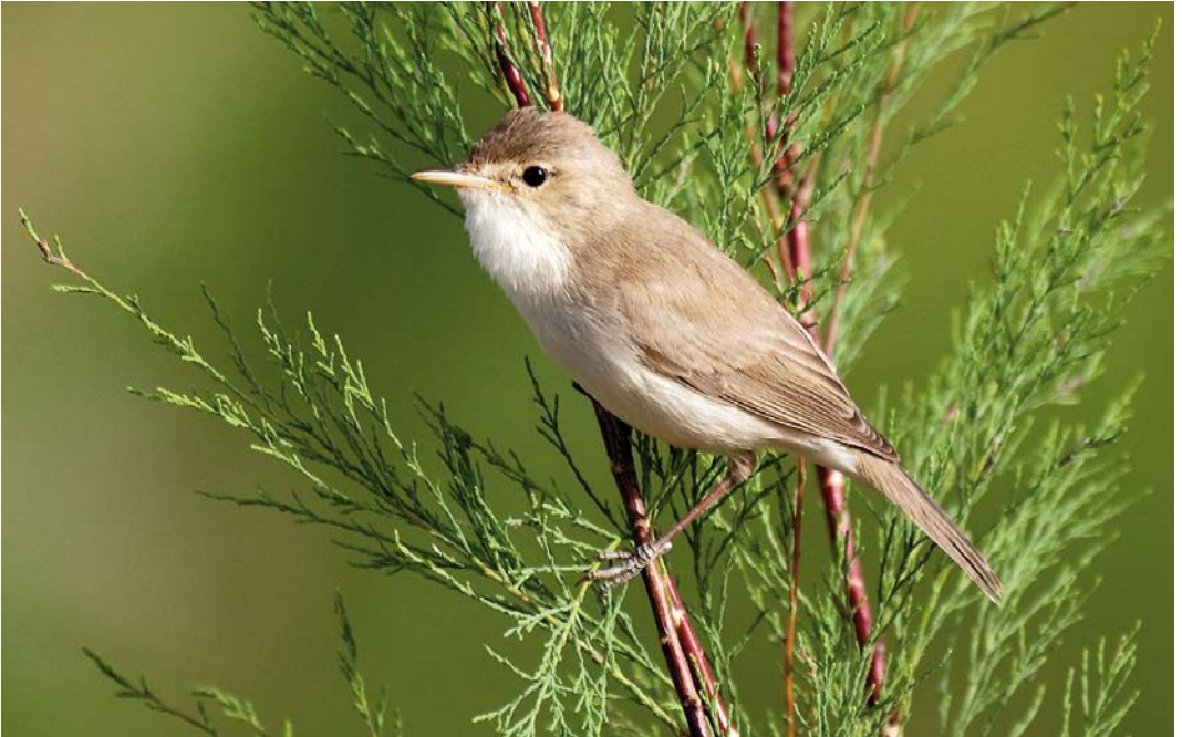
247 Saharan Olivaceous Warbler / Saharaanse Vale Spotvogel Iduna pallida reiseri , Ouarzazate, Morocco, 18 April 2011