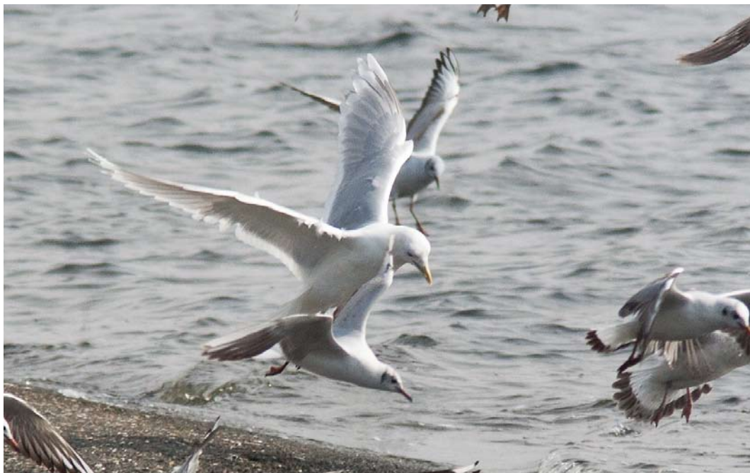
225-226 Kumliens Meeuw / Kumlien's Gull Larus glaucooides kumlieni , adult, met Kokmeeuwen / Black-headed Gulls Chroicocephalus ridibundus , De Gijster, Brabantse Biesbosch, Noord-Brabant, 3 april 2011