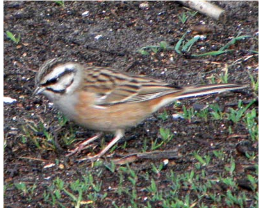
213-214 Grijze Gors / Rock Bunting Emberiza cia , Schiermonnikoog-Dorp, Schiermonnikoog, Friesland, 3 april 2011

resse. De tweede groep heb ik om een vogelboek gevraagd. Een korte blik in het boek en vervolgens op het scherm van mijn camera bevestigde dat het inderdaad om een Grijze Gors ging.