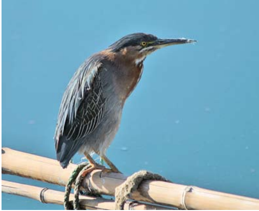
191 Groene Reiger / Green Heron Butorides virescens , Berre l'Étang, Bouches-du-Rhône, Frankrijk, 3 november 2007

Witte lijn onder teugel en snavelbasis. Kin en keel wit en gestreept.