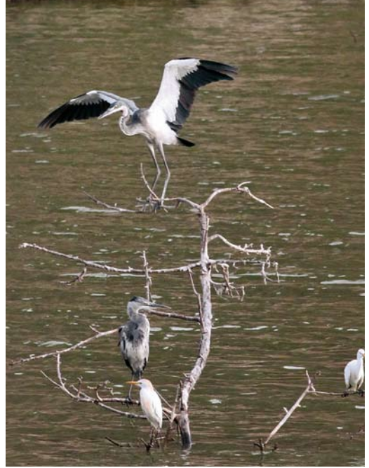
233 Intermediate Egret / Middelste Zilverreiger Mesophoyx intermedia , Barragem de Poilão, Santiago, Cape Verde Islands, 30 April 2011 ( Richard Bonser ) 234 Black-headed Heron / Zwartkopreiger Ardea melanocephala , Barragem de Poilão, Santiago, Cape Verde Islands, 30 April 2011 ( Richard Bonser ) 235 Thayer's Gull / Thayers Meeuw Larus thayeri , fifth-calendar year, San Cibrao, Cervo, Galicia, Spain, 13 March 2011 ( David Calleja ) cf Dutch Birding 33: 142, 2011