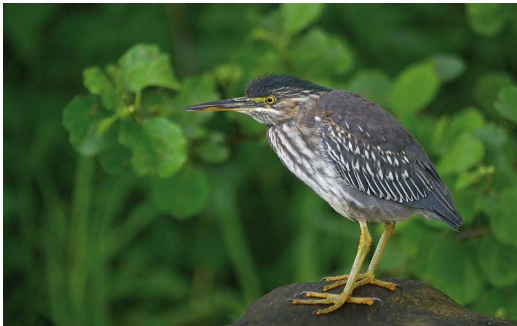
186 Groene Reiger / Green Heron Butorides virescens , eerstejaars, Amsterdam, Noord-Holland, 6 mei 2006 (Menno Hornman)

de vogel nog steeds aanwezig was en dat hij nu meende dat het een Kwak betrof. Later die dag zagen ook PM en Ronald van Dijk de vogel waarbij door omstandigheden hen het kleine formaat niet opviel; ze hielden het op een Kwak. Op 27 april konden in de ochtend Theo van Lent en 's avonds RvD foto's maken en nu viel het kleine formaat wel op. Zowel RvD als PM kregen daardoor twijfels over de determinatie. Ze keken nog wel naar een afbeelding van Mangrove-reiger B striata in de ANWB-gids (Svensson et al 2000) maar dat bracht hen niet verder en omdat PM de volgende dag op vakantie ging, lieten ze het erbij zitten. Toen de foto's op internet beschikbaar kwamen raakte Laurens Steijn gealarmeerd en kwam hij als eerste tot de conclusie dat het vermoedelijk om een Groene Reiger ging. Vanaf 28 april kon de vogel door talloze vogelaars worden bekeken, meestal foeragerend in een zoetwatersloot langs het Jaagpad bij de oever van De Nieuwe Meer (Steijn 2006). Hij bleef hier tot en met 24 juni waarna hij op 14 september 2006 in grotendeels adult kleed werd teruggevonden aan de noordrand van Amsterdam. De vogel zou in twee van de drie volgende zomers in Amsterdam of Zaandam, Noord-Holland, terugkeren. Het was een verbazend toeval dat op 16 december 2006 een exemplaar bleek