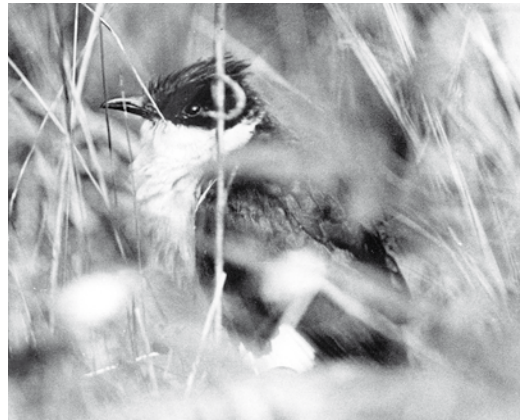
413-416 Jacobin Cuckoo / Jacobijnkoekoek Clamator jacobinus , Lehtimäki, Finland, 11 September 1976

Seychelles, in March and November-January (Skerrett et al 2006), highlighting the capacity of this species for non-stop over-water flights. In the Himalayas, vagrants have reached altitudes higher than 2600 m (Rasmussen & Anderton 2005). To the east, vagrants have occurred in Cambodia (Poole & Evans 2004) and Thailand, where there have been 15 records involving 19 individuals and the species may even be in the process of colonising the country (Phil Round in litt). More impressively, vagrants have reached the Ryukyu Islands, Japan, where one was videoed on Iriomote-shima on 1 June 1997 (Kamata 1997), and the Philippines, where one was recorded at Visita, Dalupiri, on 21 May 2004 (Allen et al 2006).