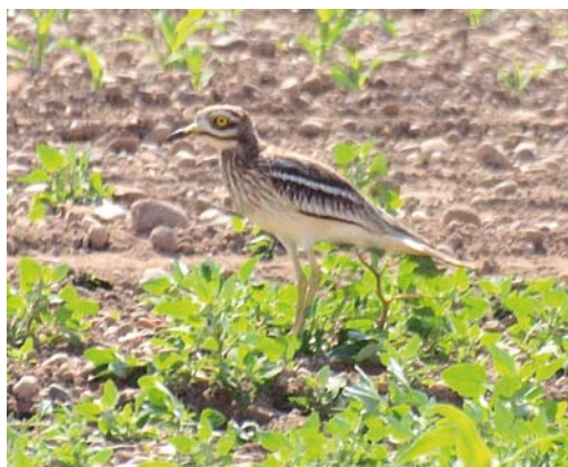
436 Siberian Accentor / Bergheggenmus Prunella montanella , Utsira, Rogaland, Norway, 6 August 2011 437 Eleonora's Falcon / Eleonora's Valk Falco eleonorae , second calendar-year, Oostvaardersplassen, Flevoland, Netherlands, 17 September 2011 438 Sharp-tailed Sandpiper / Siberische Strandloper Calidris acuminata , Reckahner Teiche, Brandenburg, Germany, 11 September 2011 439 Eurasian Stone-curlew / Griel Burhinus oedicanus , southern Germany, 14 May 2011 cf Dutch Birding 33: 263, 2011

ing one and two fledglings; since the populations in southern Belarus and northern Ukraine seem to be on the increase, both in numbers and range, it is expected that the species will colonize eastern Poland in the future ( Ornis Polonica 52: 150-154, 2011). The fourth Alpine Swift Apus melba for Iceland turned up on Heimaey on 6 August. A Red-eyed Vireo Vireo olivaceus on St Mary's, Scilly, from 13 September was this autumn's first Nearctic passerine at Ottenby, Öland, from 11 July until 17 August. A Great Grey Shrike L. excubitor showing features of the subspecies homeyeri at Fochtelöerveen, Drenthe/Friesland, from 7 August to at least 15 September attracted many birders; apparently