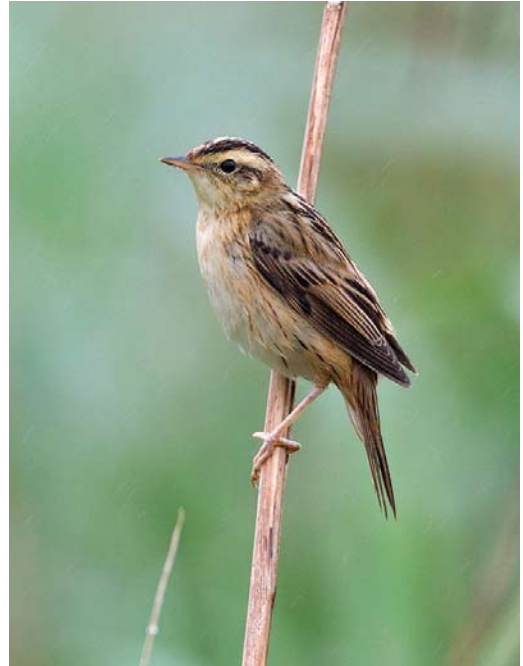
464 Scharrelaar / European Roller Coracias garrulus , Zuidland, Zuid-Holland, 10 juli 2011 ( Alex Bos ) 465 Waterrietzanger / Aquatic Warbler Acrocephalus paludicola , Groene Jonker, Zevenhoven, Zuid-Holland, 13 augustus 2011 ( Harvey van Diek ) 466 Citroenkwikstaart / Citrine Wagtail Motacilla citreola , eerste-zomer mannetje, Zeewolde, Flevoland, 16 juli 2011 ( Arnoud B van den Berg )