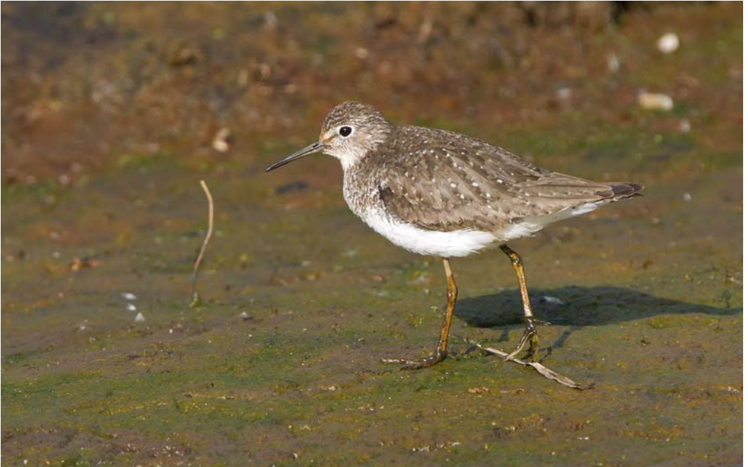
428 Solitary Sandpiper / Amerikaanse Bosruiter Tringa solitaria , Húsavík, Iceland, 27 July 2011