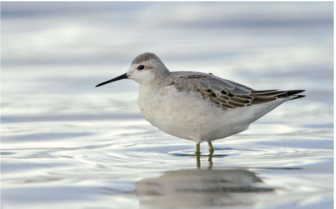
429 Wilson's Phalarope / Grote Franjepoot Phalaropus tricolor , Bakkatjörn, Seltjarnarnes, Iceland, 5 September 2011