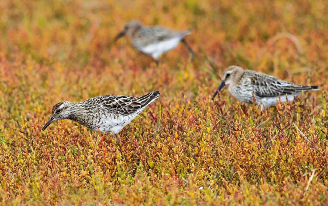
430 Sharp-tailed Sandpiper / Siberische Strandloper Calidris acuminata , adult summer, with Dunlins / Bonte Strandlopers C alpina , Tacumshin, Wexford, Ireland, 30 August 2011