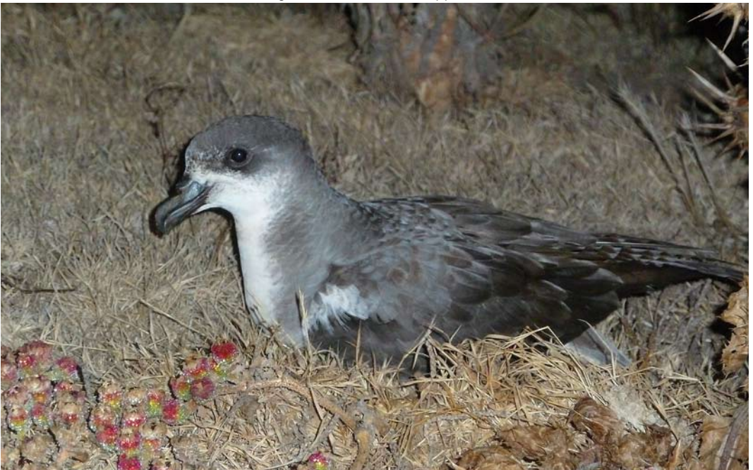
419 Desertas Petrel / Desertastormvogel Pterodroma deserta , Bugío, Desertas, Madeira, 8 July 2011