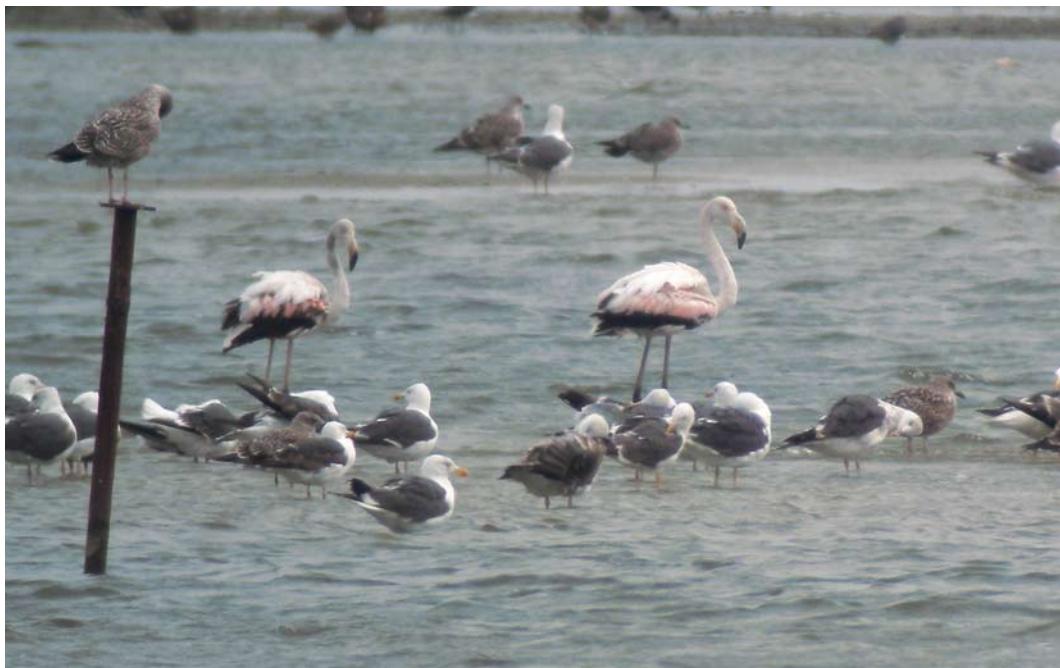
448 Flamingo's / Greater Flamingos Phoenicopterus roseus , onvolwassen, Kinselbaai, Waterland, Noord-Holland, 21 augustus 2011 (Ruud G M Altenburg)