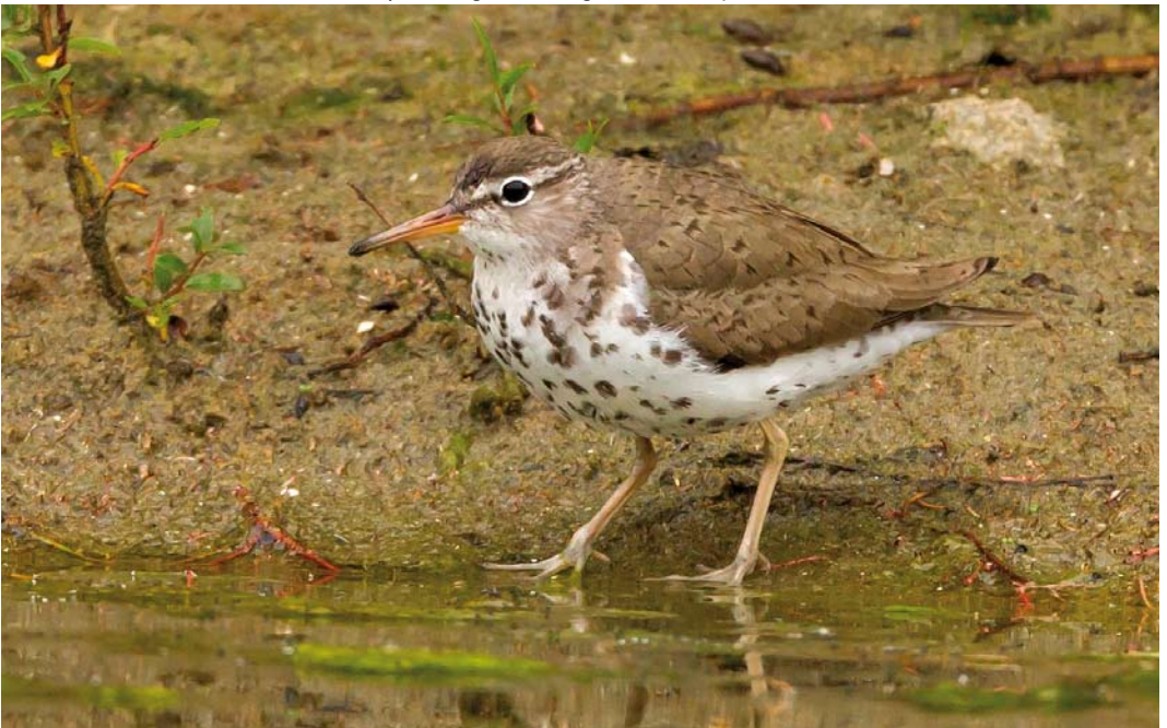
431 Spotted Sandpiper / Amerikaanse Oeverloper Actitis macularius , adult summer, Het Rot, Antwerpen, Antwerpen, Belgium, 4 August 2011