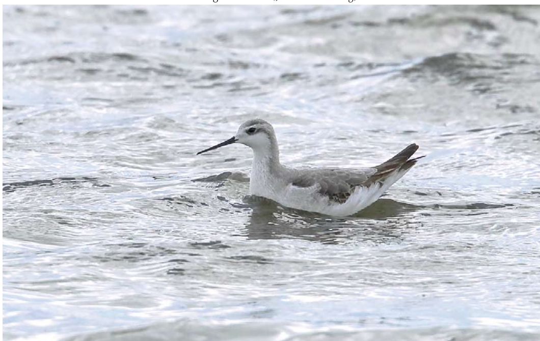
449 Grote Franjepoot / Wilson's Phalarope Phalaropus tricolor , eerstejaars, Wagejot, Texel, Noord-Holland, 28 augustus 2011