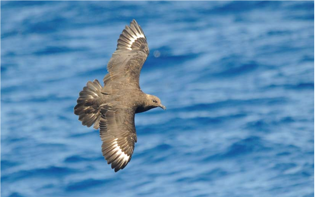
418 South Polar Skua / Zuidpooljager Stercorarius maccormicki , off Lanzarote, Canary Islands, 10 September 2011