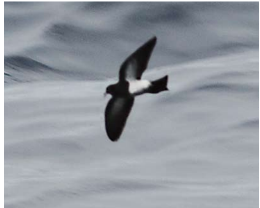
432 Sandhill Crane / Canadese Kraanvogel Grus canadensis (right), with Common Crane / Kraanvogel G. grus , Espoo, Laajalahti, Finland, 5 September 2011 ( Joonatan Toivanen ) 433 Little Bustard / Kleine Trap Tetrax tetrax , adult male, Otterlosche Zand, Hoge Veluwe, Gelderland, Netherlands, 3 September 2011 ( Jaap Denee ) 434 American Black Tern / Amerikaanse Zwarte Stern Chlidonias niger surinamensis , juvenile, Covenham Reservoir, Lincolnshire, England, 17 September 2011 ( Graham Catley ) 435 Black-bellied Storm Petrel / Zwartbuikstormvogeltje Fregetta tropica , off Madeira, 8 August 2011 ( Ricardo van Dijk )

Balgzand, Noord-Holland, was 32 (including three juveniles) on 8 August. In Gulf of Cagliari, Sardinia, 70-80 breeding pairs were counted. On 3 September, a juvenile American Black Tern Chlidonias niger surinamensis was reported at Brandon Point, Kerry. A juvenile at Covenham Reservoir, Lincolnshire, from 17 September was the first for eastern England. In southern Spain, a presumed adult Elegant Tern Sterna elegans was photographed at Doñana on 31 August. Like the Dutch taxonomic committee, the TSC of the BOURC recommends to recognize Cabot's Tern S. acullavida (with subspecies acullavida and eurygnatha ) as a separate species from Sandwich Tern S. sandvicensis (monotypic) (Ibis 153: 883-892, 2011); in the WP, Cabot's Tern has been recorded thanks to ringing recoveries from North Carolina, USA, in England (25 November 1984) and the Netherlands (23 December 1978; Dutch Birding 1: 60,