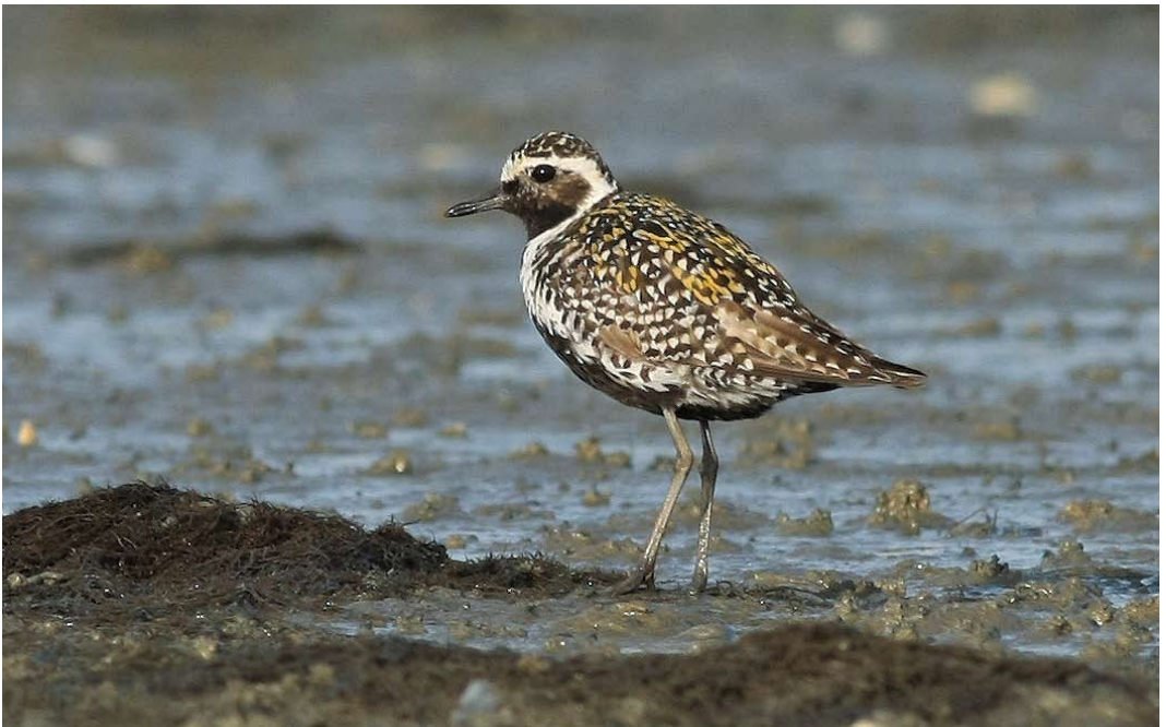
451 Aziatische Goudplevier / Pacific Golden Plover Pluvialis fulva , Colijnsplaat, Zeeland, 10 juli 2011