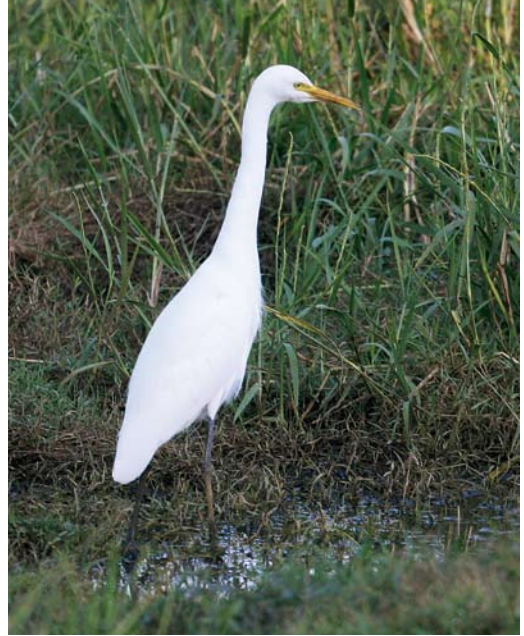
382 Western Cattle Egret / Koereiger Bubulcus ibis ibis , Route des Blicqs, Guernsey, Channel Islands, 9 February 2008. Alert posture resulting in fully outstretched neck. Legs and bill still appearing short, however. Note pale gull-grey legs; it was found that Eastern Cattle Egret B i coromandus does not show this coloration. 383 Eastern Cattle Egret / Oostelijke Koereiger Bubulcus ibis coromandus , Baga, Goa, India, 11 January 2009. Length of bill, neck and legs all reminiscent of genus Egretta .

neck and thick lower neck, whereas the neck in coromandus is more evenly slender. Ibis tends to show a more obvious jowl (shaggy or thick-looking feathering on the chin) than coromandus (plate 380), and the latter generally shows a less steep angle in the feathering on the chin. It was found that coromandus tends not to show a vertical slope in the forehead feathers, this being more likely to be shown by ibis , and more apparent in adult summer plumage. The extent of the jowl and position of the crest feathers varies in both subspecies, however, depending on levels of aggression and fear (Voisin 1991). Kushlan & Hancock (2005) state that coromandus shows more extensive feathering on the tibia. Rasmussen & Anderton (2005) state that ibis shows less bare facial skin than coromandus . Although both taxa can show black legs (contra Rasmussen & Anderton (2005) and Brazil (2009) who both state that only coromandus shows black legs), it was found that only ibis shows a pale 'gull grey' leg coloration in adult winter plumage (plate 382). However, a coromandus in transition between yellow/green and black legs could theoretically show this coloration. Voisin (1991) stated that the colour of the feet