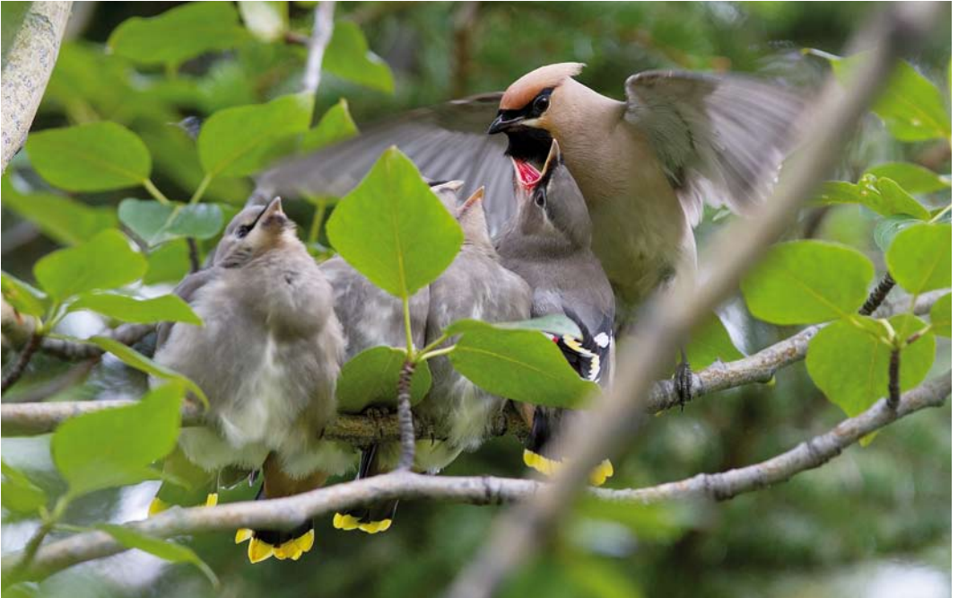
442 Bohemian Waxwings / Pestvogels Bombycilla garrulus , adult feeding young, Reykjahlíð, Mývatnssveit, Iceland, 29 July 2011 (Yann Kolbeinsson)