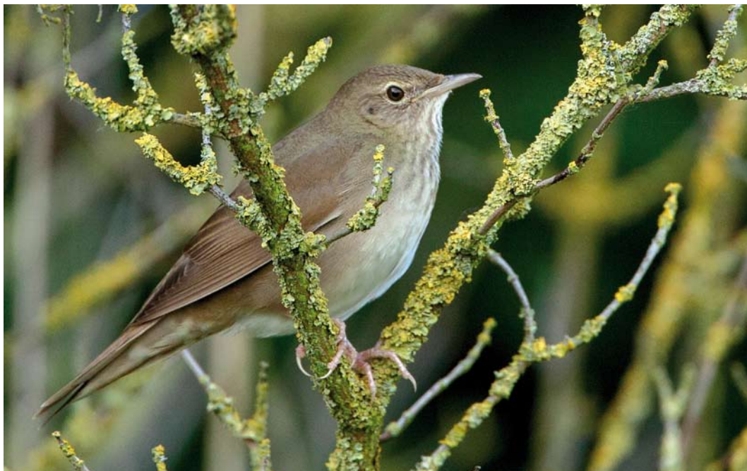
462 Krezelzanger / River Warbler Locustella fluviatilis , Beijumerbos, Groningen, Groningen, 2 juli 2011 (Co van der Wardt)