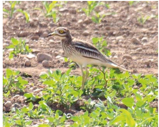
436 Siberian Accentor / Bergheggenmus Prunella montanella , Utsira, Rogaland, Norway, 6 August 2011 ( Eivind Sande ) 437 Eleonora's Falcon / Eleonora's Valk Falco eleonorae , second calendar-year, Oostvaardersplassen, Flevoland, Netherlands, 17 September 2011 ( Gilbert Rijmenans ) 438 Sharp-tailed Sandpiper / Siberische Strandloper Calidris acuminata , Reckahner Teiche, Brandenburg, Germany, 11 September 2011 ( Norbert Uhlhaas ) 439 Eurasian Stone-curlew / Griel Burhinus oedicnemus , southern Germany, 14 May 2011 ( Daniel Kratzer ) cf Dutch Birding 33: 263, 2011

ing one and two fledglings; since the populations in southern Belarus and northern Ukraine seem to be on the increase, both in numbers and range, it is expected that the species will colonize eastern Poland in the future (Ornis Polonica 52: 150-154, 2011). The fourth Alpine Swift Apus melba for Iceland turned up on Heimaey on 6 August. A Red-eyed Vireo Vireo olivaceus on St Mary's, Scilly, from 13 September was this autumn's first Nearctic passerine at Ottenby, Öland, from 11 July until 17 August. A Great Grey Shrike L. excubitor showing features of the subspecies homeyeri at Fochtelöerveen, Drenthe/Friesland, from 7 August to at least 15 September attracted many birders; apparently