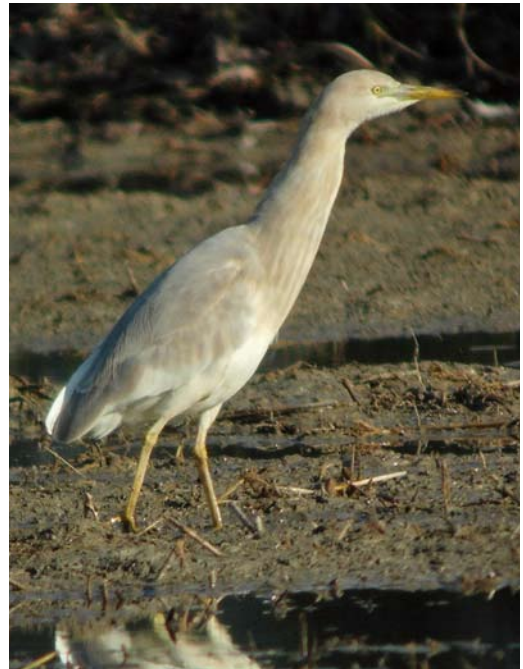
399-401 Hybrid Squacco Heron x Cattle Egret / hybride Ralreiger x Koereiger Ardeola ralloides x Bubulcus ibis , Ebro delta, Catalunya, Spain, 1 January 2011 (Ricard Gutiérrez) 402 Hybrid Squacco Heron x Cattle Egret / hybride Ralreiger x Koereiger Ardeola ralloides x Bubulcus ibis , Ebro delta, Catalunya, Spain, 2 January 2011 (Ricard Gutiérrez)

SIZE & STRUCTURE Rather like Cattle Egret but slightly smaller (direct comparison possible), probably with shorter legs; clearly smaller than Little Egret (in direct comparison) and always resting with retracted neck, in Squacco Heron-like fashion. Upper mandible straight, without any concave shape typical of Cattle Egret. In flight, showing rather hunchbacked look of Squacco Heron, with rather deep chest.