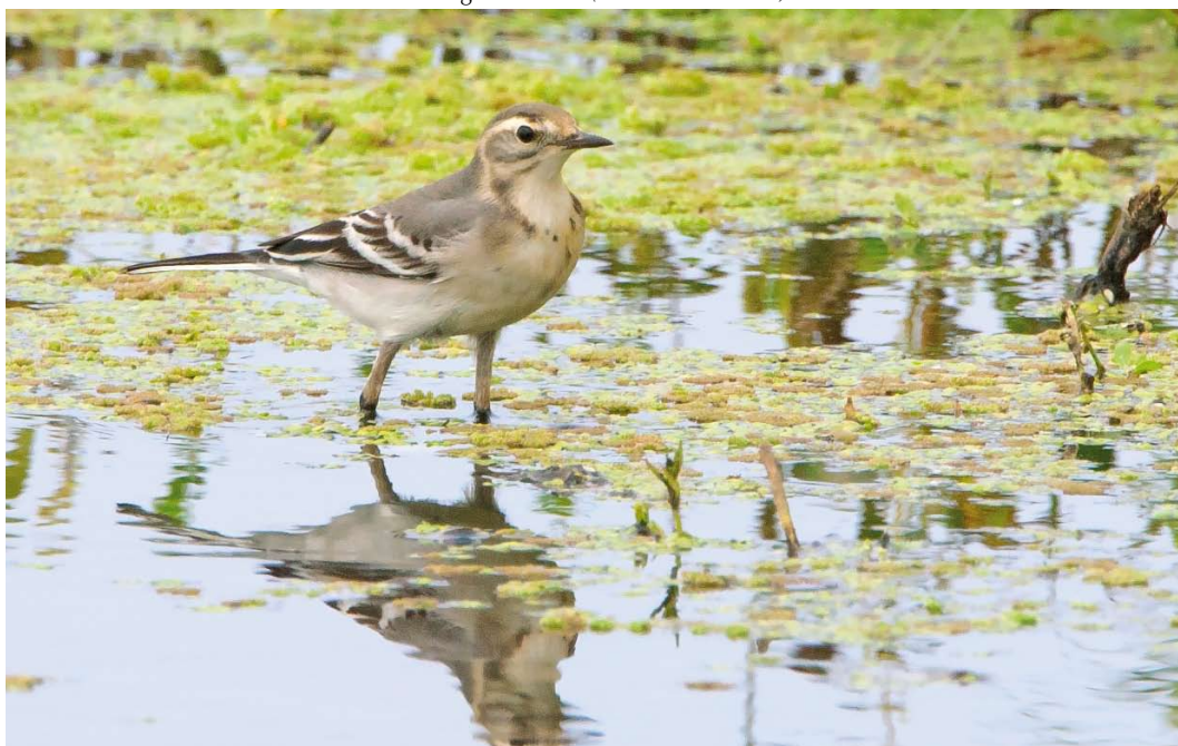
463 Citroenkwikstaart / Citrine Wagtail Motacilla citreola , eerstejaars, Belkmerweg, Petten, Noord-Holland, 25 augustus 2011 (Co van der Wardt)