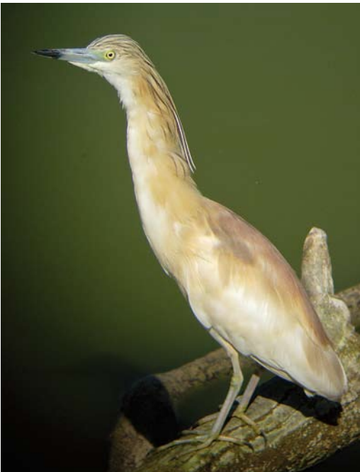
406 Squacco Heron / Ralreiger Ardeola ralloides , adult, Llobregat delta, Catalunya, Spain, 25 May 2006

head and mantle was not evident (or absent) in September and this agrees with a start of growth in autumn, growing through January-February, to be retained until replacement during the following post-breeding moult (Pyle & Howell 2004).