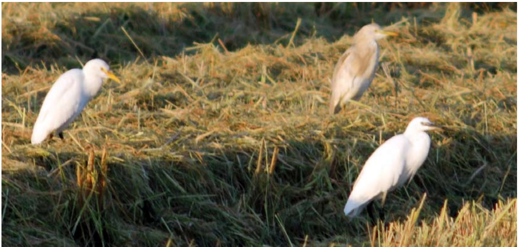
398 Hybrid Squacco Heron x Cattle Egret / hybride Ralreiger x Koereiger Ardeola ralloides x Bubulcus ibis (centre), with Cattle Egret / Koereiger (left) and Little Egret / Kleine Zilverreiger Egretta garzetta (front), Ebro delta, Catalunya, Spain, 18 September 2010 (Ricard Gutiérrez)

The description is based on notes taken on 18 September 2010 and 1 January 2011, as well as on photographs and videos from both dates.