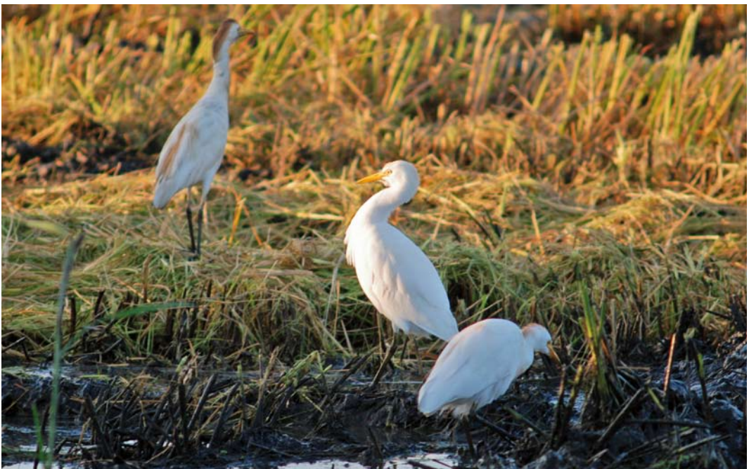
408 Cattle Egrets / Koereigers Bubulcus ibis , Ebro delta, Catalunya, Spain, 18 September 2010