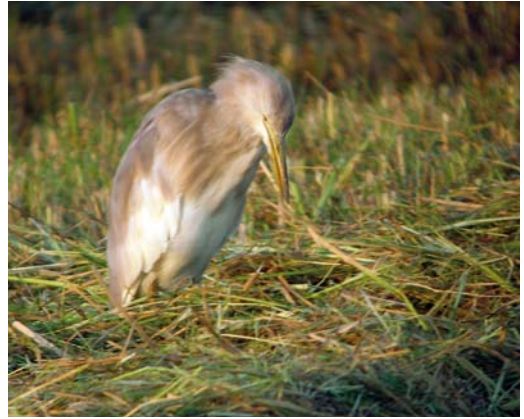
397 Hybrid Squacco Heron x Cattle Egret / hybride Ralreiger x Koereiger Ardeola ralloides x Bubulcus ibis , Ebro delta, Catalunya, Spain, 18 September 2010

Much to my surprise, however, a mid-afternoon's birding south of Platjola lagoon on 1 January 2011 together with Helena Arbonés,