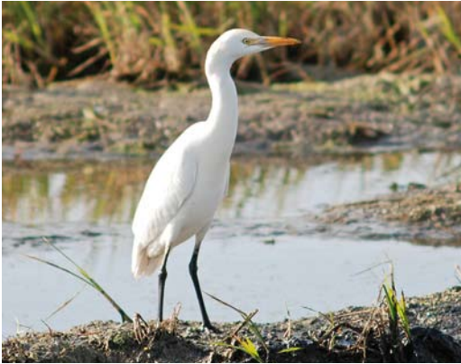
407 Cattle Egret / Koereiger Bubulcus ibis , Ebro delta, Catalunya, Spain, 8 December 2009 (Ricard Gutiérrez)

Dies et al 2001), one of which has frequented Ebro delta for 10 years in a row since it fledged there in 2002 (Dies et al 2010).