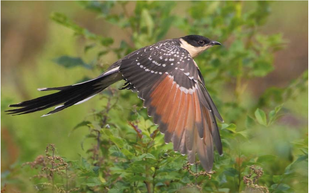
446 Kuifkoekoek / Great Spotted Cuckoo Clamator glandarius , juveniel, Zuiderdijkweg, Wieringerwerf, Noord-Holland, 6 augustus 2011 ( Hans Brinks )