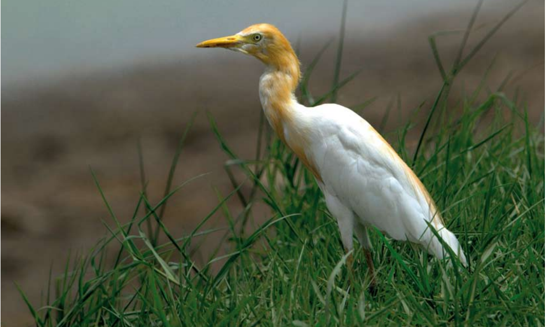
374 Eastern Cattle Egret / Oostelijke Koereiger Bubulcus ibis coromandus , Latkrabang, Bangkok, Thailand, 14 June 2009. Rusty colours of adult summer plumage on head and neck more patchy, and may briefly recall Western Cattle Egret B i ibis . 375 Eastern Cattle Egret / Oostelijke Koereiger Bubulcus ibis coromandus , Baga, Goa, India, 14 January 2009. Proportions of this bird comparable with genus Egretta . Dark bill-tip may persist through second calendar-year, although staining from mud may also account for this feature, as appears to be the case here. Note that adult winter plumage Intermediate Egret Mesophoyx intermedia also shows dark-tipped pale orange-yellow bill, a potential pitfall.