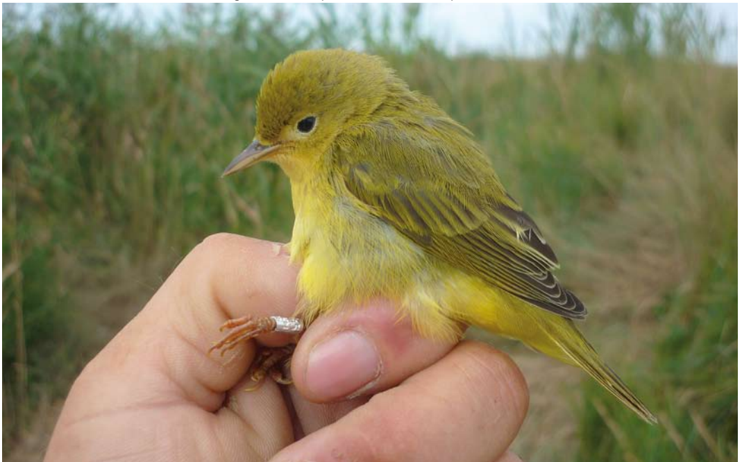
445 American Yellow Warbler / Gele Zanger Setophaga petechia , first-year, Gironde estuary, Charente-Maritime, France, 30 August 2011