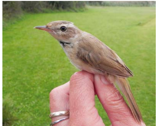
458 Groene Bijeneter / Blue-cheeked Bee-eater Merops persicus , Slikken van Flakkee, Zuid-Holland, 22 juli 2011 459 Vermoedelijke Homeyers Klapekster / presumed Homeyer's Great Grey Shrike Lanius excubitor homeyeri , adult, Fochteloërveen, Drenthe, 4 september 2011 460 Krekeltzanger / River Warbler Locustella fluviatilis , eerstejaars, Noordhollands Duinreservaat, Castricum, Noord-Holland, 21 augustus 2011 461 Veldrietzanger / Paddyfield Warbler Acrocephalus agricola , AW-Duinen, Zandvoort, Noord-Holland, 26 augustus 2011

Terschelling. Vanaf 9 augustus werden langs de kust 10 Vorkstaartmeeuwen Xema sabini opgemerkt, waaronder twee adulte die op 30 augustus samen langs Ameland vlogen. Een adulte Ross' Meeuw Rhodostetia rosea – wellicht dezelfde als in april bij Numansdorp, Zuid-Holland – werd gemeld op 30 juli bij Noordwijk, op 31 juli langs Noordwijk en de Langevelderslag en op 12 en 15 augustus langs Katwijk in Zuid-Holland. Het hoogste aantal Lachsterns Gelochelidon nilotica bedroeg 32 op 8 augustus op de traditionele slaappleaats op het Balgzand, Noord-Holland. Daaronder bevonden zich drie juveniele vogels. Langstreckende exemplaren werden gezien in Zuid-Holland op 19 juli vanaf de Vulkaan bij Den Haag en op 12 augustus langs Katwijk en Scheveningen. Concentraties van 10 tot 30 Reuzensterns Hydroprogne caspia werden waargenomen in de Workumerwaard, de Makkumerwaard en bij Paesens in