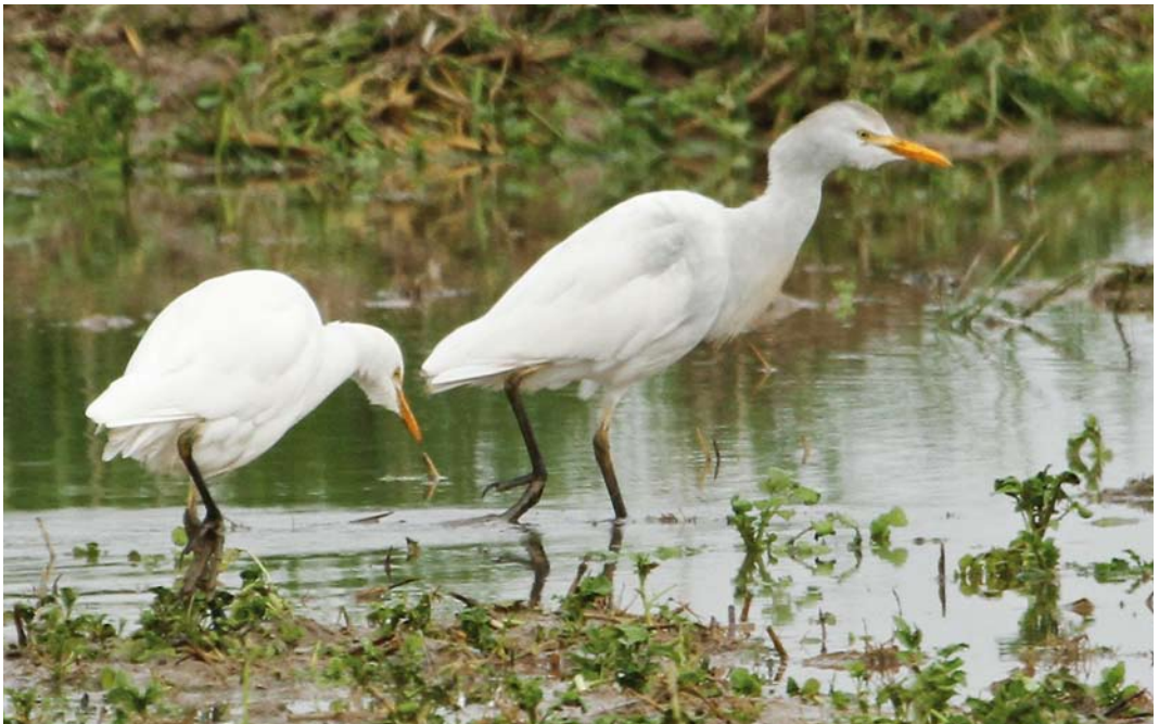
403 Cattle Egrets / Koereigers Bubulcus ibis , Albufera de Valencia, Valencia, Spain, 1 January 2011. Aberrantly coloured individual on right.

Adult winter Indian Pond Heron A grayii and Chinese Pond Heron A bacchus that might present