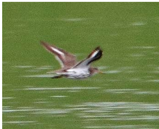
396 Amerikaanse Oeverloper / Spotted Sandpiper Actitis macularia , adult zomerkleed, Hogerwaardpolder, Zeeland, 31 juli 2011 (René van Rossum)

GROOTTE & BOUW Als Oeverloper maar wat kleiner met compacter lichaam en kortere staart. Staartprojectie geschat op c 5-10 mm.