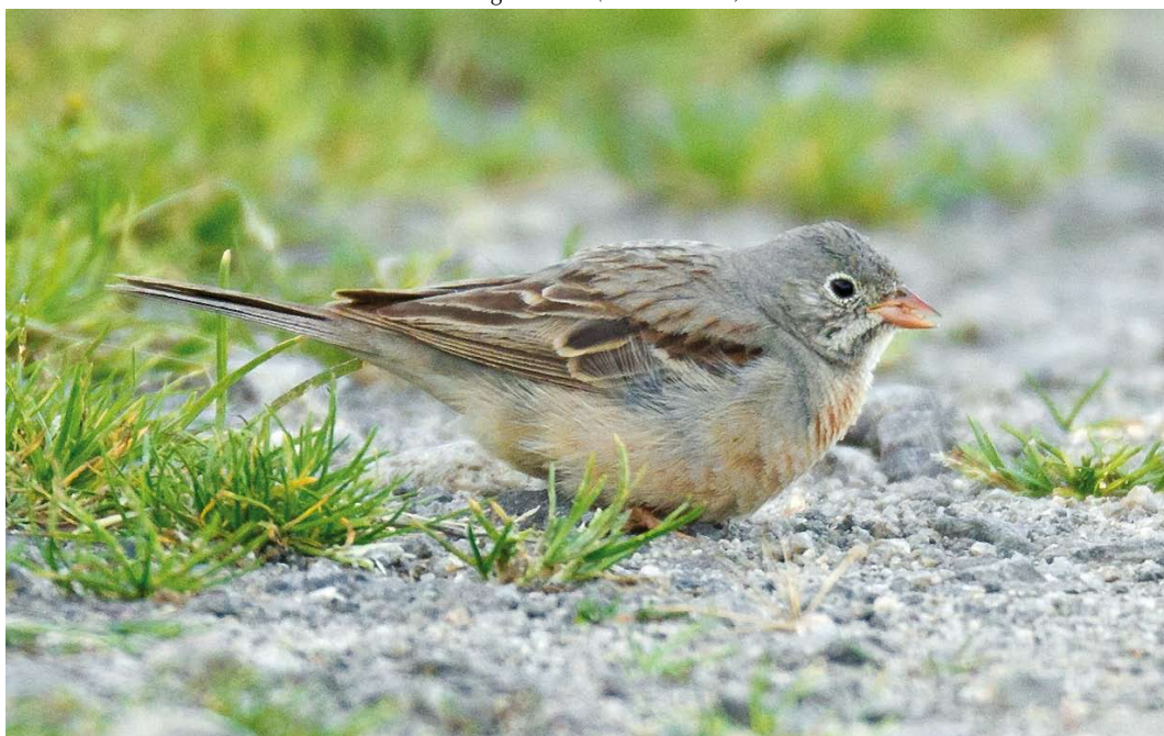
441 Grey-necked Bunting / Steenortolaan Emberiza buchanani , adult female, Lista, Farsund, Vest-Agder, Norway, 12 August 2011 ( Eivind Sande )