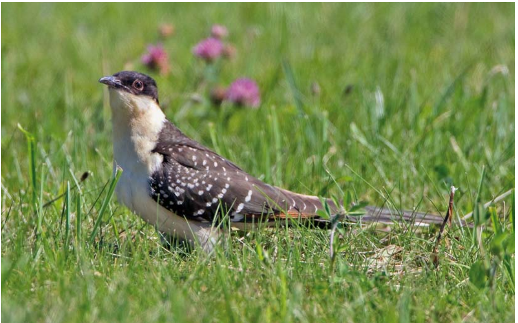
447 Kuifkoekoek / Great Spotted Cuckoo Clamator glandarius , juveniel, Den Oever, Noord-Holland, 20 juli 2011