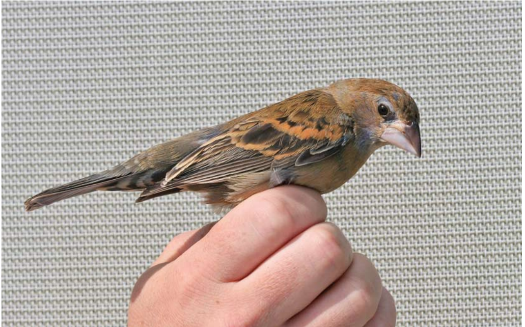
444 Blue Grosbeak / Blauwe Bisschop Passerina caerulea , female, Store Færder, Vestfold, Norway, 15 July 2011 (Stig Eid)