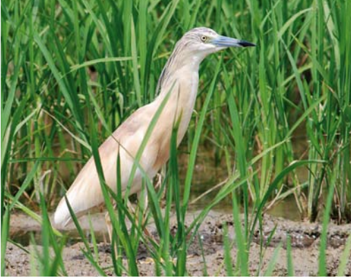
404 Squacco Heron / Ralreiger Ardeola ralloides , adult, Ebro delta, Catalunya, Spain, 8 July 2008 (Ricard Gutiérrez)