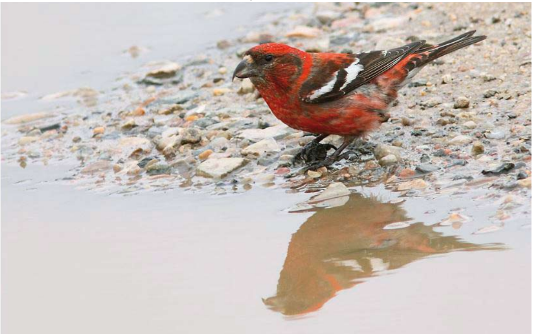
443 Two-barred Crossbill / Witbandkruisbek Loxia leucoptera bifasciata , male, Blåvands Huk, Sydvestjylland, Denmark, 24 July 2011