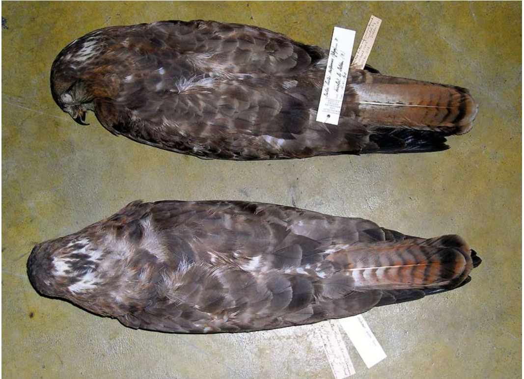
365-366 Steppebuizerds / Steppe Buzzards Buteo buteo vulpinus , adult mannetje (verzameld te Twickel, Overijssel, op 16 april 1902; boven), met adult vrouwtje (verzameld in Zuid-Rusland in maart 1908), Nederlands Centrum voor Biodiversiteit Naturalis, Leiden, Zuid-Holland, 15 maart 2006 ( Nils van Duivendijk ). Zie opvallende gelijkenis, hoewel patroon van onderdelen niet diagnostisch is voor vulpinus . Nederlands exemplaar heeft staartpatroon dat zelfs verder van nominaat buteo afligt dan exemplaar uit Zuid-Rusland. Staartpatronen samen benaderen grens van bandbreedte binnen 'rossige' vorm van vulpinus .

ter een gebandeerde staart en een patroon dat kan overlappen met nominaat buteo (gemiddeld vanaf banderingsverhouding 3:4), maar de hieronder genoemde kenmerken zijn indicatief voor vulpinus (in belangrijkheid aflopend). 1 Smalle donkere bandering (verhouding \leq 2:4 ) die ook nog versmalt of wegvalt naar basis; of bij adult smalle donkere bandering met relatief grote tussenruimten, soms slechts 5-8 banden maar dichtere staartbandering komt ook bij adult regelmatig voor. Bij vulpinus is de centrale donkere bandering duidelijk smaller dan de lichte tussendelen (verhouding \leq 2:4 ); hoe smaller, hoe sterker indicatief - maar sommige oude nominaat buteo kunnen ook zeer smalle staartbandering hebben. Naast grote individuele variatie hebben juveniele staartpenne gemiddeld een bredere bandering dan oudere generaties. 2 Smalle centrale bandering (verhouding \leq 2:4 ) op oranje of rossige basiskleur of in combinatie met