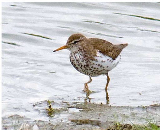
395 Amerikaanse Oeverloper / Spotted Sandpiper Actitis macularia , adult zomerkleed, Hogerwaardpolder, Zeeland, 31 juli 2011 (Marcel Klootwijk)