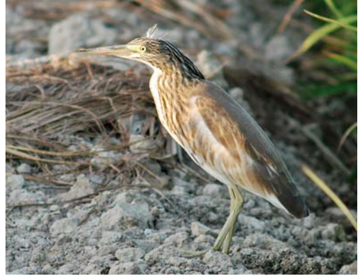
405 Squacco Heron / Ralreiger Ardeola ralloides , juvenile, Ebro delta, Catalunya, Spain, 25 July 2009

head and mantle was not evident (or absent) in September and this agrees with a start of growth in autumn, growing through January-February, to be retained until replacement during the following post-breeding moult (Pyle & Howell 2004).