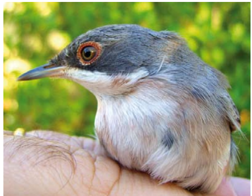
543 Red-eyed Vireo / Roodoogvireo Vireo olivaceus , Cape Clear, Cork, Ireland, 10 October 2011 544 Scarlet Tanager / Zwartvleugeltangare Piranga olivacea , first-year male, St Mary's, Scilly, England, 22 October 2011 545 Mugimaki Flycatcher / Mugimakivliegenvanger Ficedula mugimaki , first-year male, Bagolino, Brescia, Italy, 6 October 2011 546 Ménétriés's Warbler / Ménétriés' Zwartkop Sylvia mystacea , first-year male, Rabat, Malta, 21 August 2011

will be the first for Hungary. In Italy, a Yellow-breasted Bunting E aureola was found on Linosa on 4 November. The Black-and-white Warbler Mniotilta varia on St Mary's from 17 September was last seen on 21 September. The first-year Northern Parula Setophaga americana near Reykjavík, Iceland, on 20 September was not seen subsequently. An Ovenbird Seiurus aurocapilla was seen briefly at Castlebay, Barra, Outer Hebrides, on 23-25 October. The Northern Waterthrush Parkesia noveboracensis on St Mary's from 16 September was still present in the second week of November; it was trapped and ringed on 1 October. A female Common Yellowthroat Geothlypis trichas at Hafurbjarnarstaðir, Miðnes, on 26-29 October was the third for Iceland.