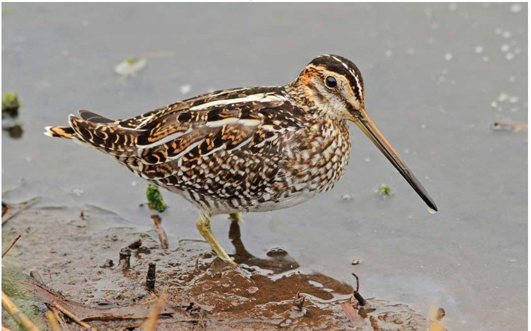
521 Wilson's Snipe / Amerikaanse Watersnip Gallinago delicata , St Mary's, Scilly, England, 10 October 2011 (Gary Thoburn)