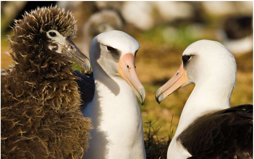
505 Laysan Albatrosses / Laysanalbatrossen Phoebastria immutabilis , Midway Atoll, Hawaii, 9 April 2010

Laysan Albatross is one of the smaller albatross species with a wingspan of 'only' c 2.10 m. The population is rebounding from a period of severe hunting in the early 1900s. Feather hunters killed many 100 000s and the slaughter eventually led to the protection on the north-western Hawaiian Islands. On Midway, airport activities and communications antennas also took a heavy toll in bird strikes in the 1940s and 1950s. Perhaps the most significant ecological catastrophe took place during the Battle of Midway, when rats from ships first gained access to Sand Island with dire consequences for nesting birds. The rats are gone and large obstacles have been removed on Midway, and since then the population has been steadily growing although it seems to stabilize now. Counts in 2010 on Midway indicated 420 000 breeding pairs, c 75% of the total world breeding population of 590 000 pairs. Laysan Island, Hawaii, has the second largest colony with more than 100 000 pairs. Smaller numbers breed on islands off Japan and, since the 1980s, Mexico (BirdLife International 2010a). The main current threat is long-line fishing. Laysan is also vulnerable to ingestion of floating plastics which have contaminated ma-