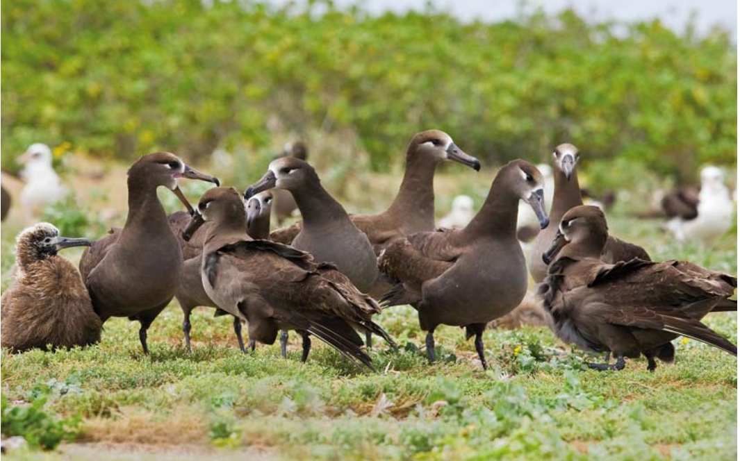
510 Black-footed Albatrosses / Zwartvoetalbatrossen Phoebastria nigripes , Midway Atoll, Hawaii, 11 April 2010

in 2005 (BirdLife International 2010c). On Midway, every year hybrids of Black-footed and Laysan Albatross are present (cf www.scholtz.org/bill/nature/Midway/index.html ).