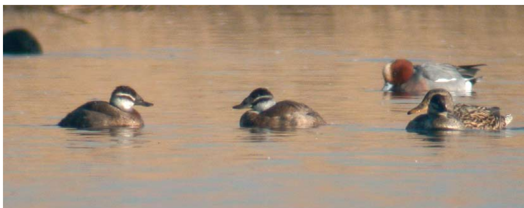
468 Surf Scoter / Brilzee-eend Melanitta perspicillata , adult male, with Common Eider / Eider Somateria mollissima , female, Horsmeertjes, Texel, Noord-Holland, 9 May 2010 ( Vincent Legrand ) 469 White-headed Ducks / Witkopeenden Oxyura leucocephala , Starrevaart, Leidschendam, Zuid-Holland, 28 February 2010 ( Sjaak Schilperoort )

bird, already accepted for the winter of 2007/08 (Ovaa et al 2009). The returning bird at Wieringermeer was first accepted for 26 December 2003 to 2 March 2004 (van der Vliet et al 2006).