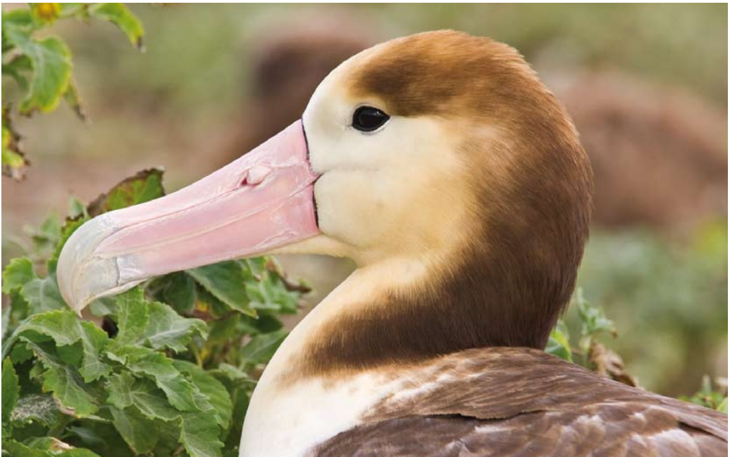
507 Short-tailed Albatross / Stellers Albatros Phoebastria albatrus , Midway Atoll, Hawaii, 11 April 2010