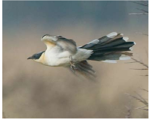
476 Great Crested Cuckoo / Kuifkoekoek Clamator glandarius , Lentevreugd, Wassenaar, Zuid-Holland, 24 March 2010 (René van Rossum)

Dutch Birding 32: 272, plate 366, 2010).