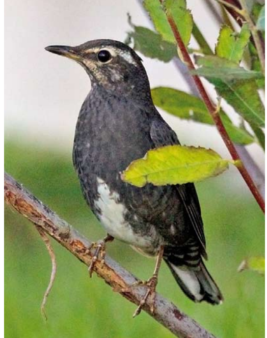
529 White's Thrush / Goudlijster Zoothera aurea , Heist, West-Vlaanderen, Belgium, 9 October 2011 530 Siberian Thrush / Siberische Lijster Geokichla sibirica , first-winter male, Røstlandet, Nordland, Norway, 26 October 2011 531 Siberian Rubythroat / Roodkeelnachtegaal Luscinia calliope , first-year male, Gulberwick, Mainland, Shetland, Scotland, 20 October 2011