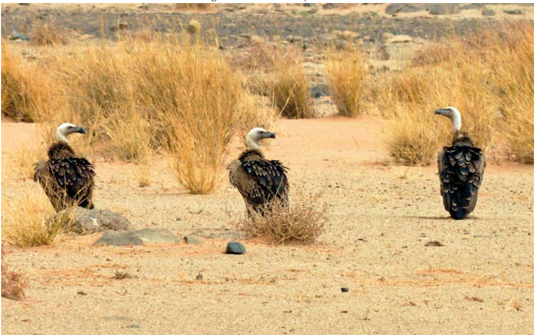
514 Rüppell's Vultures / Rüppells Gieren Gyps rueppellii , 5 km west of Aousserd, Oued-Ed Dahab, Morocco, 1 August 2011 (Michel Aymerich)