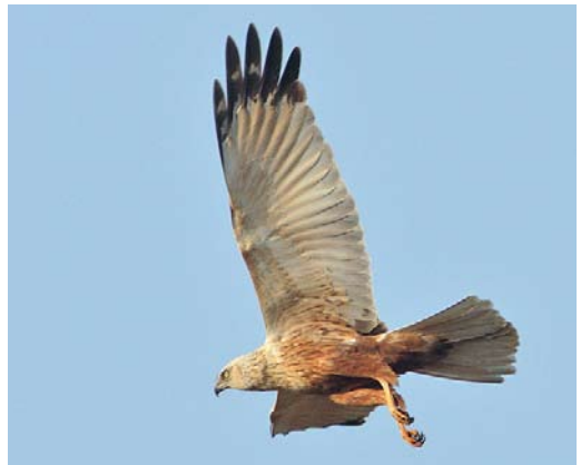
496-497 Western Marsh Harrier / Bruine Kiekendief Circus aeruginosus , adult male, Nijkerk, Gelderland, 2 June 2007 ( Jan van der Greef ) 498 Western Marsh Harrier / Bruine Kiekendief Circus aeruginosus , adult male, Hasselt, Overijssel, 28 May 2006 ( Jan Uilhoorn ). Same image used in figure 2 (left). 499 Western Marsh Harrier / Bruine Kiekendief Circus aeruginosus , adult male, Hasselt, Overijssel, 20 April 2009 ( Ton Valk ). Same image used in figure 2 (centre). 500 Western Marsh Harrier / Bruine Kiekendief Circus aeruginosus , adult male, Nijkerk, Gelderland, 9 May 2008 ( Karel A Mauer ) 501 Western Marsh Harrier / Bruine Kiekendief Circus aeruginosus , adult male, Nijkerk, Gelderland, 3 April 2009 ( Karel A Mauer ). Same image used in figure 1 (left) and figure 2 (right).