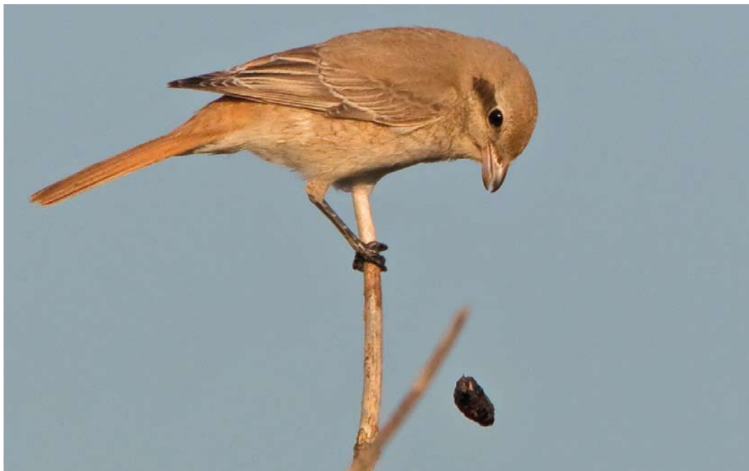
555 Daurische Klauwier / Daurian Shrike Lanius isabellinus , eerstejaars, De Nederlanden, Texel, Noord-Holland, 2 oktober 2011