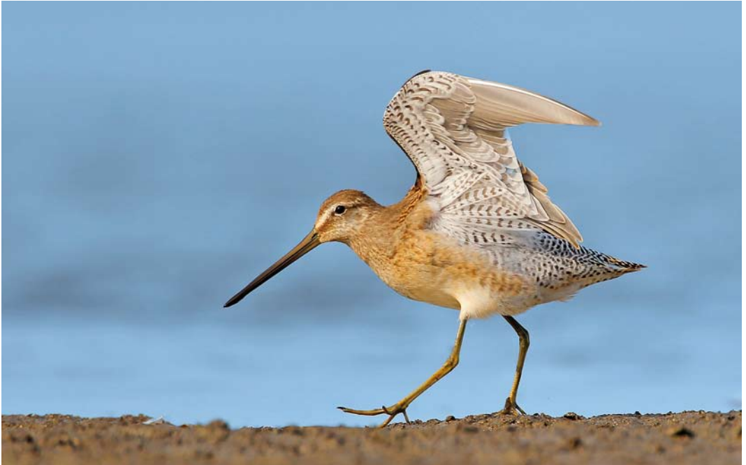
522 Long-billed Dowitcher / Grote Grijze Snip Limnodromus scolopaceus , Oborniki, Poznan, Poland, 4 October 2011 (Mateusz Matysiak)