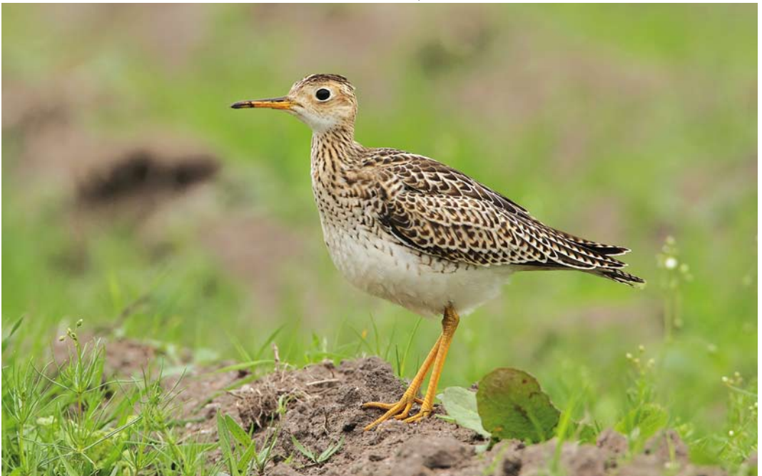
523 Upland Sandpiper / Bartrams Ruitter Bartramia longicauda , juvenile, St Mary's, Scilly, England, 10 October 2011