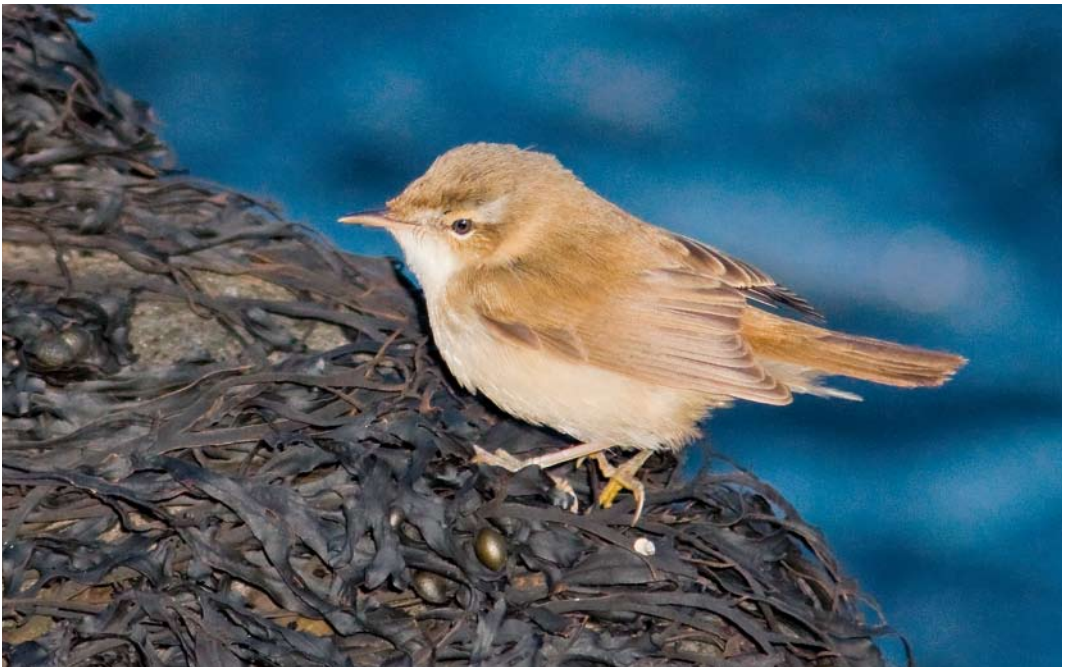
578 Veldrietzanger / Paddyfield Warbler Acrocephalus agricola , Hoek van Holland, Zuid-Holland, 15 oktober 2011 (Peter Soer)