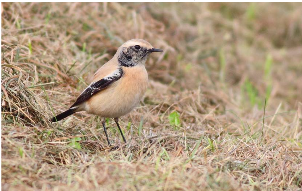
580 Woestijntapuit / Desert Wheatear Oenanthe deserti , eerstejaars mannetje, Camperduin, Noord-Holland, 30 oktober 2011 ( Cock Reijnders )