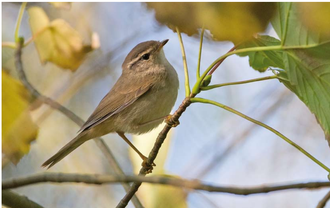
575 Raddes Boszanger / Radde's Warbler Phylloscopus schwarzi , Nieuwe Kooi, Vlieland, Friesland, 22 oktober 2011 (Jaap Denee)