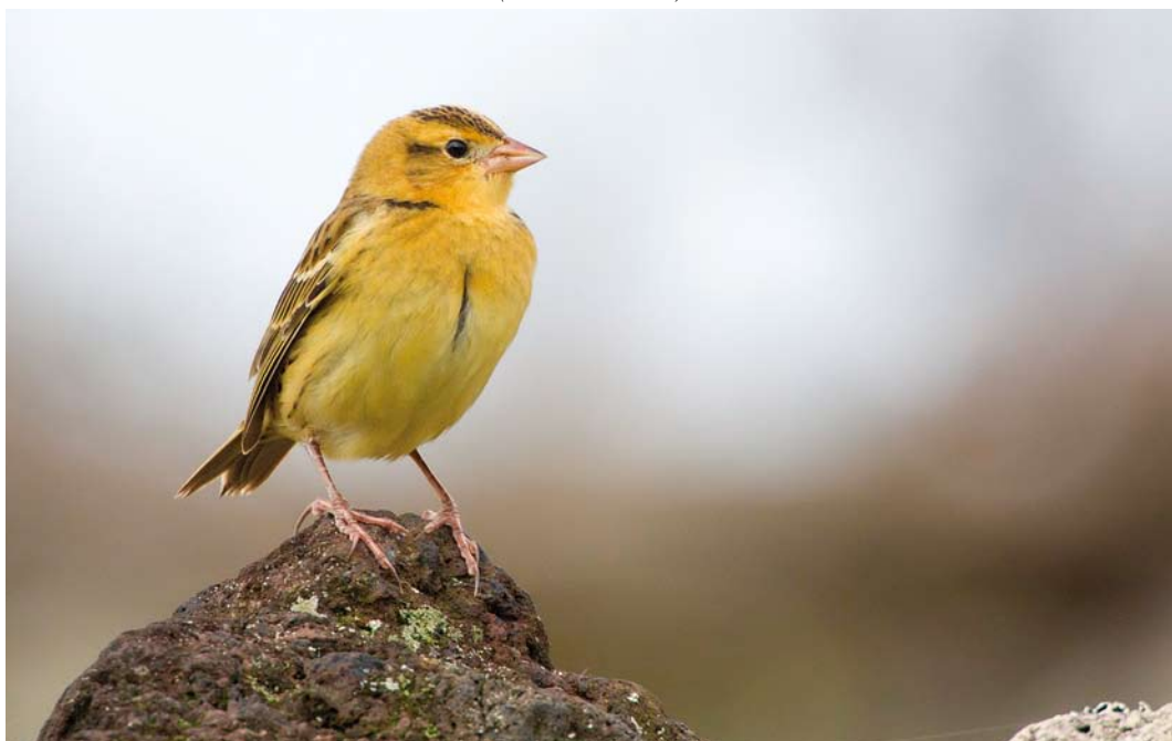
548 Bobolink / Bobolink Dolichonyx oryzivorus , Flores, Azores, 13 October 2011 (David Monticelli)