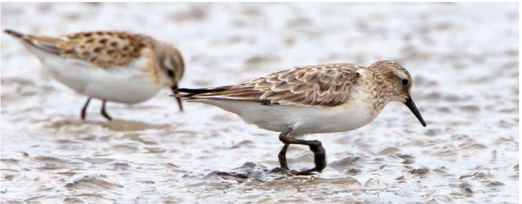
524 Purple Martin / Purperzwaluw Progne subis , Corvo, Azores, 13 October 2011 ( Rami Mizrachi ) 525 American Cliff Swallow / Amerikaanse Klifzwaluw Petrochelidon pyrrhonota , Corvo, Azores, 13 October 2011 ( Rami Mizrachi ) 526 Semipalmated Plover / Amerikaanse Bontbekplevier Charadrius semipalmatus , first-year, Ventry, Kerry, Ireland, 25 September 2011 ( Aidan G Kelly ) 527 Long-toed Stint / Taigastrandloper Calidris subminuta , first-winter, La Turballe, Loire-Atlantique, France, 6 November 2011 ( Aymeric Mousseau ) 528 Baird's Sandpiper / Bairds Strandloper Calidris bairdii , adult, Tienen, Vlaams-Brabant, Belgium, 20 September 2011 ( Fonny Schoeters )