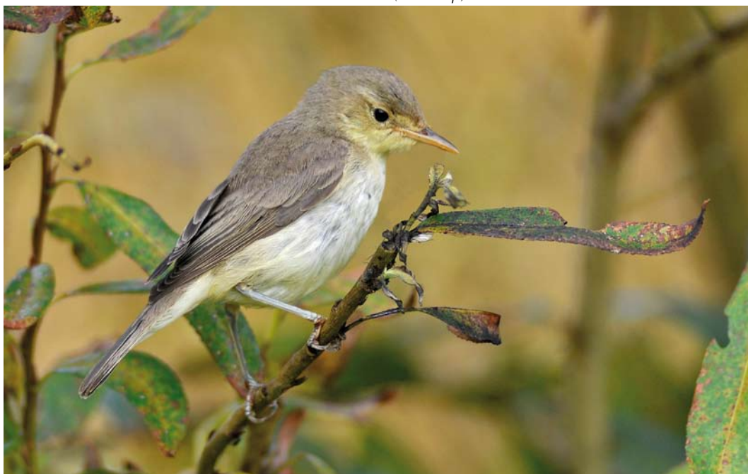
576 Orpheusspotvogel / Melodious Warbler Hippolais polyglotta , Robbenjager, Texel, Noord-Holland, 3 oktober 2011