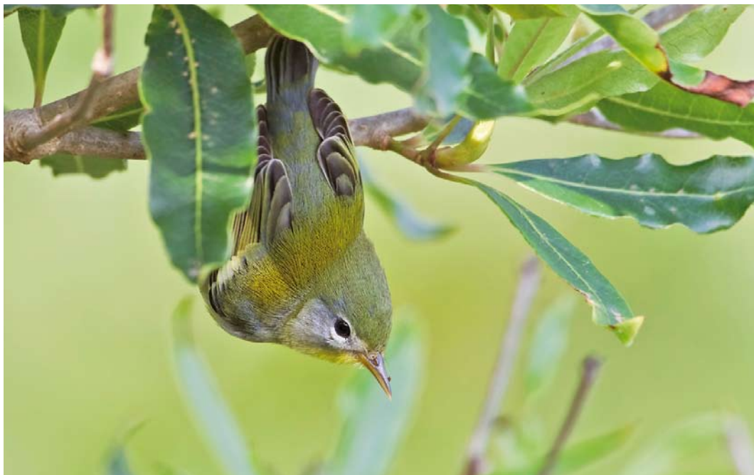
547 Northern Parula / Brilparulazanger Setophaga americana , Corvo, Azores, Iceland, 11 October 2011