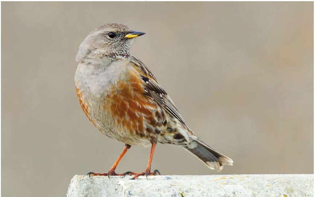
250 Alpine Accentor / Alpenheggenmus Prunella collaris , Zeebrugge, West-Vlaanderen, Belgium, 7 May 2012