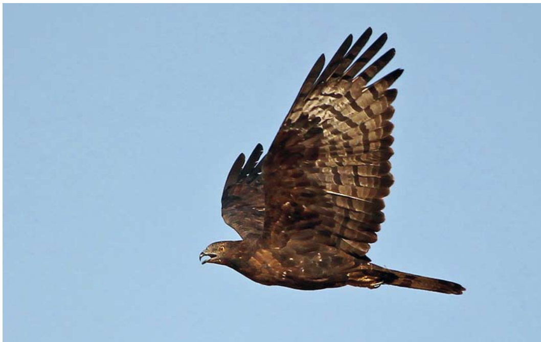
226 Crested Honey Buzzard / Aziatische Wespensdief Pernis ptilorhyncus , Eilat, Israel, 8 April 2012 (Kris De Rouck)