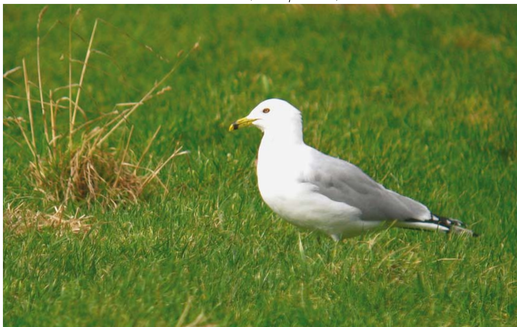
231 Ring-billed Gull / Ringsnavelmeeuw Larus delawarensis , adult (PAA3), Maaseik, Limburg, Belgium, 6 March 2012 (Emiel Opdenacker)