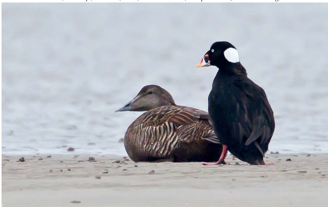
259 Brilzee-eend / Surf Scoter Melanitta perspicillata , adult mannetje, met Eider / Common Eider Somateria mollissima , vrouwtje, Mokbaai, Texel, Noord-Holland, 17 april 2012 (Jos van den Berg)