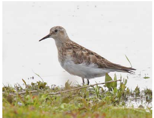
284 Withalsvliegenvanger / Collared Flycatcher Ficedula albicollis , mannetje, Vinkel, Noord-Brabant, 24 mei 2012 ( Bas van de Meulengraaf ) 285 Kleine Klapetekster / Lesser Grey Shrike Lanius minor , Science Park, Amsterdam, Noord-Holland, 14 mei 2012 ( Cock Reijnders ) 286 Roodkopklauwier / Woodchat Shrike Lanius senator , Voorboezem, Wieringen, Noord-Holland, 3 mei 2012 ( Co van der Wardt ) 287 Citroenkwikstaarten / Citrine Wagtails Motacilla citreola , vrouwtjes, Azewijn, Gendringen, Gelderland, 30 april 2012 ( Wim Gerritsen ) 288 Aziatische Goudplevier / Pacific Golden Plover Pluvialis fulva , Middelburg, Zeeland, 20 mei 2012 ( Vincent Legrand ) 289 Bairds Strandloper / Baird's Sandpiper Calidris bairdii , Deventer, Overijssel, 17 mei 2012 ( Wietze Janse )