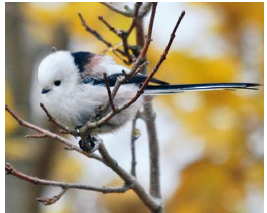
191 White-headed Long-tailed Tit / Witkopstaartmees Aegithalos caudatus caudatus , Westkapelle, Zeeland, Netherlands, 30 October 2010. Part of migrating flock of nine caudatus with three europaeus . 192 White-headed Long-tailed Tit / Witkopstaartmees Aegithalos caudatus caudatus , Rembrandtpark, Amsterdam, Noord-Holland, Netherlands, 20 December 2010. A thorough check of this city park yielded several flocks of caudatus . 193 White-headed Long-tailed Tit / Witkopstaartmees Aegithalos caudatus caudatus , Eemshaven, Groningen, Netherlands, 31 October 2010

western European countries (eg, Belgium, Britain and France), the taxon is regarded as a rarity and therefore records are considered by the national rarities committees.