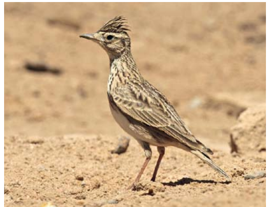
241 Atlas Flycatcher / Atlasliegenvanger Ficedula speculigera , male, Capo Murro di Porco, Sicily, Italy, 24 April 2012 242 Brown-headed Cowbird / Bruinkopkoevogel Molothrus ater , Greifwalder Oie, Mecklenburg-Vorpommern, Germany, 15 May 2012 243 Bar-tailed Lark / Rosse Woestijnleeuwerik Ammomanes cinctura , Capo Murro di Porco, Siracusa, Sicily, Italy, 17 April 2012 244 Oriental Skylark / Kleine Veldleeuwerik Alauda gulgula , El Gouna, Al Bahr al Ahmar, Egypt, 27/28 March 2012

on 4 May. In the second half of April, an Eastern Crowned Warbler Phylloscopus coronatus , an immature male Siberian Blue Robin Larvivora cyane and an Asian Stubtail Urosphena squameiceps at Ashmore Reed, the closest point of Australian territory to Indonesia, concerned first records for Australia, and an immature male Siberian Thrush Geokichla sibirica was the first seen alive. If accepted, a Green Warbler P. nitidus trapped on Lågskär, Åland, on 20 May will be the first for Finland. In the Netherlands, Hume's Leaf Warblers P. humei remained at Katwijk aan Zee, Zuid-Holland, from 9 December 2011 to 22 April, with a second individual at Katwijk aan de Rijn from 25 March to 16 April, and at Schiedam, Zuid-Holland, from 15 March to 22 April (probably the same individual staying here on 3-12 December 2011). The one wintering at Wyke Regis, Dorset, England, and reappearing on 11 March stayed until at least 26 April. An individual found on Fuerteventura on 6 April was the first for the Canary Islands. An