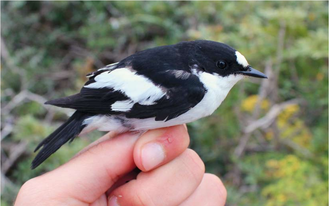
253 Atlas Flycatcher / Atlasvliegenvanger Ficedula speculigera , male, Comino, Malta, 15 April 2012 ( Raymond Galea ) 254 Trumpeter Finch / Woestijnvink Bucanetes githagineus , female, Migra Ferha, Malta, 7 May 2012 ( Raymond Galea ) 255 Western Orpheat Warbler / Westelijke Orpheusgrasmus Sylvia hortensis , Hartlepool Headland, Cleveland, England, 29 May 2012 ( Brian Clasper )