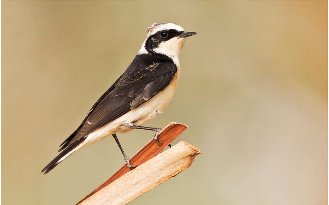
249 Pied Wheatear / Bonte Tapuit Oenathe pleschanka 'vittata', male, Eilat, Israel, 24 March 2012