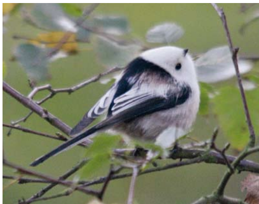
195 White-headed Long-tailed Tit / Witkopstaartmees Aegithalos caudatus caudatus , Vlieland, Friesland, Netherlands, 17 October 2010