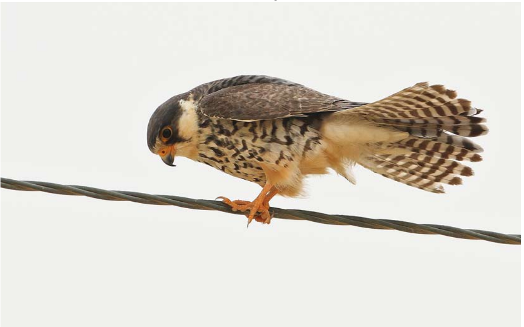
227 Amur Falcon / Amoerrootpootvalk Falco amurensis , female, Jahra East Outfall, Kuwait, 13 May 2012 (Pekka Fågel)