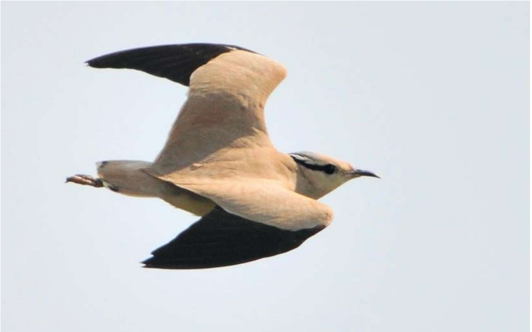
232 Cream-colored Courser / Renvogel Cursorius cursor , Bradnor Hill, Herefordshire, England, 21 May 2012 (Rebecca Nason)