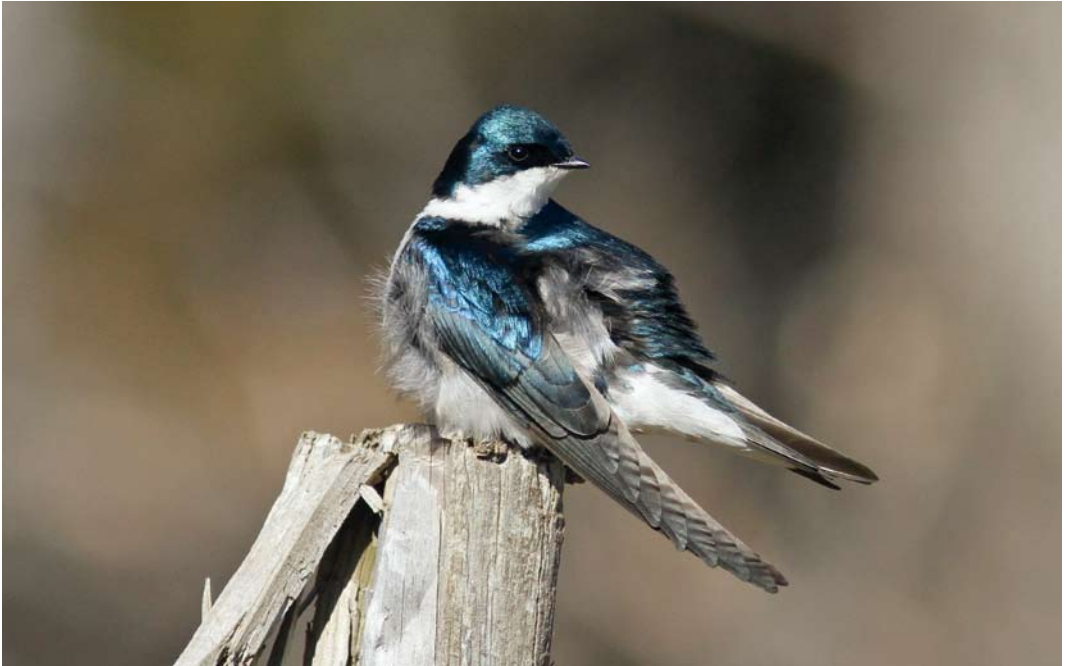
256 Tree Swallow / Boomzwaluw Tachycineta bicolor , Helluvatn, Reykjavík, Iceland, 16 May 2012 (Sigmundur Ásgeirsson)