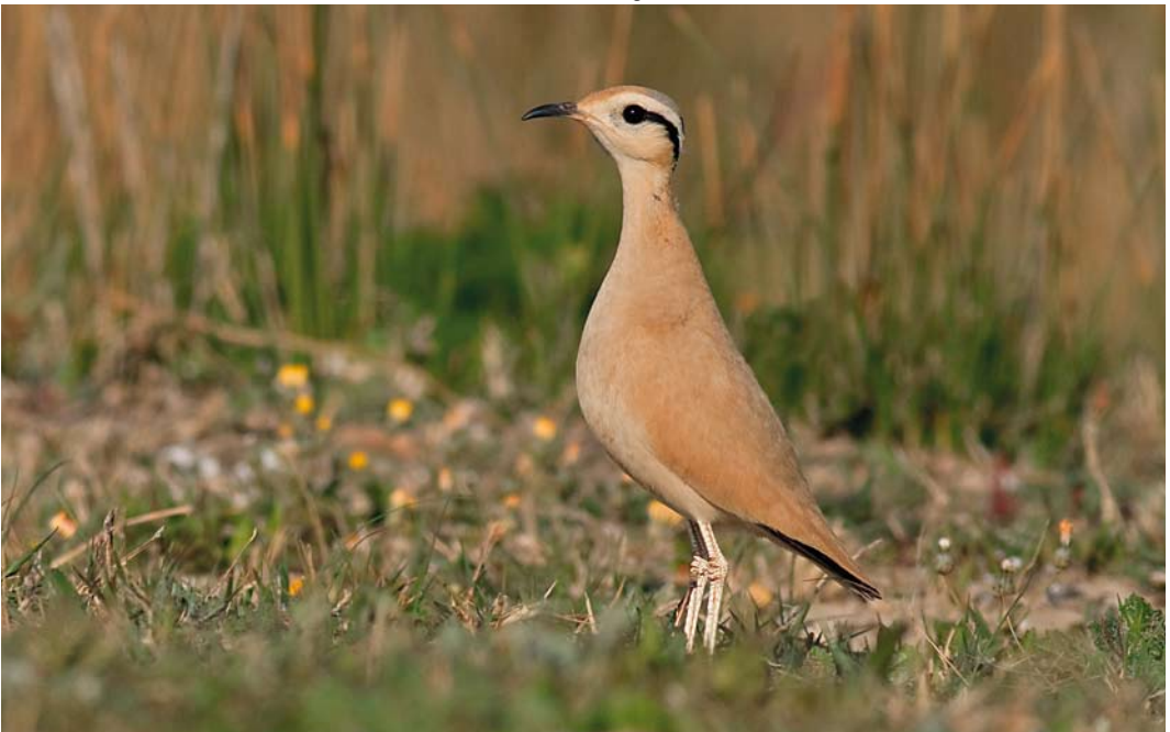
233 Cream-colored Courser / Renvogel Cursorius cursor , Los Lances beach, Tarifa, Cádiz, Spain, 12 April 2012