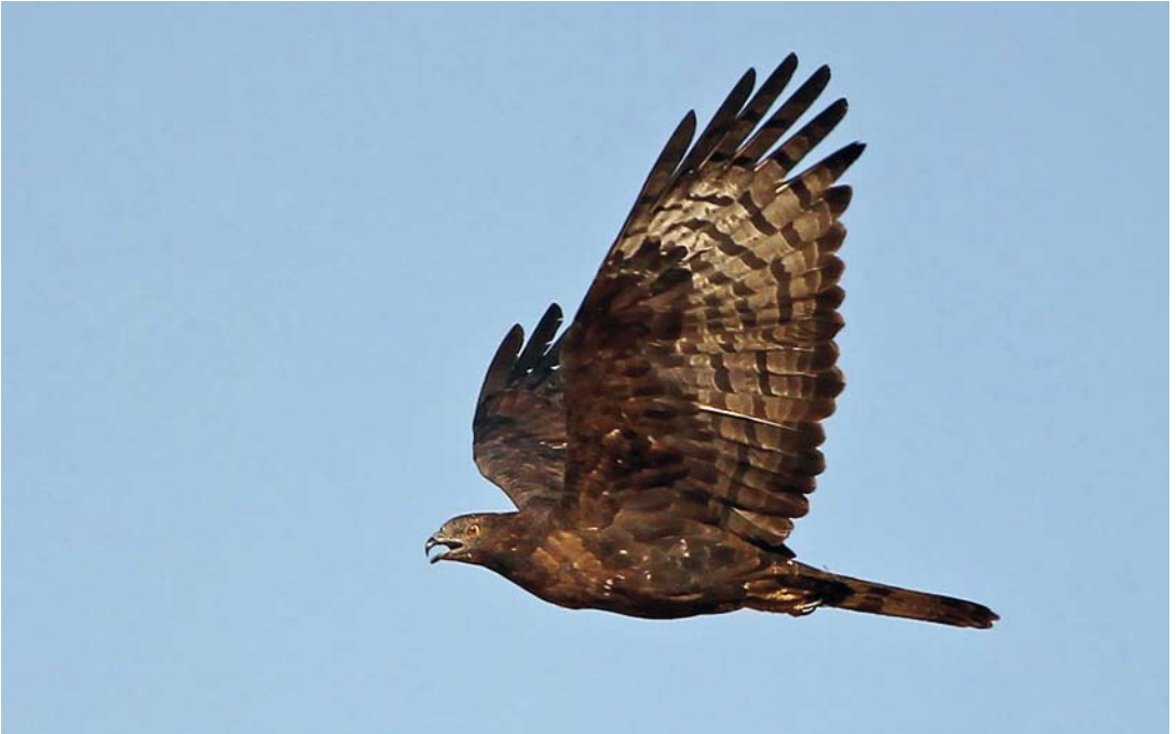
226 Crested Honey Buzzard / Aziatische Wespensdief Pernis ptilorhynchus , Eilat, Israel, 8 April 2012 (Kris De Rouck)