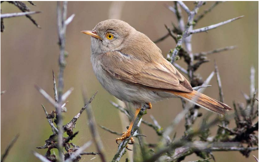
257 Asian Desert Warbler / Woestijngrasmus Sylvia nana , Grenen, Skagen, Nordjylland, Denmark, 20 May 2012