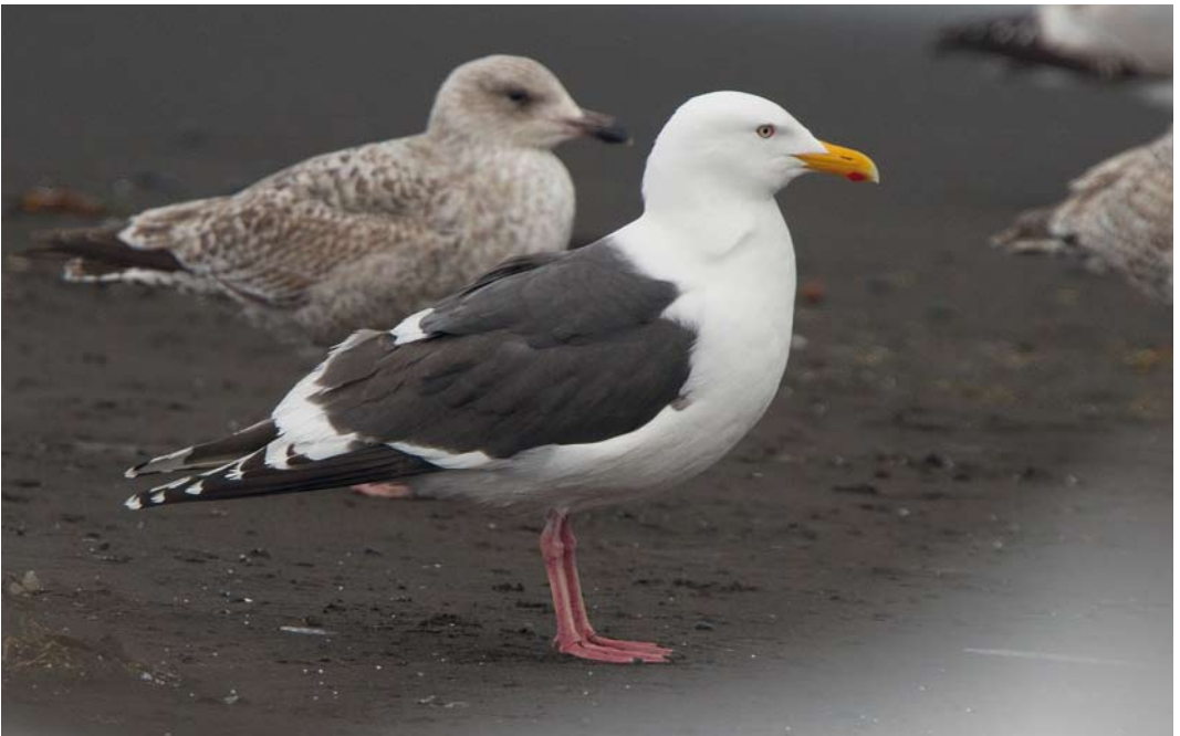
229 Slaty-backed Gull / Kamtsjatkameeuw Larus schistisagus , adult, Húsavík, Iceland, 14 May 2012 (Yann Kolbeinsson)