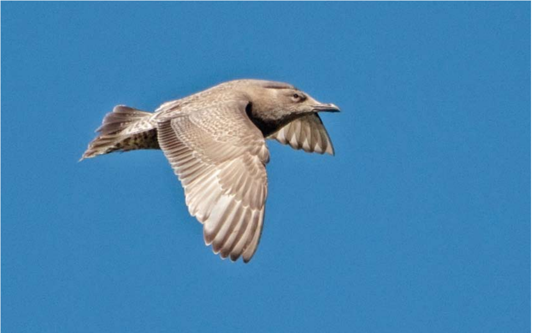
228 Thayer's Gull / Thayers Meeuw Larus thayeri , first-winter, Elsham, Lincolnshire, England, 5 April 2012