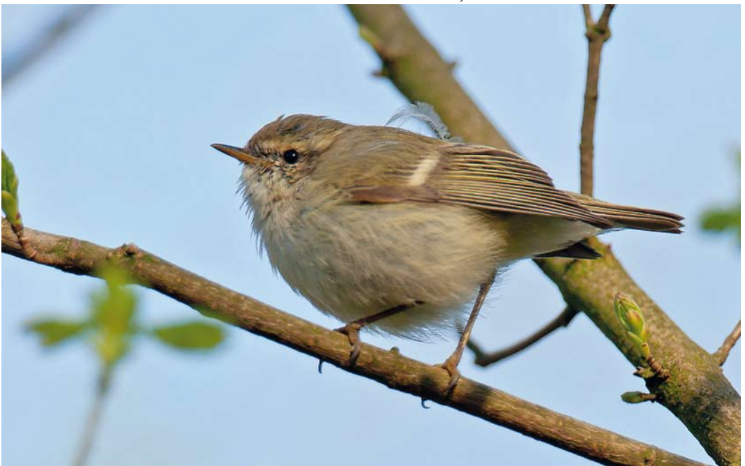
277 Humes Bladkoning / Hume's Leaf Warbler Phylloscopus humei , Katwijk aan den Rijn, Zuid-Holland, 28 maart 2012 (Arnold W J Meijer)