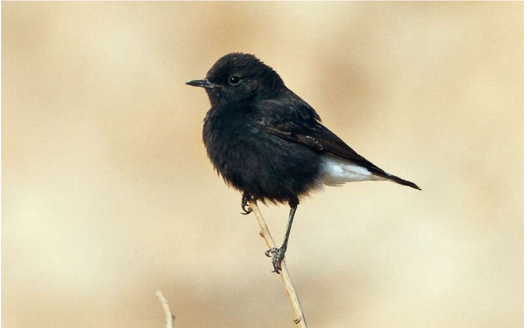
251 Basalt Wheatear / Basalttapuit Oenanthe lugens warriae , Uvda valley, Israel, 29 March 2012 (Yoav Perlman)