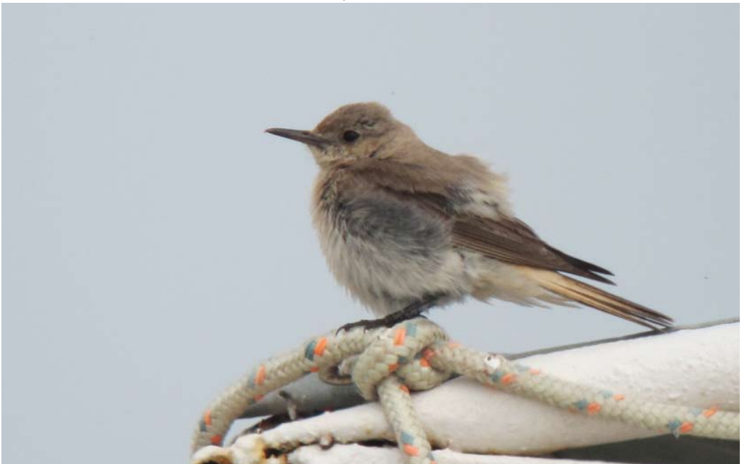
252 Hooded Wheatear / Monnikstapuit Oenanthe monacha , female, Nestos delta, Greece, 19 May 2012