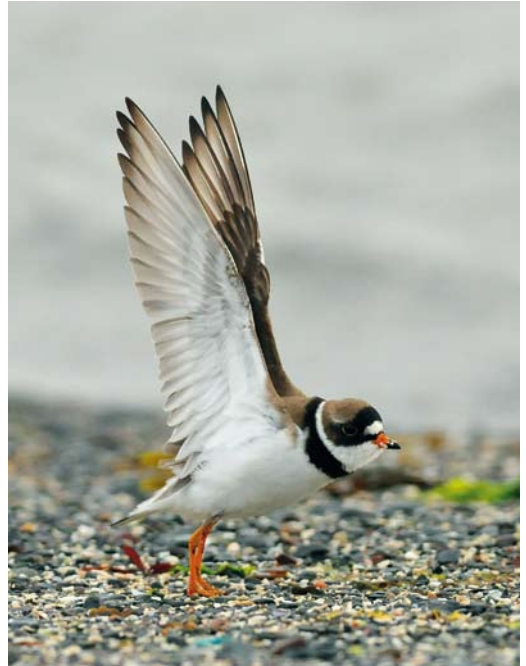
360 Northern Carmine Bee-eater / Noordelijke Karmijnrode Bijeneter Merops nubicus , Öland, Sweden, 2 June 2012 ( Christian Cederroth ) 361 Semipalmated Plover / Amerikaanse Bontbekplevier Charadrius semipalmatus , adult summer, Vardø, Finnmark, Norway, 4 July 2012 ( Tormod Amundsen ) 362 European Roller / Scharrelaar Coracias garulus , adult male, Aldbrough, East Yorkshire, England, 5 June 2012 ( Rebecca Nason )