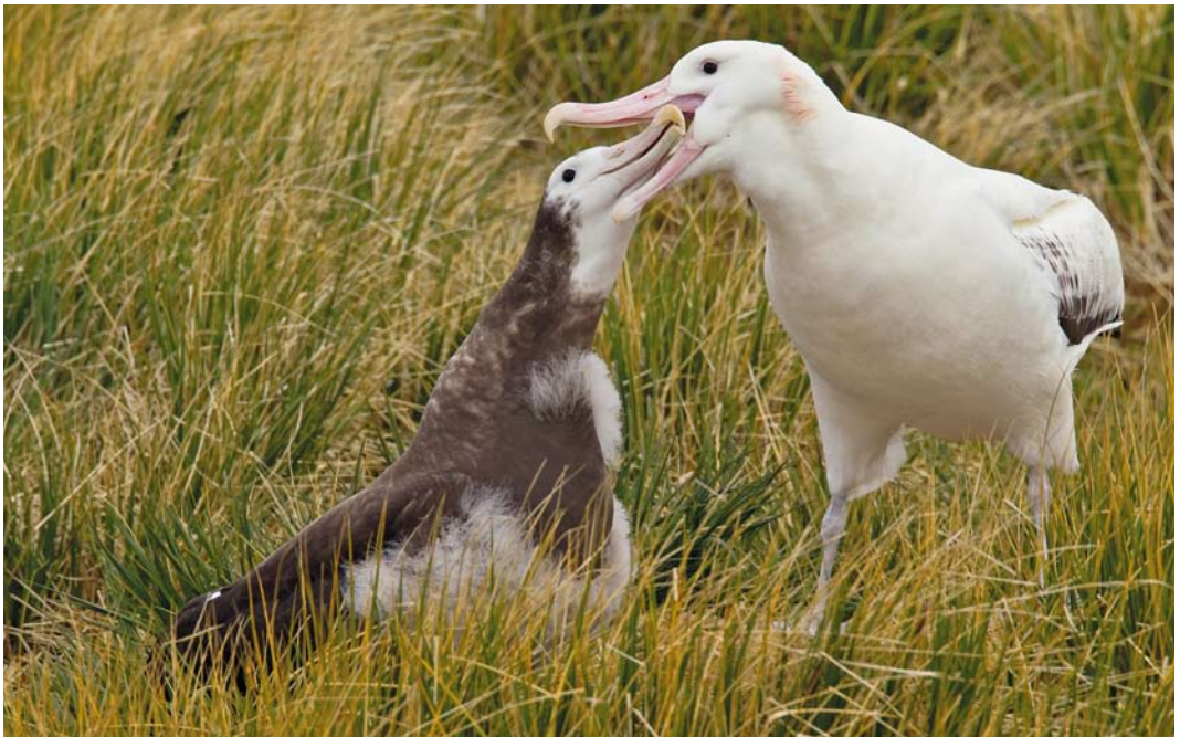
330 Snowy Albatrosses / Grote Albatrossen Diomedea exulans , adult and juvenile, Prion Island, South Georgia, 16 November 2010

A decline of the breeding population of all albatross species is a general trend, mainly because of widespread non-regulated fishery (cf Jiménez et al 2009, IUCN 2012). Most species have lost 60-75% of the population within three generations (75-90 years). Also introduced cats, mice, pigs and rats