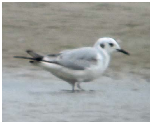
320 Kleine Kokmeeuw / Bonaparte's Gull Chroicocephalus philadelphia , eerste-zomer, Razende Bol, Noord-Holland, 3 mei 2012 (Tim Zutt)