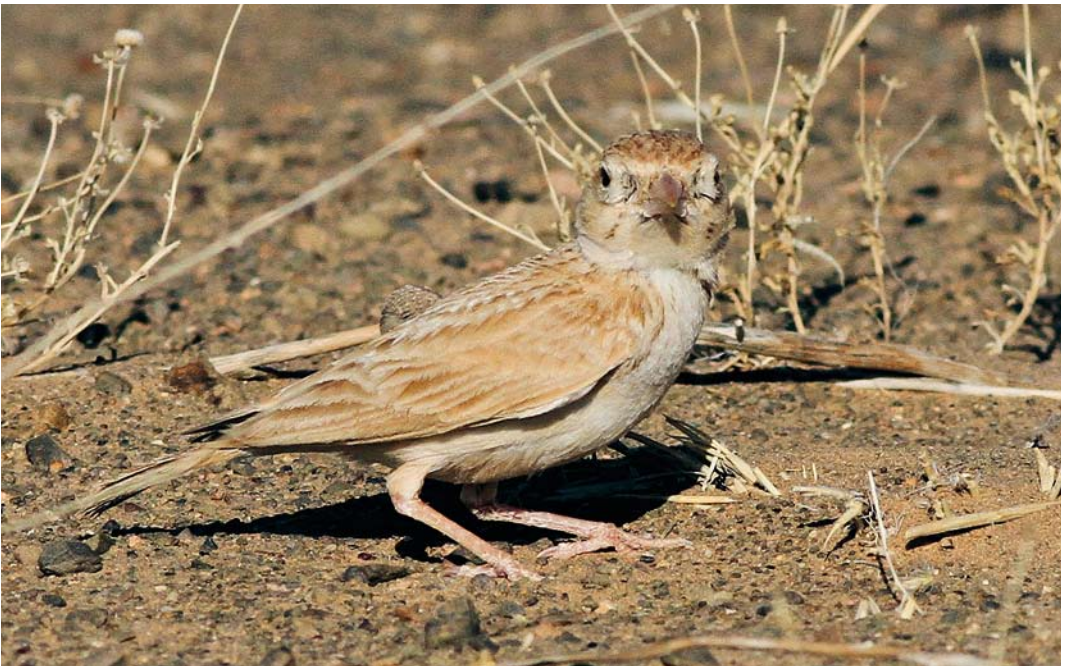
364 African Dunn's Lark / Afrikaanse Dunns Leeuwerik Eremalauda dunni dunni , Merzouga, Morocco, 7 June 2012