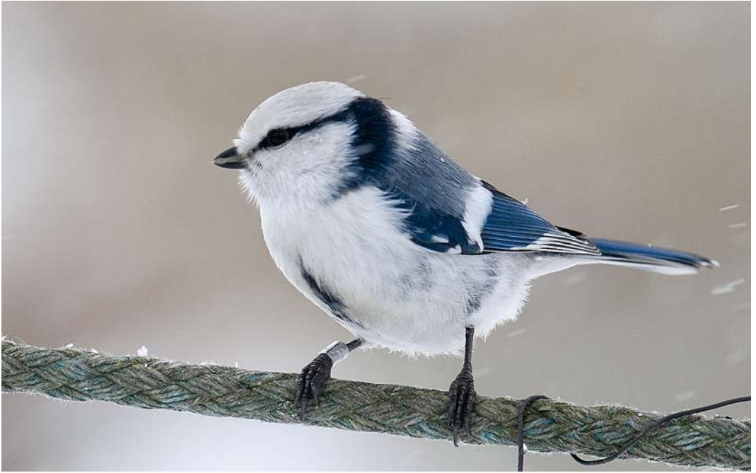
307-308 Hybrid Azure x European Blue Tit / hybride Azuurmees x Pimpelmees Cyanistes cyanus x caeruleus , Kuusamo Sossonniemi, Finland, 3 March 2007. This individual could be a second-generation hybrid since it was so similar to Azure Tit.