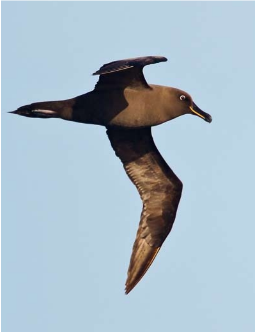
337 Sooty Albatross / Zwarte Albatros Phoebastria fusca , adult, at sea, south of Gough, 7 April 2011 (Otto Plantema)