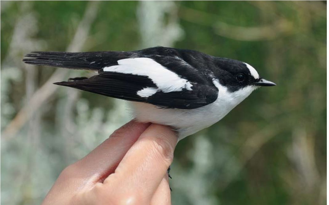
363 Atlas Flycatcher / Atlasvliegenvanger Ficedula speculigera , adult male, Ventotene, Italy, 22 April 2012 cf Dutch Birding 34: 194, 2012 (not early May)