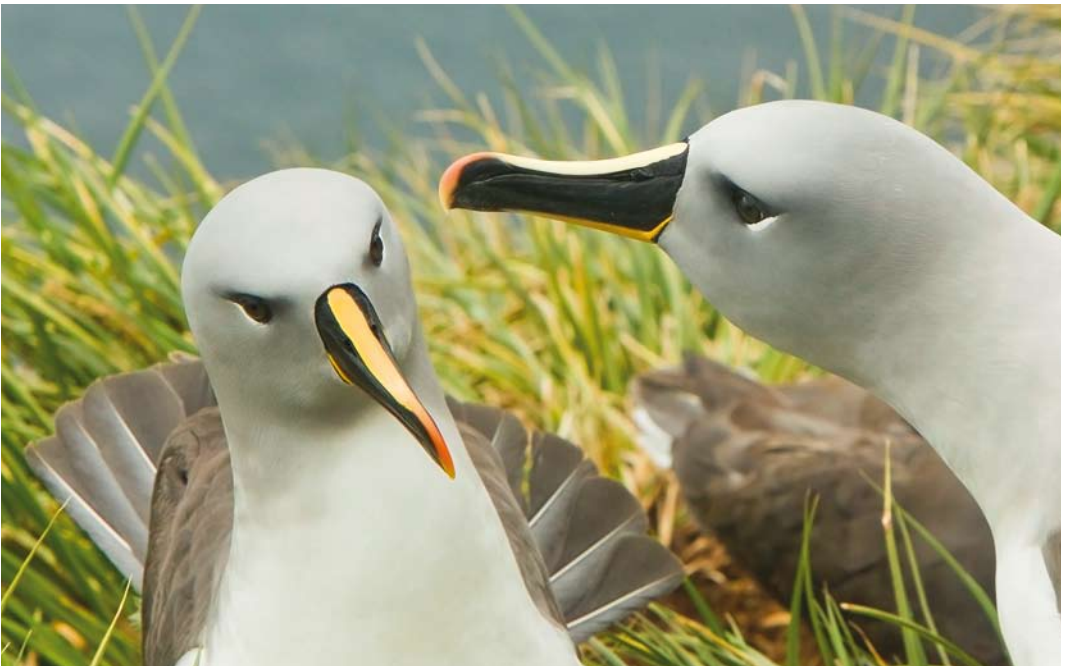
342 Grey-headed Albatrosses / Grijskopalbatrossen Thalassarche chrysostoma , adults, Elsenhul, South Georgia, 14 November 2010 ( Otto Plantema )