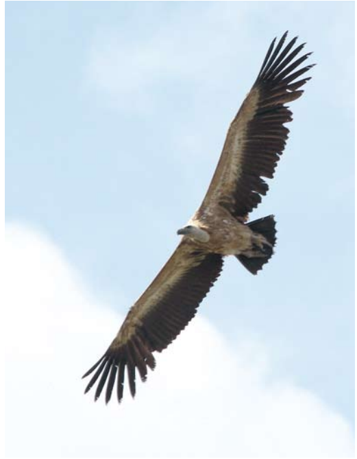
368 Bergfluitier / Western Bonelli's Warbler Phylloscopus bonelli , Veluwezoom, Rheden, Gelderland, 13 juni (Roland Jansen) 369 Vale Gier / Griffon Vulture Gyps fulvus , tweede kalenderjaar, Sint Pietersberg, Maastricht, Limburg, 26 juni 2012 (Ger de Hoog) 370 Grauwe Fitis / Greenish Warbler Phylloscopus trochiloides , Rottumeroog, Groningen, 13 juni 2012 (Martijn Bunskoek)