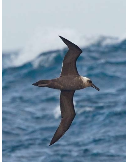
338 Sooty Albatross / Zwarte Albatros Phoebastria fusca , immature, at sea, south of Gough, 10 April 2011

has led to a very low fledging success of c 15%. The mice are gnawing at the chick's body until they eventually die through blood loss, infection or destruction of vital organs. These House Mice have increased in weight, from 15 g to 'giants' up to 40 g. An eradication programme for the mice is underway. This would certainly be the largest such effort undertaken to date. Longline fishing also kills an estimated 500 individuals every year. As a result, the species is under strong pressure and is therefore qualified as 'Critically Endangered' (IUCN 2012).