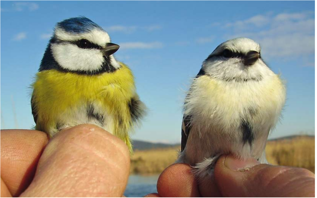
303-304 Hybrid Azure x European Blue Tit / hybride Azuurmees x Pimpelmees Cyanistes cyanus x caeruleus (right), with European Blue Tit / Pimpelmees C caeruleus , Vransko Jezero, Dalmacija, Croatia, 7 January 2006 (Ivica Lolič)