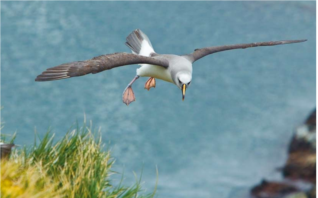
341 Grey-headed Albatross / Grijskopalbatros, Thalassarche chrysostoma , adult, Elsenhul, South Georgia, 12 November 2010 ( Otto Plantema )