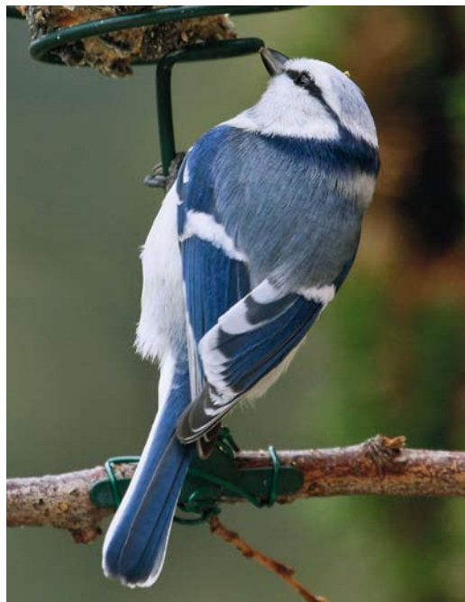
300 Azure Tit / Azuurmees Cyanistes cyanus , Polesie, Belarus, 28 April 2010 ( Krzysztof Błachowiak ) 301 Hybrid Azure x European Blue Tit / hybride Azuurmees x Pimpelmees Cyanistes cyanus x caeruleus , Grans, Bouches-du-Rhône, France, 30 December 2010 ( Michel Carré ) 302 Hybrid Azure x European Blue Tit / hybride Azuurmees x Pimpelmees Cyanistes cyanus x caeruleus , Grans, Bouches-du-Rhône, France, 3 January 2011 ( Michel Carré )