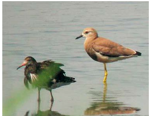
352 Spectacled Eiders / Brileiders Somateria fischeri , male and female, off Prins Karls Forland, Svalbard, 20 June 2012 353 Harlequin Duck / Harlekijneend Histrionicus histrionicus , male, Persfjorden, Finnmark, Norway, 30 June 2012 354 Eurasian Stone-curlews / Grielen Burhinus oediacnemus , Baden-Württemberg, Germany, 15 July 2012 355 White-tailed Lapwing / Witstaartkievit Vanellus leucurus , with Ruff / Kemphaan Philomachus pugnax , male, Dinnyés, Fejér, Hungary, 1 July 2012

photographed at Randaberg, Rogaland, Norway, on 10 July. An adult Sociable Lapwing Vanellus gregarius was found at Oostvaardersplassen, Lelystad, Flevoland, on 22 June; up to and including 2011, there were 50 records for the Netherlands. On 1-2 July, a White-tailed Lapwing V leucurus was photographed at Fertő, Dinnyés, Fejér, Hungary. A Great Knot Calidris tenuirostris first seen at Kokullen, Uppsala, on 18 June and, the next afternoon, more than 200 km further south-west at Erstadkärret, Visingsö, Småland, was the second for Sweden. A Western Sandpiper C mauri on Öland on 14-15 July was the second for Sweden. In the Azores, a Least Sandpiper C minutilla was found on 15 July at Cabo da Praia, Terceira. The second White-rumped Sandpiper C fuscicollis for Poland was an adult photographed at Szczecin lagoon near Świnoujście on 4 July (the first was on 28-29 May 1998) and the fifth Semipalmated Sandpiper C pusilla for Poland was found at the same site on 20 July. The first Sharp-tailed Sandpiper C acuminata for Jan Mayen, Norway, was present from 27 June to at least