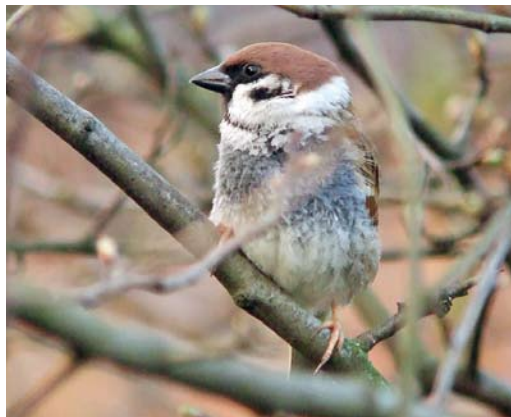
329 Ringmus / Eurasian Tree Sparrow Passer montanus , Cleasby, North Yorkshire, Engeland, 25 maart 2007 (Steve Clifton)

EURASIAN TREE SPARROWS WITH ABERRANT PLUMAGE AT MAKKUM IN 2009/10 Around Christmas 2009, four to six ab-