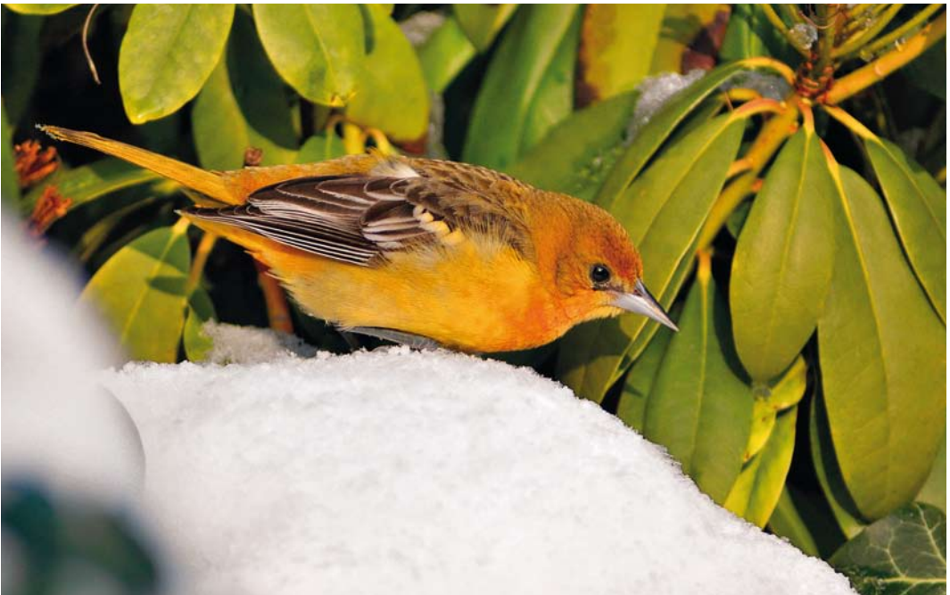
316 Baltimoretroepiaal / Baltimore Oriole Icterus galbula , eerstejaars mannetje, Oudorp, Alkmaar, Noord-Holland, 7 januari 2010

Op 5 januari was het spekglad in Oudorp. In de loop van de ochtend werd de troepiaal herondekt door Debby Doodeman in een den aan de Istriastraat. Deze dag werd hij ondanks de moeilijke omstandigheden regelmatig gezien door 150-200 vogelaars. De volgende dagen kwamen hij en de gladde twitch uitgebreid in het (landelijke) nieuws. Dit zorgde voor extra belangstelling en de periode daarna werd de troepiaal dagelijks gezien door 10-tallen vogelaars in een klein gebied met tuinen met veel vogelvoer (Argeloo 2010). In februari en begin maart werd hij nog regelmatig maar minder frequent waargenomen. Vervolgens werd hij op 28 maart opnieuw gemeld en bleef hij tot en met 14 april. In deze laatste periode trok hij door het doorkomende eerste-zomerkleed en de zangactiviteit nog wat extra belangstelling. Later bleek dat de vogel in ieder geval al vanaf begin december 2009 aanwezig was. De eerste documentatie (beschrijving) dateert van