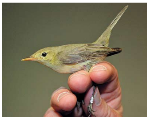
356 White-rumped Sandpiper / Bonapartes Strandloper Calidris fuscicollis , summer plumage, Świnoujście, Poland, 4 July 2012 (Marcin Solowiej) 357 Western Sandpiper / Alaskastrandloper Calidris mauri , first-summer, with Dunlin / Bonte Strandloper C alpina , Västerstadsviken, Öland, Sweden, 15 July 2012 (Tommy Holmgren) 358 Common Buttonquail / Gestreepte Vechtkwartel Turnix sylvaticus , near El Jadida, Morocco, 3 June 2012 (Paul French) 359 Melodious Warbler / Orpheusspottvogel Hippolais polyglotta , Blåvandshuk, Vestjylland, Denmark, 18 June 2012 (Henrik Knudsen)

SKUAS TO TERNS On 14 June, an adult pale-morph South Polar Skua Stercorarius maccormicki was photographed off Desertas, Madeira. In the Netherlands, the first-summer Bonaparte's Gull Chroicocephalus philadelphia at De Cocksdoorp, Texel, Noord-Holland, from 4 June stayed until at least 18 June; it was considered the same bird first seen at Den Helder on 3 May and on Texel on 4 May. The first for northern Iceland was an adult at Kaldbakstjarnir, Húsavík, on 6 June. The first Franklin's Gull Larus pipixcan for Kuwait was an adult photographed at Jahra East on 5-7 June. In Denmark, 15 Baltic Gulls L. fuscus fuscus at the Bornholm breeding sites had eight nestlings by 28 June. A colour-ring project over a 14-year period showed that the Bay of Biscay is an important non-breeding area for Yellow-legged Gulls L. michahellis from the western half of the Mediterranean, where this species' population may be regarded as partially migratory (Ring- ing & Migration 27: 26-31 2012). The first breeding of Caspian Gull L. cachinnans for the Netherlands concerned a male paired with a female Herring Gull L. argentatus