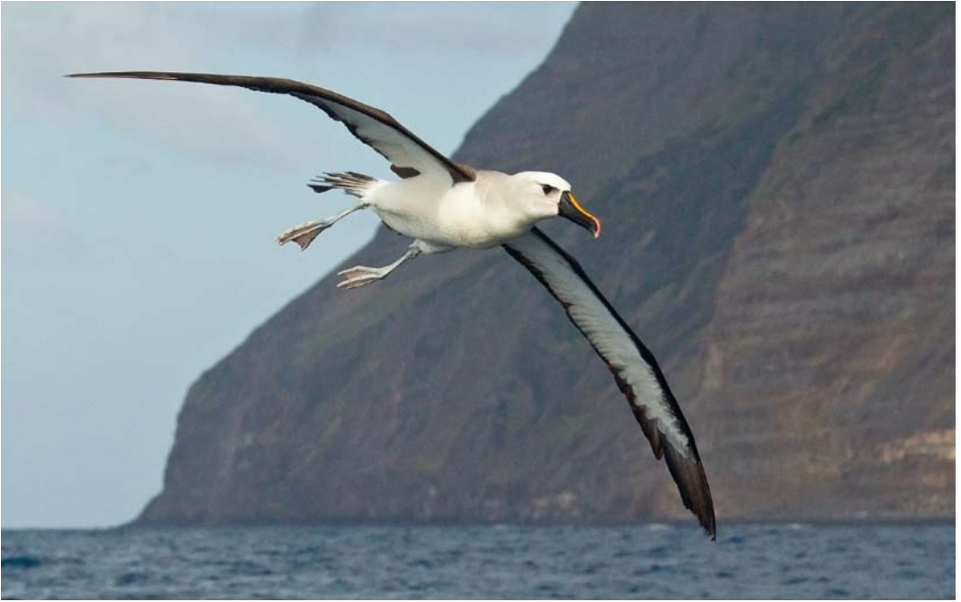
339-340 Atlantic Yellow-nosed Albatross / Atlantische Geelsnavelalbatros Thalassarche chlororhynchos , adult, Tristan da Cunha, 14 April 2011