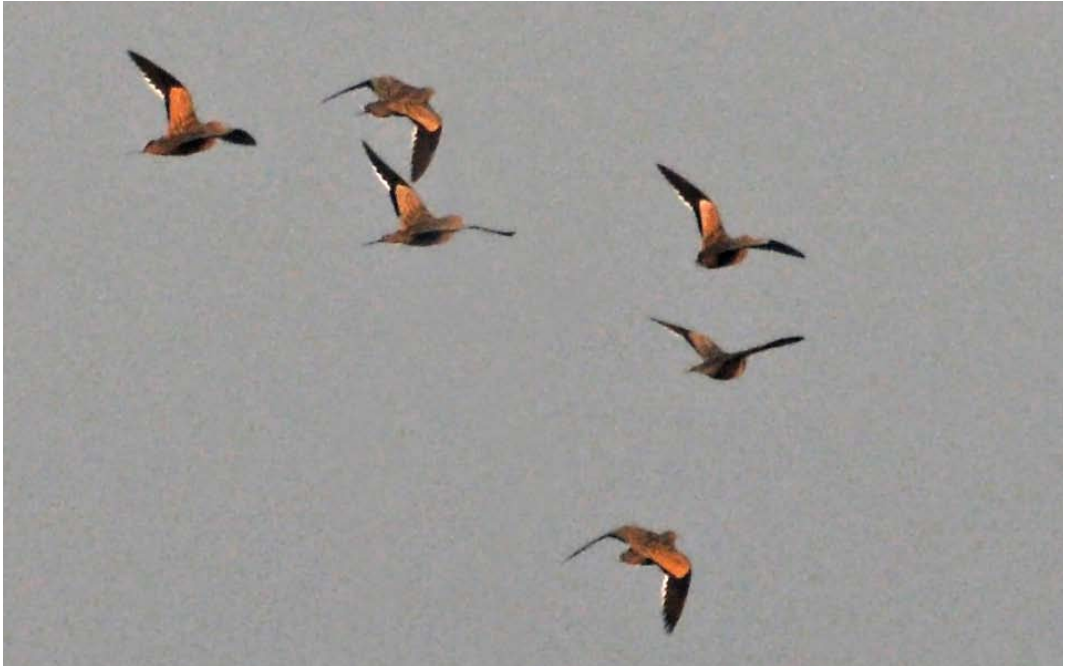
298 Chestnut-bellied Sandgrouse / Roodbuikzandhoenders Pterocles exustus , Al Bahnasa, Minya, Egypt, 22 March 2012

ly barred and streaked on the underparts than nominate exustus .