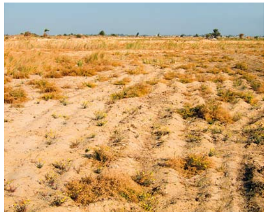
293 Habitat where Chestnut-bellied Sandgrouse Pterocles exustus were observed, Al Bahnasa, Minya, Egypt, 21 March 2012 (Leander Khil)

Male and female Chestnut-bellied Sandgrouse can be distinguished quite easily by the colour of the plumage. Males are more uniform on head and breast and show a sharply demarcated black line across the upperbreast. Face and throat are yellowish, contrasting little with a more greyish crown, neck and breast. Females have a heavily mottled breast and neck and lack the black line across the breast. The upperparts are less vividly colored and more mottled in females than in males. The subspecies P e floweri , which might be expected in the region, differs from other subspecies slightly in colour (Meintertzhagen 1930, Madge & McGowan 2002; Nicoll in British Ornithologists' Club 1921). Based on distribution