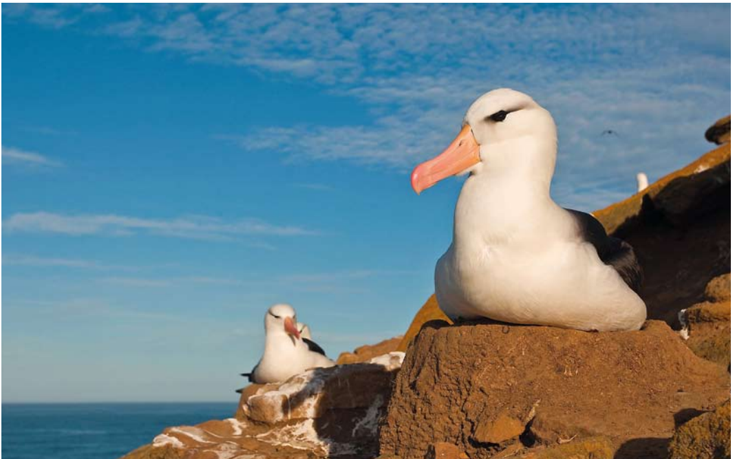
344 Black-browed Albatrosses / Wenkbrauwalbatrossen Thalassarche melanophris , adults, Pebble Island, Falkland Islands, 1 December 2007