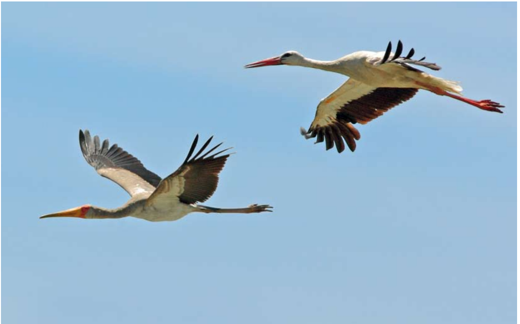
346 Yellow-billed Stork / Afrikaanse Nimmerzat Mycteria ibis , immature, with White Stork Ciconia ciconia , Mogan Gölü, Ankara, Turkey, 22 June 2012