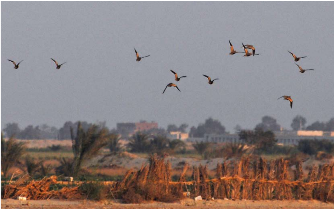
292 Chestnut-bellied Sandgrouse / Roodbuikzandhoenders Pterocles exustus , Al Bahnasa, Minya, Egypt, 22 March 2012 (Jonas Geburzi)

After the team left the country in late March and had been replaced by another team, more observations followed until the end of May; all observations are listed in table 1. On 17 May, sound-re-