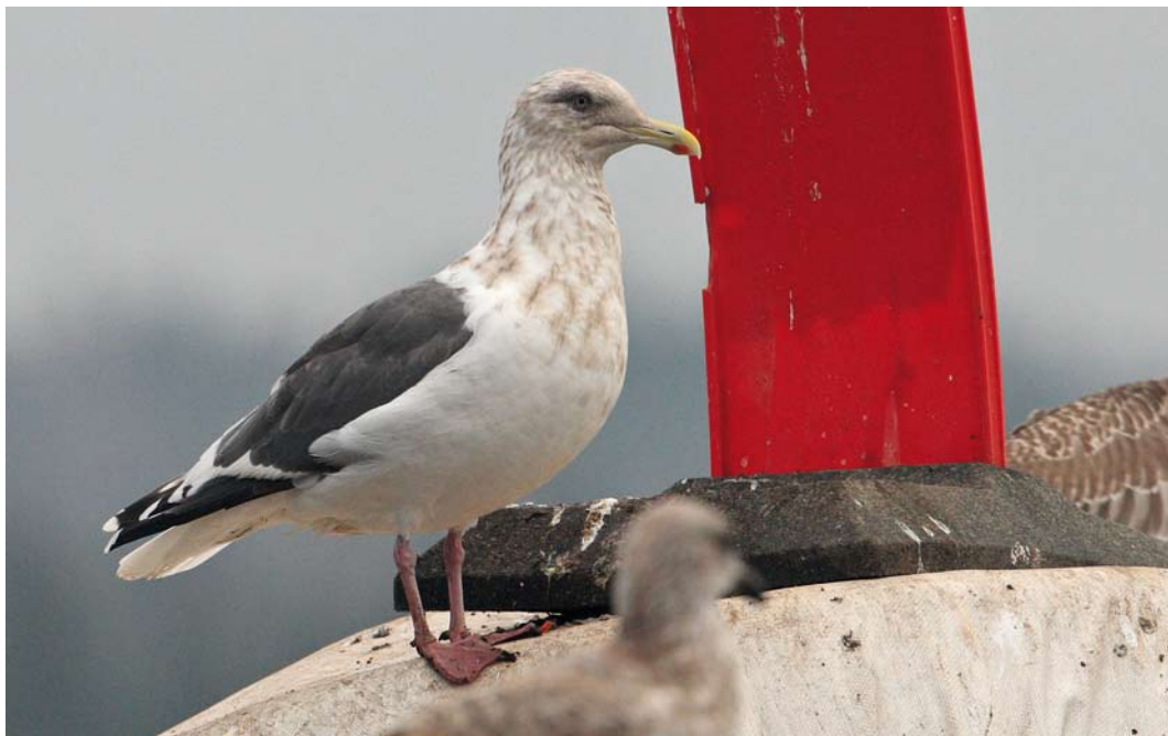
537 Slaty-backed Gull / Kamtsjatkameeuw Larus schistisagus , adult, Kikkonummi, Helsinki, Finland, 3 November 2012 (Petteri Hytönen)