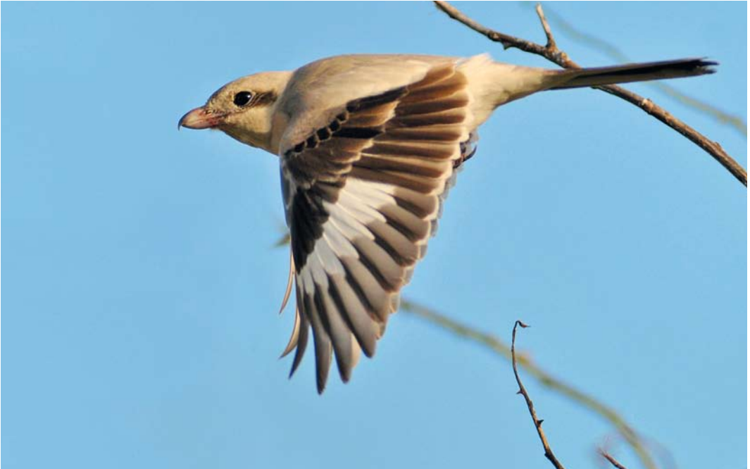
602 Steppeklapekster / Steppe Grey Shrike Lanius lahtora pallidirostris , eerste-winter, Buitendijk, Texel, Noord-Holland, 30 oktober 2012

Nachtgaal Luscinia luscinia werd op 8 september gevangen bij Castricum. Op minimaal 10 plekken langs de kust werden Kleine Vliegenvangers Ficedula parva ontdekt. Vooral op Texel en Vlieland lieten enkele exemplaren zich aan een groot publiek zien. Op www.waarneming.nl werd de soort in deze periode zelfs meer dan 500 keer ingevoerd. Twee late exemplaren verbleven op 27 oktober op Vlieland en bij Leidschendam. Aziatische Roodborstapuiten Saxicola maurus verbleven van 13 tot 15 oktober bij de Slufter op Texel en op 25 oktober in de Tuintjes op de noordpunt van Texel. Een derde exemplaar dat van 8 tot 23 oktober veel bekijks trok op de noordpunt van Texel, bleek – na bestudering van details in het verenkleed – dezelfde als de vogel die van 24 tot 26 oktober verbleef op Portland Bill, Dorset, Engeland, waar hij op 26 oktober werd gevangen; DNA-analyse toonde vervolgens aan dat het hier ging om een Stejnegers Roodborstapuit S m stejneri . Indien aanvaard betreft dit het eerste geval van dit taxon. De eerste Kaspische Roodborstapuit S m variegatus was een adult mannetje van 6 tot 20 oktober op Vlieland.