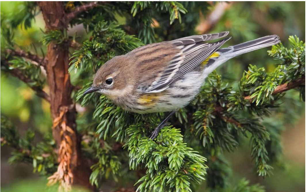
579 Myrtle Warbler / Mirtezanger Setophaga coronata , first-winter male, Corvo, Azores, 20 October 2012 (Vincent Legrand)