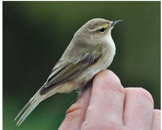
529 Siberian Chiffchaff / Siberische Tjiftjaf Phylloscopus collybita tristis , Wassenaar, Zuid-Holland, 31 October 2009 (Vincent van der Spek/Vrs Meijndel). The bird (same as in plate 528), the very first in the project, was identified as abietinus/tristis by the ringers. Although not prominent, note green feathers on mantle. 530 Siberian Chiffchaff / Siberische Tjiftjaf Phylloscopus collybita tristis , Castricum, Noord-Holland, 28 October 2011 (Luc Knijnsberg). Identified as abietinus by the ringers. Note amount of green on upperparts. 531 Siberian Chiffchaff / Siberische Tjiftjaf Phylloscopus collybita tristis , Castricum, Noord-Holland, 8 October 2010 (Luc Knijnsberg). Identified as abietinus by the ringers. 532 Siberian Chiffchaff / Siberische Tjiftjaf Phylloscopus collybita tristis , Wassenaar, Zuid-Holland, 7 November 2010 (Vincent van der Spek/Vrs Meijndel). The bird had many green feathers on upperparts and yellow feathers on head and, most strikingly, supercilium. Identified as abietinus by the ringers.

other birds representing the three subspecies. This resulted in three very distinct groups of sequences, corresponding to the subspecies collybita , abietinus and tristis (figure 1). The majority of the sequences (n=30) grouped with the tristis sequence types. The remaining sequences (n=11) grouped with the single collybita sequence. So, none of the sampled 41 birds showed a sequence typical of abietinus . In terms of sequence variation, each of the three chiffchaff taxa analysed here showed distinct sequence types. This confirms the previous results from Helbig et al (1996) and Bensch et