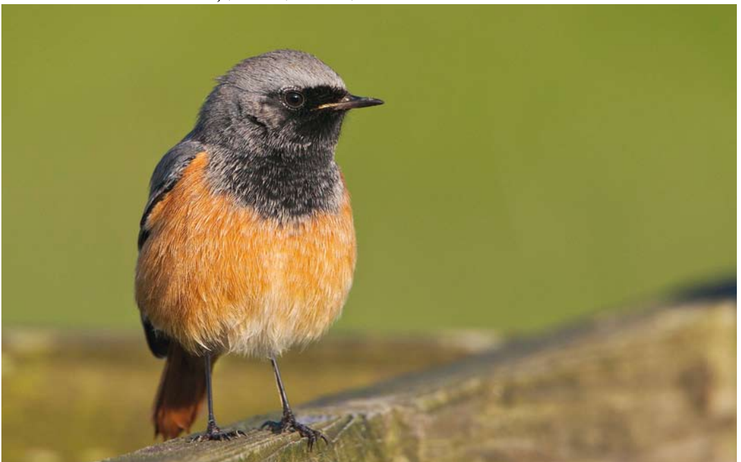
606 Oosterse Zwarte Roodstaart / Eastern Black Redstart Phoenicurus ochruros phoenicuroides , eerstejaars mannetje, Paesens, Friesland, 12 november 2012 ( Rob Olivier )