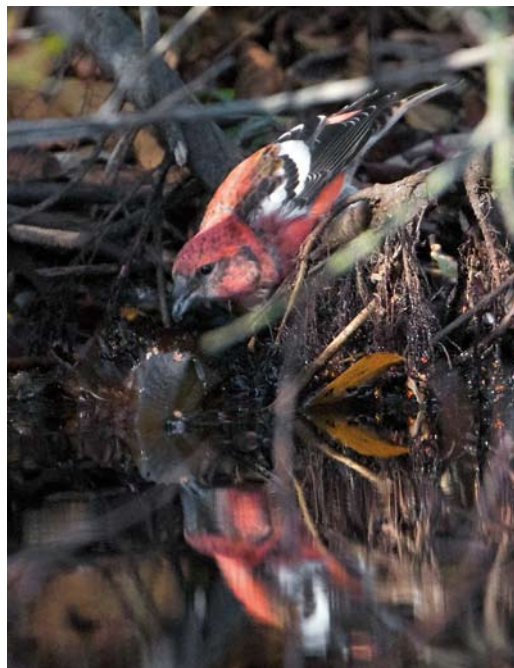
510 Long-tailed Shrike / Langstaartklauwier Lanius schach , first-year, Oude Vuilnisbelt, Den Helder, Noord-Holland, 31 October 2011 ( Jaap Denee ) 511 Two-barred Crossbill / Witbandkruisbek Loxia leucoptera , male, Klaas Douwes, Vlieland, Friesland, 8 October 2011 ( Jaap Denee ) 512 Greater Short-toed Lark / Kortteenleeuwerik Calandrella brachydactyla , Hondsbossche Zeewering, Noord-Holland, 7 May 2011 ( Cock Reijnders )