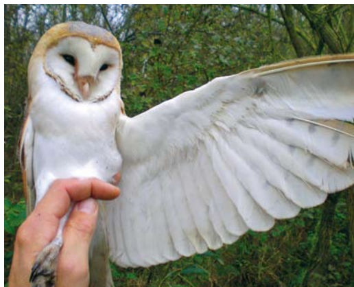
504 Pale Barn Owl / Witte Kerkuil Tyto alba alba , Groene Glop, Schiermonnikoog, Friesland, 9 November 2009

graphed (F Visscher et al; Dutch Birding 33-5, cover, 33: 347, plate 446, 2011).