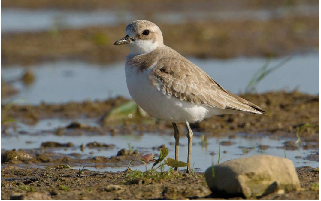
492 Greater Sand Plover / Woestijnplevier Charadrius leschenaultii , adult female, Batenburg, Gelderland, 1 May 2011 (Roland Jansen) 493 Cream-colored Coursers / Renvogels Cursorius cursor (above: collected between IJmuiden and Zandvoort, Noord-Holland, on 18 October 1933; below: first calendar-year, collected at 's-Graveland, Noord-Holland, on c 18 October 1844), Zoölogisch Museum Amsterdam (ZMA), Noord-Holland, January 1996 (Jan van der Laan)