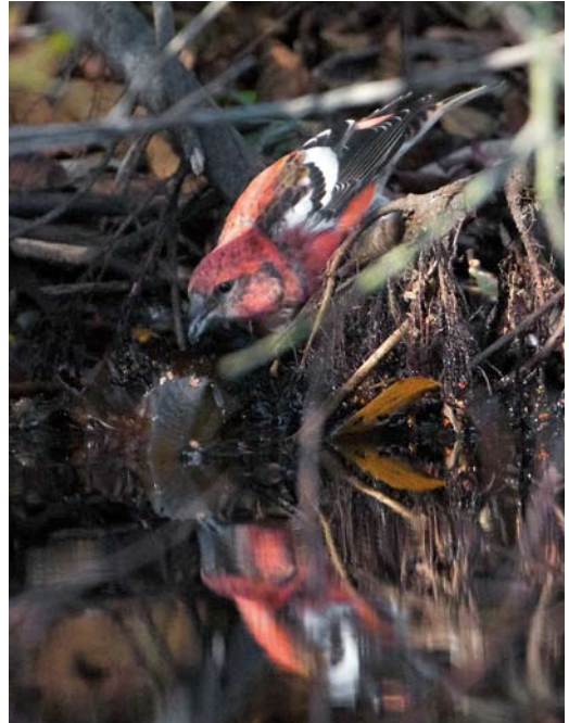
510 Long-tailed Shrike / Langstaartklauwier Lanius schach , first-year, Oude Vuilnisbelt, Den Helder, Noord-Holland, 31 October 2011 ( Jaap Denee ) 511 Two-barred Crossbill / Witbandkruisbek Loxia leucoptera , male, Klaas Douwes, Vlieland, Friesland, 8 October 2011 ( Jaap Denee ) 512 Greater Short-toed Lark / Kortteenleeuwerik Calandrella brachydactyla , Hondsbossche Zeewering, Noord-Holland, 7 May 2011 ( Cock Reijnders )