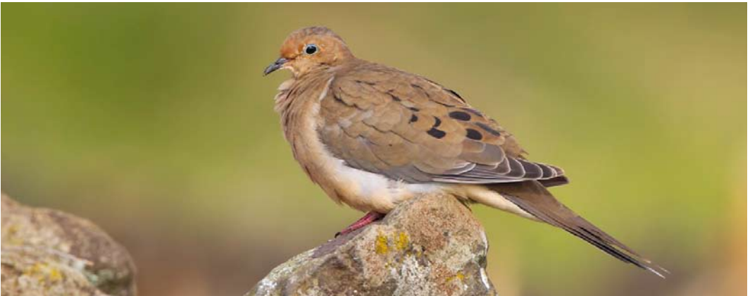
570 American Robin / Roodborstlijster Turdus migratorius , first-year, Corvo, Azores, 17 October 2012 (David Monticelli) 571 Wood Thrush / Amerikaanse Boslijster Hylocichla mustelina , Corvo, Azores, 9 October 2012 (Vincent Legrand) 572 Mourning Dove / Treurduif Zenaidura macroura , Corvo, Azores, 23 October 2012 (David Monticelli)

Several were seen in Spain in October: on Cabrera, Balearic Islands, in Cadíz and in Girona, and three were in Italy. Four reached Portugal: on Berlenga Grande on 20 October; at Roca Cape, Sintra, from 23 October to late November (two); at Praia do Abano, Cascais, on 28 October; and at Foz de Sizandro, Torres Vedras, on 29 October. On Fuerteventura, Canary Islands, four were found on 19 November. Pechora Pipits A. gustavi were present at Norwick, Unst, from 30 September to 2 October; on Fair Isle on 1-2 October; on Ouessant on 5-6 October (third for France); and on Isle of May, Fife, on 16 October. If accepted, one sound-recorded but not seen well enough to decide whether it indeed concerned a pipit in a pine wood on Vlieland on 20-21 October would be the first or second for the Netherlands (another possible one has been sound-recorded at IJmuiden, Noord-Holland, on 24 September 2007). American Buff-bellied Pipits A. rubescens rubescens were found at Loch Smerclate, South Uist, from 21 September to 2 October; at Smerwick Harbour, Kerry, Ireland, from 28