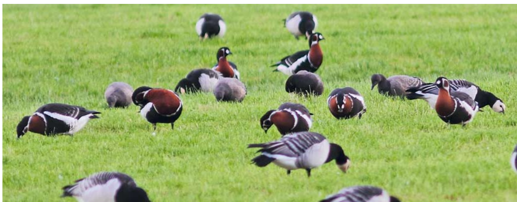
592 Raddes Boszanger / Radde's Warbler Phylloscopus schwarzi , Noordhollands Duinreservaat, Castricum, Noord-Holland, 20 oktober 2012 593 Roodstuitzwaluw / Red-rumped Swallow Cecropis daurica , Robbenjager, Texel, Noord-Holland, 13 oktober 2012 594 Bosgors / Rustic Bunting Emberiza rustica , Kroon's Polders, Vlieland, Friesland, 13 september 2012 595 Dwerggors / Little Bunting Emberiza pusilla , Robbenjager, Texel, Noord-Holland, 16 september 2012 596 Roodhalsganzen / Red-breasted Geese Branta ruficollis , Banckspolder, Schiermonnikoog, Friesland, 27 oktober 2012