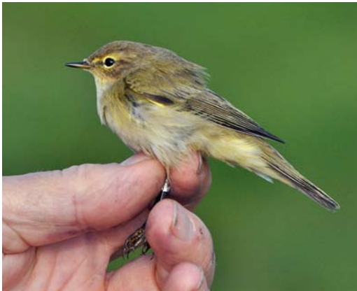
535 Common Chiffchaff / Tjiftjaf Phylloscopus collybita collybita , Wassenaar, Zuid-Holland, 8 October 2010. Identified as collybita/abietinus by the ringers; abietinus was suggested based on its wing length of 67 mm.

in the past many trapped tristis were erroneously identified as abietinus . Clearly, if any morphological criteria were used in the past, they should be considered inconclusive or even erroneous.