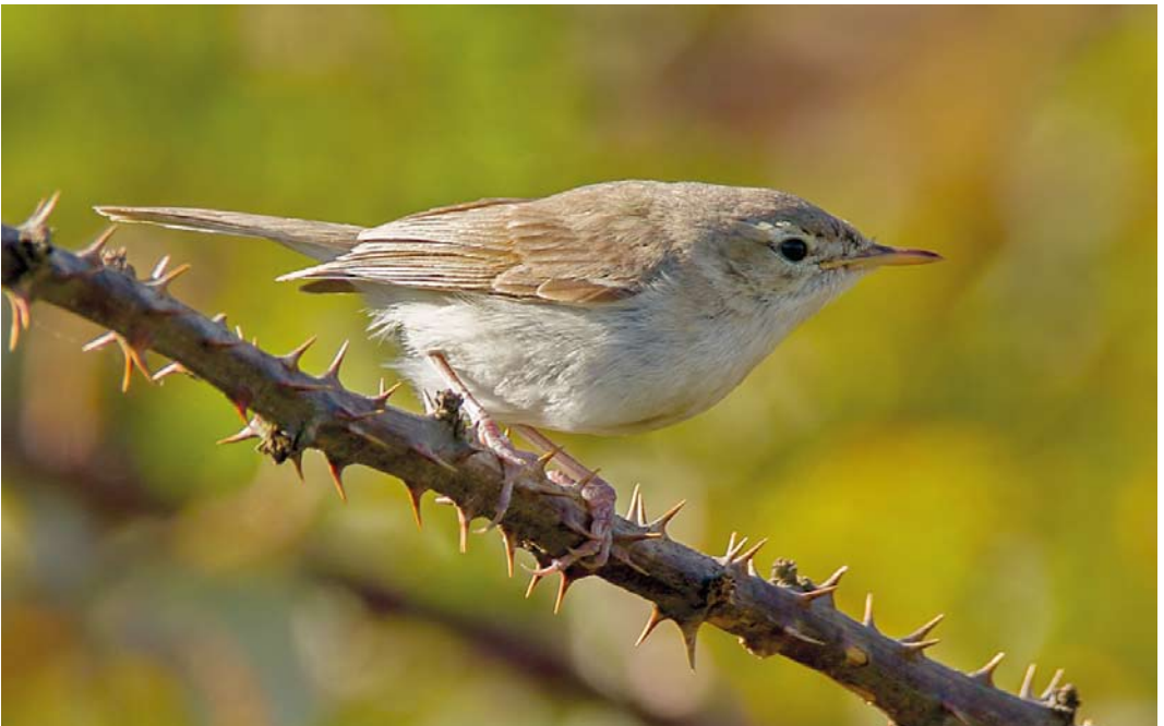
564 Sykes's Warbler / Sykes' Spotvogel Iduna rama , Tresco, Scilly, England, 6 October 2012