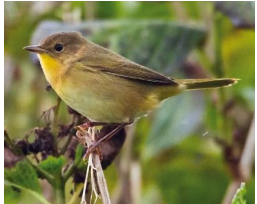
582 Black-and-white Warbler / Bonte Zanger Mniotilta varia , first-year male, Corvo, Azores, 12 October 2012 (Vincent Legrand) 583 American Yellow Warbler / Gele Zanger Setophaga petechia , first-year, Corvo, Azores, 20 October 2012 (David Monticelli) 584 Tennessee Warbler / Tennesseezanger Geothlypis peregrina , Corvo, Azores, 16 October 2012 (Vincent Legrand) 585 Common Yellowthroat / Gewone Maskerzanger Geothlypis trichas , Corvo, Azores, 16 October 2012 (Vincent Legrand)

described by Christie A MacDonald et al in Arctic 65 (3): 344-348, 2012. A first-year female Chestnut-eared Bunting Emberiza fucata first identified as Little Bunting E pusilla at Pool of Virkie, Shetland, on 23-25 October was the second for Scotland and the third for the WP (Birding World 25: 433-436, 2012); the previous two were on Fair Isle on 15-20 October 2004 and in Uppland, Sweden, on 25 October 2011. In Shetland, a first-winter Bobolink Dolichonyx oryzivorus was photographed at Brake, Mainland, on 28 October. Blackpoll Warblers Setophaga striata stayed on Inishmore on 7 October; in Scilly on Bryher on 11-18 October and on St Mary's on 28-29 October; and at Blacksod, The Mullet, Mayo, on 9 November. In Ireland, Myrtle Warblers S coronata were seen on Dursey Island, Cork, on 3-6 October and (two) on Inishmore on 6 October and, in Iceland, one turned up at Hafnarfjörður on 11 November.