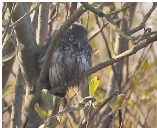
505 Eurasian Pygmy Owl / Dwerguil Glaucidium passerinum , Robbenjager, Texel, Noord-Holland, 14 October 2011 (Frank Blankers)

The bird was photographed at one of the best-searched areas on the northern tip of Texel. However, after the news was released, it could not be relocated, despite extensive searching.