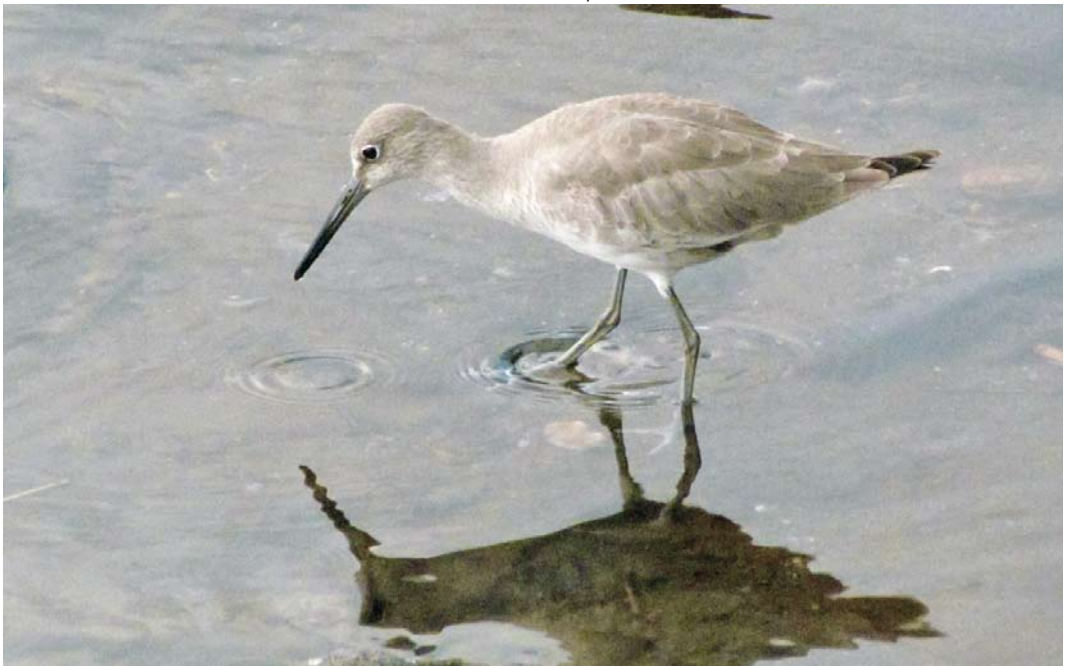
538 Willet / Willet Tringa semipalmata , Villa Franco do Campo, São Miguel, Azores, 18 October 2012