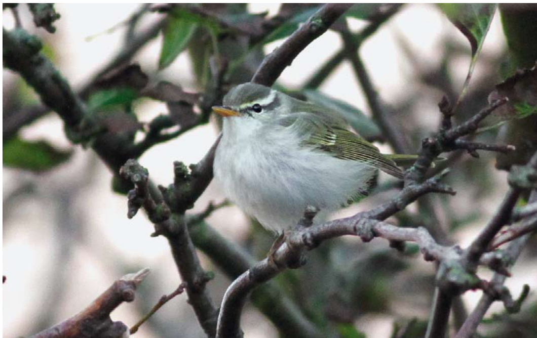
563 Eastern Crowned Warbler / Kroonboszanger Phylloscopus coronatus , Helgoland, Schleswig-Holstein, Germany, 16 October 2012 ( Jochen Dierschke )