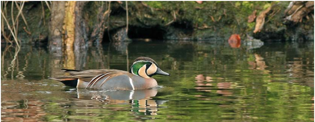
484 Baikal Teal / Siberische Taling Anas formosa , adult male, Gravenbos, Almelo, Overijssel, 14 March 2010

2010 29 January to 24 February and 14 March to 23 April, Gravenbos, Almelo, Overijssel, adult male, photographed (G Mensink, M Zekhuis et al; Dutch Birding 32: 180, plate 143, 2010).