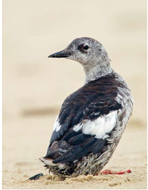
589 Zwarte Ooievaar / Black Stork Ciconia nigra , juveniel, Oudeschild, Texel, Noord-Holland, 1 november 2012 590 Zwarte Zeekoet / Black Guillemot Cepphus grylle , tweede-winter, IJzeren Kaap, Texel, Noord-Holland, 30 september 2012 591 Zwarte Ibis / Glossy Ibis Plegadis falcinellus , adult winter, Banckspolder, Schiermonnikoog, Friesland, 27 oktober 2012