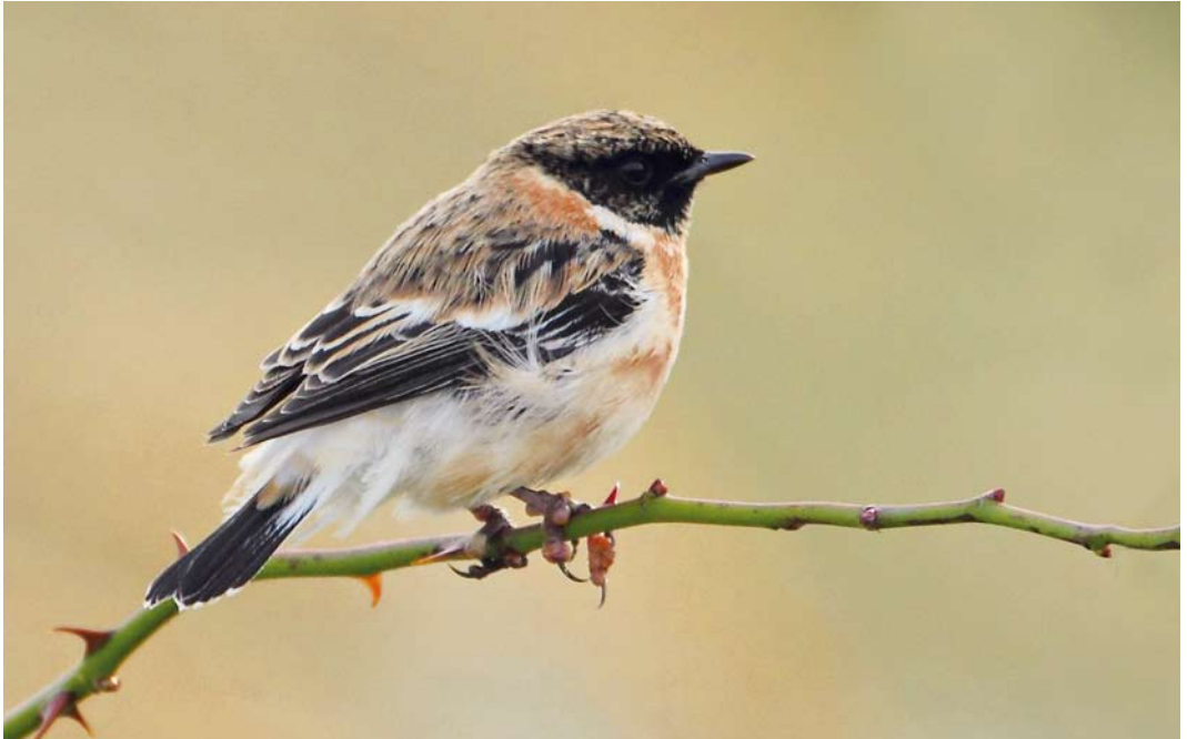
527 Kaspische Roodborsttapuit / Caspian Stonechat Saxicola maurus variegatus , adult mannetje, Vlieland, Friesland, 8 oktober 2012

Europa is variegatus 11 keer vastgesteld, met negen gevallen op Cyprus, één geval in Griekenland en één in Italië, alle in december-april (Slack 2009). Opvallend is dat van de negen gevallen in Noordwest-Europa er zes in het voorjaar waren, terwijl nominaat maurus juist veel vaker in het najaar wordt waargenomen. Ter illustratie: van de 38 als maurus aanvaarde gevallen van Aziatische Roodborsttapuit in Nederland zijn er slechts twee in het voorjaar, een beeld dat overeenkomt met de ons omringende landen (Slack 2009; www.dutchavifauna.nl). Mogelijk is dit een vertekend beeld omdat maurus in het voorjaar vaak lastiger te onderscheiden is van Roodborsttapuit terwijl door het afwijkende staartpatroon variegatus het hele jaar goed is te onderscheiden van Roodborsttapuit.