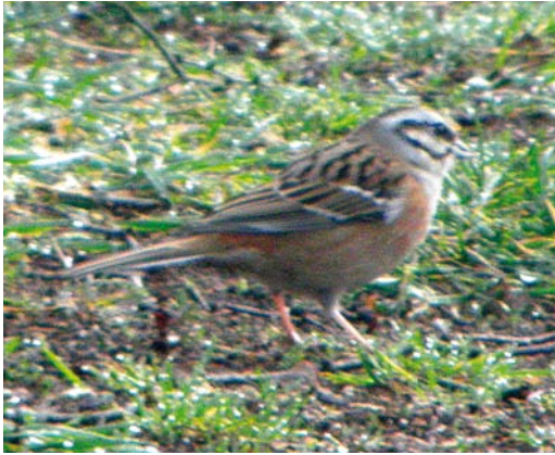
519 Rock Bunting / Grijze Gors Emberiza cia , first-summer male, Schiermonnikoog-Dorp, Schiermonnikoog, Friesland, 3 April 2011