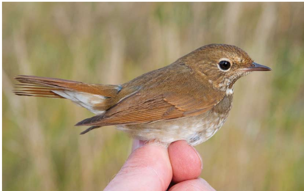
553 Rufous-tailed Robin / Snornachtegal Larivora sibilans , first-year, Christiansø, Bornholm, Denmark, 14 October 2012 ( Jens Mikkel Lausten )