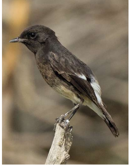
546 Northern Hawk-Owl / Sperweruil Surnia ulula , first-year, Store Hareskov, Sjælland, Denmark, 6 October 2012 547 Pied Bushchat / Zwarte Roodborsttapuit Saxicola caprata , first-year male, Yeroham, Negev, Israel, 18 October 2012 548 Lesser Spotted Woodpecker / Kleine Bonte Specht Dendrocopos minor , female, Scalloway, Mainland, Shetland, Scotland, 16 October 2012