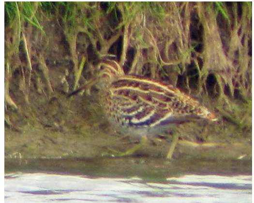
494 Caspian Plover / Kaspische Plevier Charadrius asiaticus , adult male, De Nederlanden, Texel, Noord-Holland, 27 April 2011 495 Sociable Lapwing / Steppekievit Vanellus gregarius , Ezumakeeg, Friesland, 27 March 2011 496 Pacific Golden Plover / Aziatische Goudplevier Pluvialis fulva , Wissenkerke, Zeeland, 9 July 2011 497 Great Snipe / Poelsnip Gallinago media , adult, Polder Sandelingen, Hendrik-Ido-Ambacht, Zuid-Holland, 18 May 2011

ones in 2011 were the first since 2007. With six records in one year, 2011 was a record year, surpassing 1992 (five).