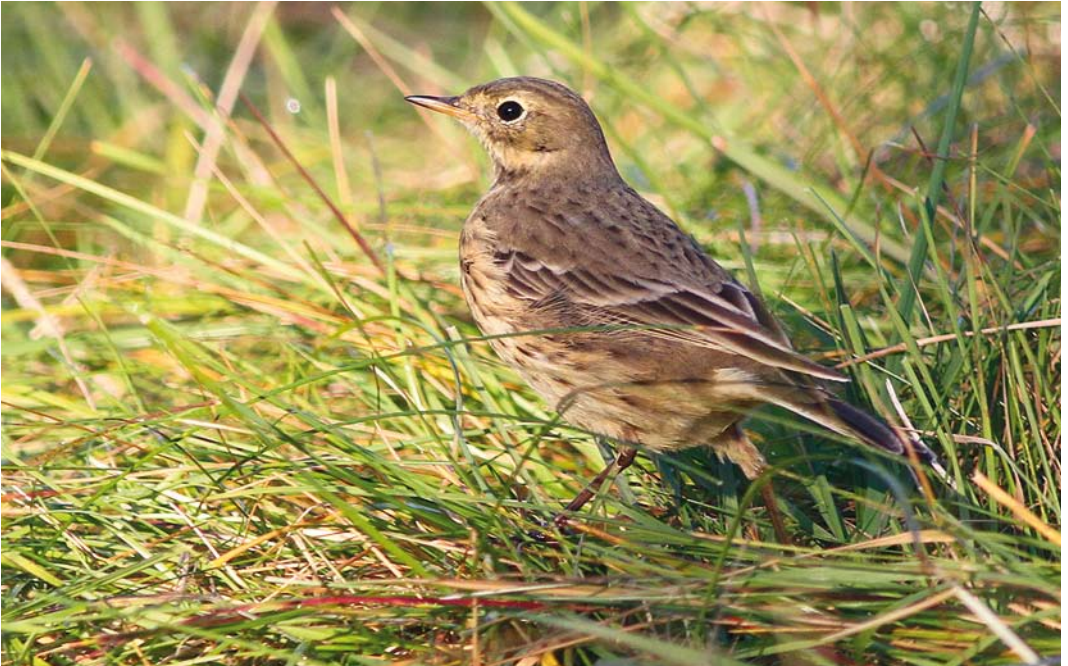
565 American Buff-bellied Pipit / Amerikaanse Waterpieper Anthus rubescens rubescens , Öygarden, Hordaland, Norway, 12 October 2012 (Julian Bell)