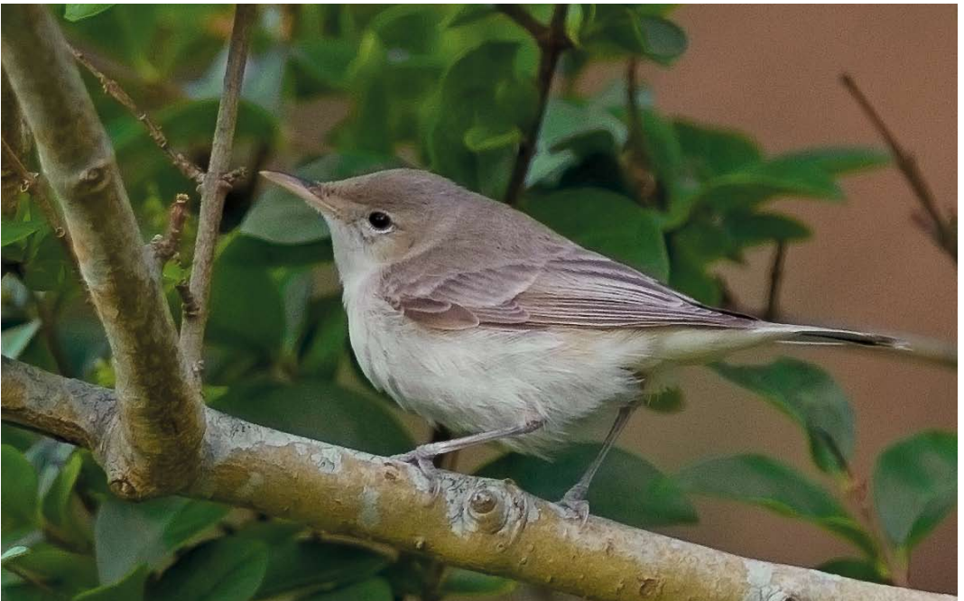
566 Eastern Olivaceous Warbler / Oostelijke Vale Spotvogel Iduna pallida , first-year, Utsira, Rogaland, Norway, 1 October 2012