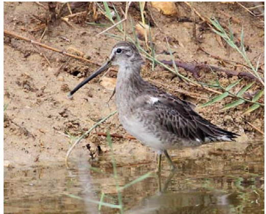
542 Greater Sand Plover / Woestijnplevier Charadrius leschenaultii , first-winter, Dunkerque, Nord, France, October 2012 ( Edouard Dansette ) 543 Solitary Sandpiper / Amerikaanse Bosruiter Tringa solitaria , juvenile, Bryher, Scilly, England, 13 October 2012 ( Michael Schmitz ) 544 Short-billed Dowitcher / Kleine Grijze Snip Limnodromus griseus , juvenile, Le Crotoy, Somme, France, 24 October 2012 ( Edouard Dansette ) 545 Long-billed Dowitcher / Grote Grijze Snip Limnodromus scolopaceus , first-winter, Simar Nature Reserve, Malta, 18 October 2012 ( Raymond Galea )

JAEGERS TO SKIMMERS Adult Bonaparte's Gulls Chroicocephalus philadelphia stayed at Larne, Antrim, Northern Ireland, through October-November; at Strumble Head, Pembrokeshire, Wales, on 16-20 October; at Sunderland, Durham, England, on 27 October; at Dawlish Warren, Devon, England, from 21 October to at least 19 November; and at Boddington Reservoir, Northamptonshire, England, from 1 November. An adult Franklin's Gull Larus pipixcan associated with a marked influx of up to 4200 Brown-headed Gulls L brunnicapillus (and c 200 Slender-billed Gulls L genei ) at Morjim beach, Chapora mouth, Goa, from 14 November onwards was the first for India and South Asia. In Poland, 2012 has become one of the best years for Pallas's Gull L ichthyaeetus with 10 immatures and two adults between 19 May and 28 October (in 2008, 14 individuals were recorded); in October, two were seen in Germany. The first