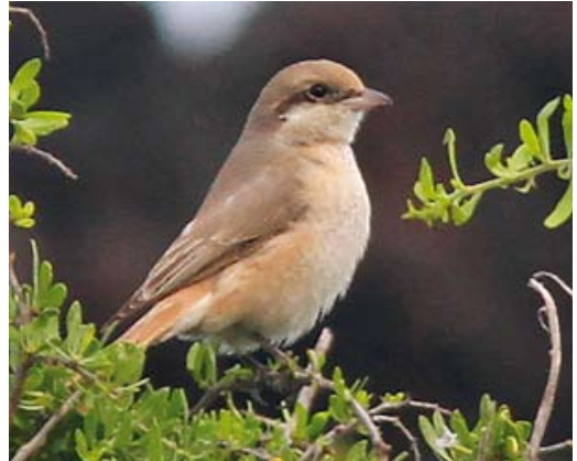
555 Trumpeter Finch / Woestijnvink Bucanetes githagineus , Linosa, Italy, 30 October 2012 (Michele Viganò) 556 Rustic Bunting / Bosgors Emberiza rustica , Linosa, Italy, 3 November 2012 (Igor Maiorano) 557 Olive-backed Pipit / Siberische Boompieper Anthus hodgsoni , Linosa, Italy, 11 November 2012 (Igor Maiorano) 558 Daurian Shrike / Daurische Klauwier Lanius isabellinus , adult female, Linosa, Italy, 2 November 2012 (Igor Maiorano)

Isle, Shetland, on 3 October (trapped) and at Marsden Quarry, Dunham, England, on 12 October. Several Lanceolated Warblers L lanceolata were found on Fair Isle between 2 and 22 October, while others were discovered at Long Nab, Burniston, North Yorkshire, England, on 12 October and on North Ronaldsay, Orkney, Scotland, on 17 October. In Norway, Sykes's Warblers Iduna rama stayed at Træna, Nordland, on 24-25 September and on Skomvær, Røst, Røstlandet, on 28 September. Others were present at Söderskär, Porvoo, on 3-4 October (second for Finland) and on Tresco, Scilly, on 5-6 October (15th for Britain). An Eastern Olivaceous Warbler I pallida at Kilminning, Fife, from 14 October until 20 November was the ninth for Scotland and c 18th for Britain. The second for Utsira (and sixth for Norway) was trapped on 1 November. The fourth Paddyfield Warbler Acrocephalus agricola for Cornwall (and c 85th for Britain) was watched at Church Cove on 8-13 October. A record 18 Blyth's Reed