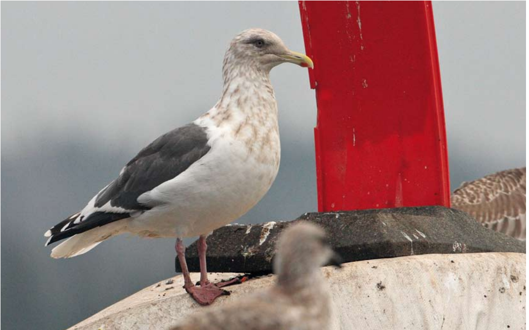
537 Slaty-backed Gull / Kamtsjatkameeuw Larus schistisagus , adult, Kikkonummi, Helsinki, Finland, 3 November 2012 (Petteri Hytönen)