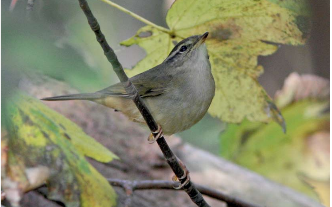
513 Radde's Warbler / Raddes Boszanger Phyllsocolopus schwarzi , Nieuwe Kooi, Vlieland, Friesland, 22 October 2011 514 Red-flanked Bluetail / Blauwstaart Tarsiger cyanurus , adult female, Noordhollands Duinreservaat, Castricum, Noord-Holland, 15 October 2011 515 Siberian Stonechat / Aziatische Roodborsttapuit Saxicola maurus , De Cocksdorp, Texel, Noord-Holland, 26 October 2011