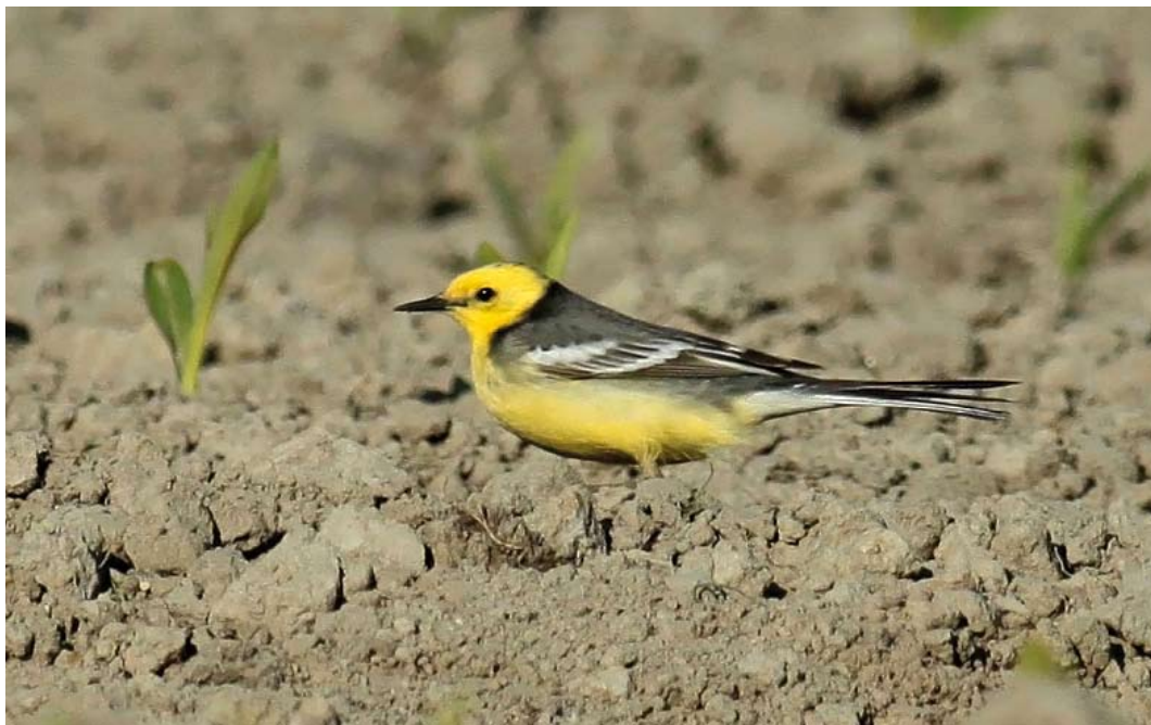
516 Citrine Wagtail / Citroenkwikstaart Motacilla citreola , second calendar-year male, Dijkgatsweide, Wieringermeer, Noord-Holland, 2 May 2011