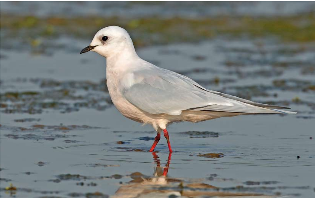
503 Ross's Gull / Ross' Meeuw Rhodostethia rosea , adult winter, Numansdorp, Zuid-Holland, 24 April 2011 (Filip De Ruwe)