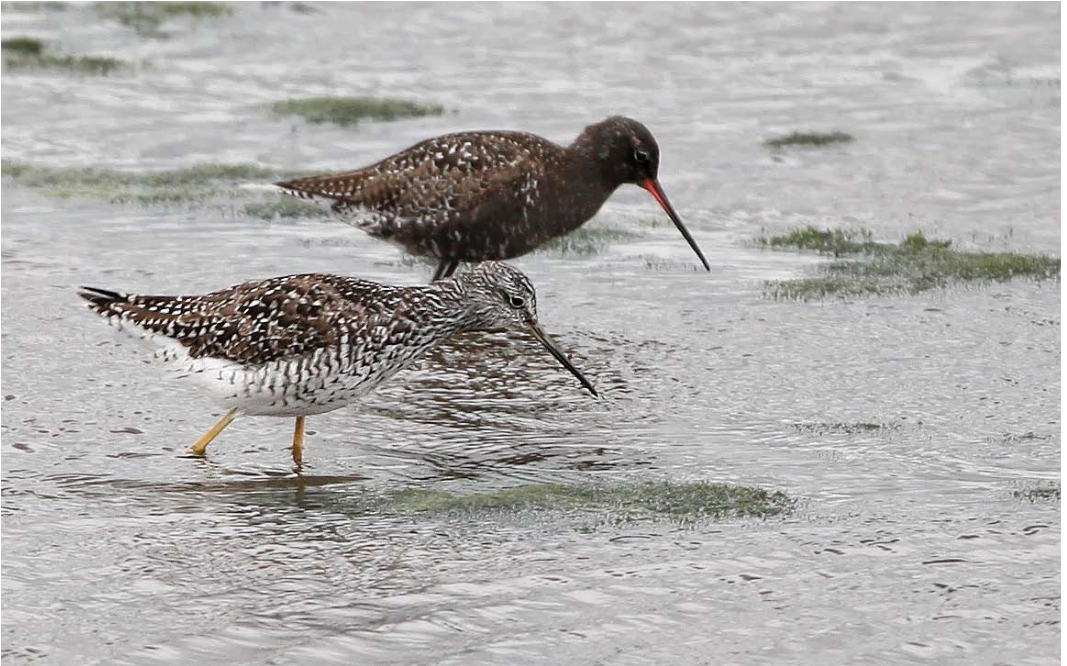
502 Greater Yellowlegs / Grote Geelpootruiter Tringa melanoleuca , with Spotted Redshank / Zwarte Ruiter T erythropus , Bokkegat, Noord-Beveland, Zeeland, 19 June 2011 (Kris De Rouck)