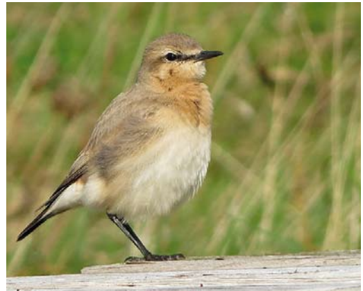
559 White-throated Needletail / Stekelstaartgierzwaluw Hirundapus caudacutus , Rømø, Tønder, Denmark, 21 October 2012 ( Ole Zoltan Göller ) 560 Bobolink / Bobolink Dolichonyx oryzivorus , first-year, Shetland, Scotland, 28 October 2012 ( Hugh Harrop ) 561 Rufous Turtle Dove / Meenatortel Streptopelia orientalis meena , first-year, Wabern, Hessen, Germany, 30 October 2012 ( Tobias Epple ) 562 Isabelline Wheatear / Izabeltapuit Oenanthe isabellina , Spiekerooog, Niedersachsen, Germany, 19 October 2012 ( Tobias Epple )

THRUSHES White's Thrushes Zoothera aurea were found at Cot Valley, Cornwall, England, on 8 October; on Ouessant (two or three) on 11-20 October; at Brevig, Barra, Outer Hebrides, on 13 October (trapped); and at Mølen, Vestfold, on 20 October. Also on Barra, a Swainson's Thrush Catharus ustulatus from 2 October was trapped on 4 October; the first for Denmark was trapped on Christiansø, Bornholm, on 21 October and seen on 24-30 October. A Grey-cheeked Thrush C. minimus stayed on St Agnes, Scilly, on 6-8 October. Eyebrowed Thrushes Turdus obscurus turned up on Foula, Shetland, on 13 October and at Pori, Finland, on 15 October. The second Naumann's Thrush T. naumanni for Ukraine was a first-winter trapped at Lviv on 6 October; the first for Estonia stayed at Kihnu Pärnumaa from 17 November. Black-throated Thrushes T. atrogularis were seen, eg, on Fair Isle on 6 October; on Helgoland on 10-16 October; at Hanko, Finland, on 27 October; at