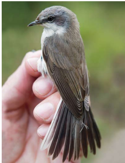
597 Bruine Boszanger / Dusky Warbler Phylloscopus fuscatus , Noordhollands Duinreservaat, Castricum, Noord-Holland, 27 oktober 2012 598 Siberische Braamsluiper / Blyth's Lesser Whitethroat Sylvia curruca blythi , eerstejaars, Kennemerduinen, Bloemendaal, Noord-Holland, 20 oktober 2012 599 Kleine Vliegenvanger / Red-breasted Flycatcher Ficedula parva , eerstejaars, De Cocksdorp, Texel, Noord-Holland, 7 oktober 2012