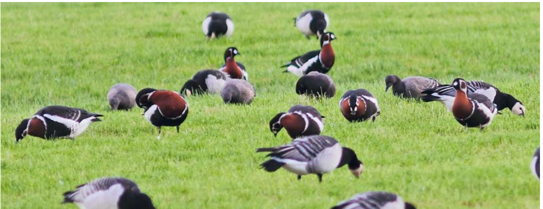
592 Raddes Boszanger / Radde's Warbler Phylloscopus schwarzi , Noordhollands Duinreservaat, Castricum, Noord-Holland, 20 oktober 2012 ( Arnold Wijker ) 593 Roodstuitzwaluw / Red-rumped Swallow Cecropis daurica , Robbenjager, Texel, Noord-Holland, 13 oktober 2012 ( Arnoud B van den Berg ) 594 Bosgors / Rustic Bunting Emberiza rustica , Kroon's Polders, Vlieland, Friesland, 13 september 2012 ( Nils van Duivendijk ) 595 Dwerggors / Little Bunting Emberiza pusilla , Robbenjager, Texel, Noord-Holland, 16 september 2012 ( Toy Janssen ) 596 Roodhalsganzen / Red-breasted Geese Branta ruficollis , Banckspolder, Schiermonnikoog, Friesland, 27 oktober 2012 ( Marc Dijksterhuis )