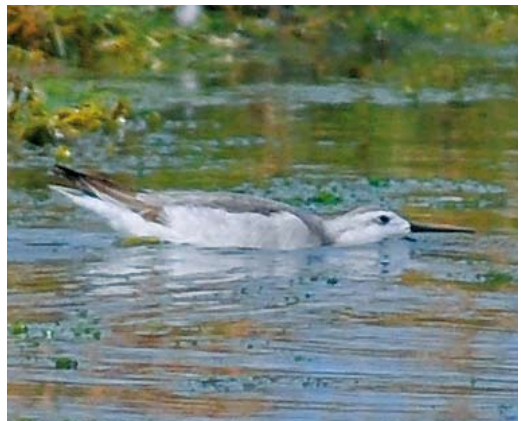
498 Semipalmated Sandpiper / Grijze Strandloper Calidris pusilla , adult, Westpolder, Groningen, 20 May 2011 499 Red-necked Stint / Roodkeelstrandloper Calidris ruficollis , adult, Utopia, Texel, Noord-Holland, 19 July 2011 500 Spotted Sandpiper / Amerikaanse Oeverloper Actitis macularius , adult, Hogerwaardpolder, Zeeland, 31 July 2011 501 Wilson's Phalarope / Grote Franjepoot Phalaropus tricolor , first-year, Wagejot, Texel, Noord-Holland, 28 August 2011