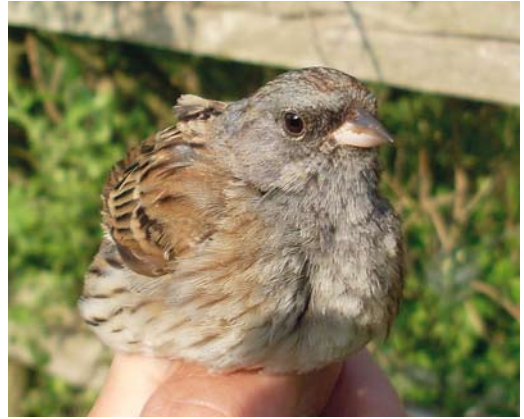
520 Black-faced Bunting / Maskergors Emberiza spodocephala , adult male, Zwanenwater, Noord-Holland, 7 May 2011

F J Koning; van Ee & Spannenburg 2011; Birding World 24: 192, 2011, Dutch Birding 33: 221, plate 270, 280, plate 362, 2011).