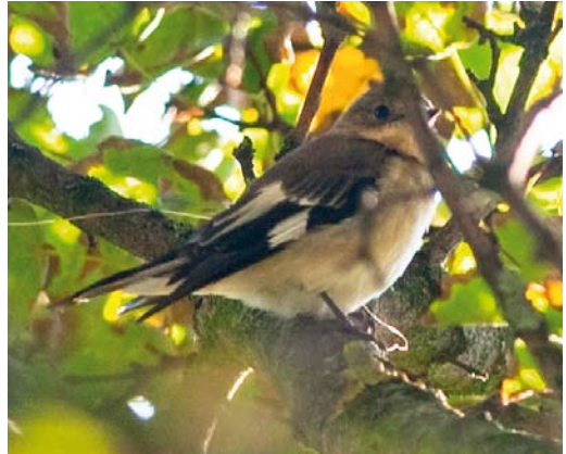
506 Blue-cheeked Bee-eater / Groene Bijeneter Merops persicus , Slikken van Flakkee, Zuid-Holland, 22 July 2011 507 River Warbler / Krekelzanger Locustella fluviatilis , Noordhollands Duinreservaat, Castricum, Noord-Holland, 21 August 2011 508 Greater Short-toed Lark / Kortteenleeuwerik Calandrella brachydactyla , Kennemermeer, IJmuiden, Noord-Holland, 15 May 2011 509 Collared Flycatcher / Withalsvliegenvanger Ficedula albicollis , adult male, Katwijk aan Zee, Zuid-Holland, 10 October 2010

den, Velsen, Noord-Holland, photographed, sound-recorded (R Slaterus et al); 2-4 November, Rijswijk, Rijswijk , Zuid-Holland, photographed, sound-recorded (M Zevenbergen, S Gobin et al); 5 November, Ouddorp, Goedereede , Zuid-Holland, photographed, sound-recorded (GTanis, N de Schipper, I Meulmeester et al); 9 November, Meijndel, Wassenaar , Zuid-Holland, sound-recorded (A Remeeus, V van der Spek, R van der Vliet et al); 13 November, West-Terschelling, Terschelling , Friesland, sound-recorded (H Schekkerman, M Feenstra, A Ouwkerk); 13-14 November, Maasvlakte, Rotterdam , Zuid-Holland, photographed (B Brieffies et al); Dutch Birding 34: 72, plate 99, 2012). 2010 26 October, Groene Glop, Schiermonnikoog , Friesland, ringed, photographed (K H Oosterbeek, S Deuzeman); 7 November, Noordhollands Duinreservaat, Castricum , Noord-Holland, ringed, photographed (A Wijker,