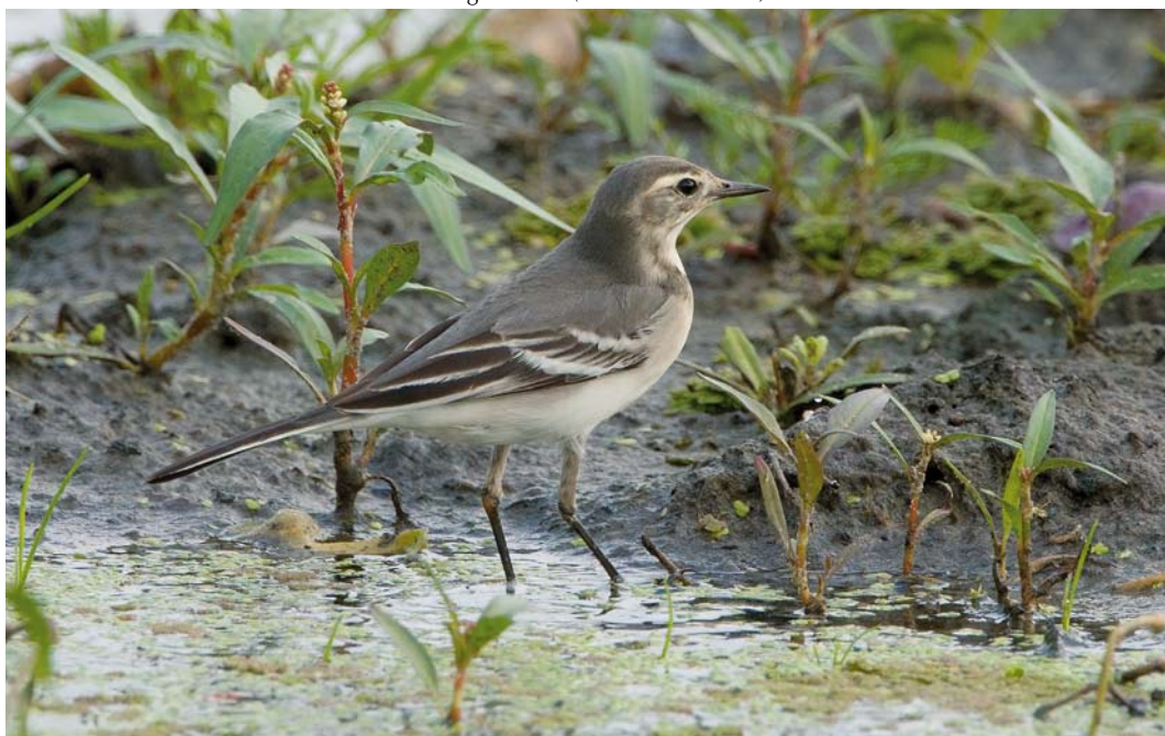
517 Citrine Wagtail / Citroenkwikstaart Motacilla citreola , first-year, Polder R, Petten, Noord-Holland, 25 August 2011 (Co van der Wardt)