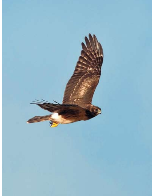
539 Black Skimmer / Amerikaanse Schaarbek Rynchops niger , adult, Rietvlei, Cape Town, South Africa, 5 October 2012 ( Callan Cohen ) 540 Northern Harrier / Amerikaanse Blauwe Kiekendief Circus hudsonius , juvenile female, Tacumshin, Wexford, Ireland, 31 October 2012 ( Killian Mullarney ) 541 Little Bustard / Kleine Trap Tetrax tetrax , Wedeler Marsch, Schleswig-Holstein, Germany, 1 October 2012 ( Eckhard Möller )