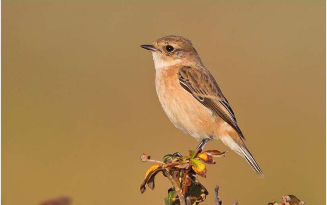
604 Stejnegers Roodborsttapuit / Stejneger's Stonechat Saxicola maurus stejnegeri , eerstejaars mannetje, Robbenjager, Texel, Noord-Holland, 10 oktober 2012

vogels zag, op basis van kleedkenmerken zeker een ander exemplaar. Vooral tijdens het Dutch Birding-vogelweekend op 13-14 oktober trok de vogel veel bekijks en tijdens zijn lange verblijf werd hij door minstens 300 vogelaars gezien. In die tijd las ik met interesse een bijdrage op Birding Frontiers ( www.birdingfrontiers.com ) over een Aziatische Roodborsttapuit op Shetland, waarbij het vraagstuk werd aangekaart of en hoe een Stejnegers Roodborsttapuit S m stejnegeri (hierna stejnegeri ) in Europa van een nominaat maurus kon worden onderscheiden. De Texel-vogel leek donker genoeg voor een stejnegeri maar er waren volgens mij onvoldoende handvatten bekend om dit taxon in het veld te determineren.