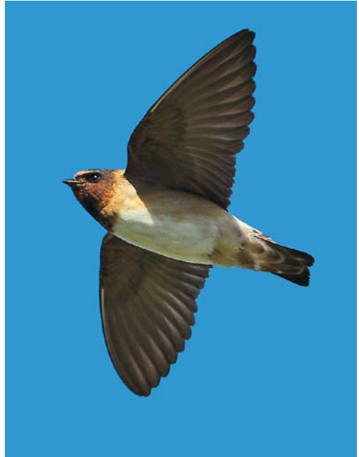
549-550 American Cliff Swallow / Amerikaanse Klifzwaluw Petrochelidon pyrrhonota , first-year, Ouessant, Finistère, France, 4 October 2012 ( Aurélien Audevard ) 551 American Cliff Swallow / Amerikaanse Klifzwaluw Petrochelidon pyrrhonota , adult, Gårdby hamn, Öland, Sweden, 19 November 2012 ( Mats Wallin ) 552 Eastern Kingbird / Koningstiran Tyrannus tyrannus , Inishmore, Galway, Ireland, first-year, 5 October 2012 ( Dermot Breen )