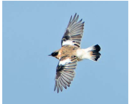
521 Kaspische Roodborsttapuit / Caspian Stonechat Saxicola maurus variegatus , adult mannetje, Vlieland, Friesland, 6 oktober 2012 ( Cock Reijnders ) 522 Kaspische Roodborsttapuit / Caspian Stonechat Saxicola maurus variegatus , adult mannetje, Vlieland, Friesland, 6 oktober 2012 ( Laurens B Steijn ). Let op grote hoeveelheid wit op binnenvlag van t3-6 / note large white area on inner web of t3-6. 523 Kaspische Roodborsttapuit / Caspian Stonechat Saxicola maurus variegatus , adult mannetje, Vlieland, Friesland, 6 oktober 2012 ( Arnoud B van den Berg ). Let op roze poten en wratten op tenen / note pink coloured legs and wart-like growths on toes. 524 Kaspische Roodborsttapuit / Caspian Stonechat Saxicola maurus variegatus , adult mannetje, Vlieland, Friesland, 6 oktober 2012 ( Han Zevenhuizen ). Let op grote witte veld op binnenste dekveren en rui van buitenste armpennen / note large white panel on inner coverts and moult of outer secondaries.

catief voor groeiende veren; binnenste twee armpennen ontbrekend.