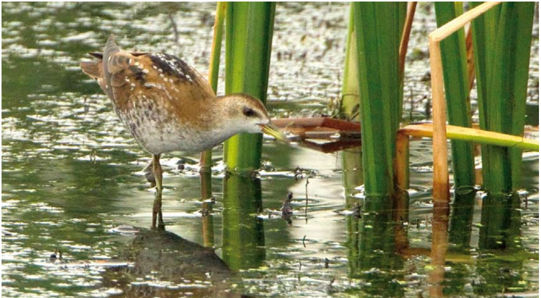
491 Little Crake / Klein Waterhoen Porzana parva , juvenile, Lepelaarplassen, Almere, Flevoland, 11 September 2011

30-31 March, Strabrechtse Heide, Heeze-Leende , Noord-Brabant, adult male, photographed (M van Oss et al; Dutch Birding 33: 216, plate 258, 2011); 7 April, Kamperhoek, Dronten , Flevoland, adult male, photographed (M Roos; Dutch Birding 33: 216, plate 259, 2011); 19 April, Tuintjes, De Cocksdorp, Texel , Noord-Holland, second calendar-year, photographed (R Halff, F Geldermans); 23 April, Tuintjes, De Cocksdorp, Texel , Noord-Holland, second calendar-year male, photographed (N van Houtum, H Verdaat, J van den Berg et al); 23 April, Kamperhoek, Dronten , Flevoland, second calendar-year, photographed (H Zevenhuizen, N van Duivendijk); 24 April, Broeklanden, Hardenberg , Overijssel, second calendar-year, photographed (B Stegeman); 29-30 April, Anjumer en Liessenserpolder, Dongeradeel , Fries-