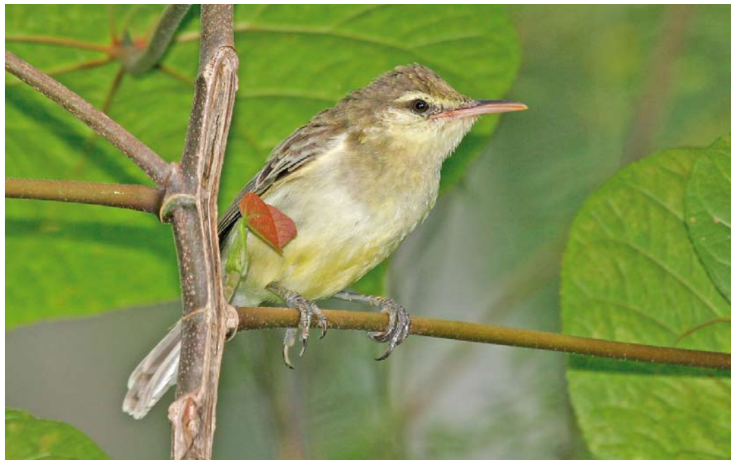
307 Northern Marquesan Reed Warbler / Noordelijke Markiezenkarekiet Acrocephalus percernis idae , Botanique Communal de Vaipae, Ua Huka, Marquesas Islands, French Polynesia, 16 September 2006

for the havoc that rats can wreck on island bird species (Thibault & Meyer 2001). Historically, as many as eight species were known from French Polynesia (Cibois et al 2004) but today only four remain, all single-island endemics. Two of them are hanging by a thread, Tahiti Monarch on Tahiti and Fatuhiva Monarch P. whitneyi on Fatu Hiva respectively, while Mohotani Monarch P. (mendozae) motanensis cannot be visited by the independent traveller as it occurs on uninhabited Mohotani in the Marquesas. The fourth species, Iphis Monarch P. iphis has some sort of thriving population on one Marquesan island only, namely Ua Huka, only because this island is free of Black Rats (see above under Ultramarine Lorikeet).