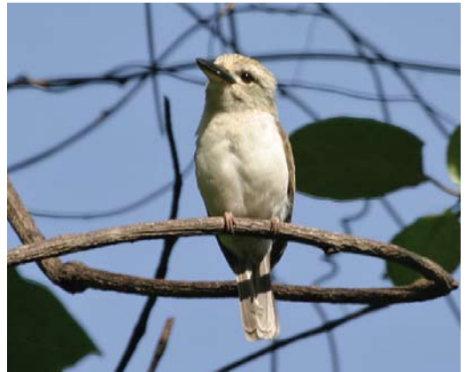
296 Marquesan Swiftlet / Markiezensalangaan Aerodramus ocistus , Ua Huka, Marquesas Islands, French Polynesia, 8 November 2008 (Tom Ghestemme) 297 Fatuhiva Monarch / Fatuhivamonarch Pomarea whitneyi , Fatu Hiva, Marquesas Islands, French Polynesia, 14 August 2012 (Tom Ghestemme) 298 Marquesan Kingfisher / Markiezenijsvogel Todiramphus godeffroyi , Tahuata, Marquesas Islands, French Polynesia, 10 December 2012 (Tom Ghestemme) 299 Moorea Kingfisher / Mooreaijvogel Todiramphus veneratus youngi , Moorea, Society Islands, French Polynesia, 1 January 2009 (Tom Ghestemme)

species occur more widespread, their original distribution being augmented by accidental or deliberate introductions. Blue Lorikeet V. peruviana is most easily seen at the Blue Lagoon at Rangiroa in the Tuamotus, while the French Polynesian emblematic bird species Kuhl's Lorikeet V. kuhlii occurs commonly at Rimatara in the Austral Islands. It has been introduced to the Line Islands and more recently to Atiu, Cook Islands, to secure its future.