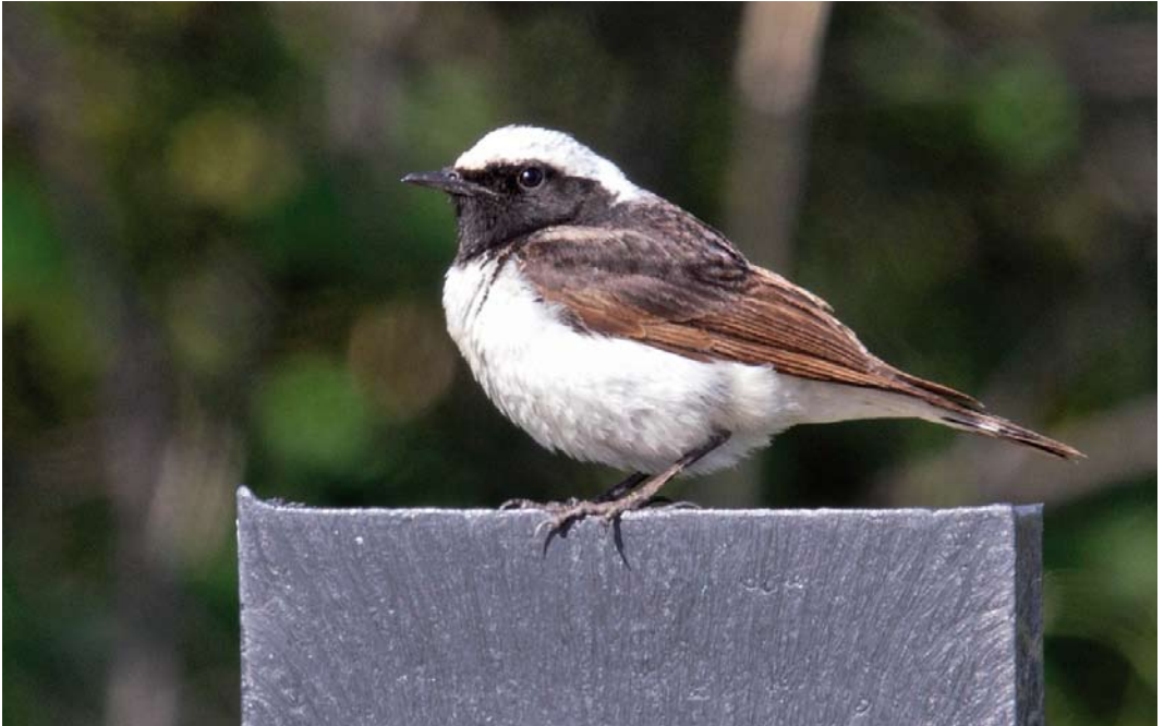
368 Bonte Tapuit / Pied Wheatear Oenanthe pleschanka , eerste-zomer mannetje, Meijndel, Zuid-Holland, 4 juni 2013 ( René van Rossum )