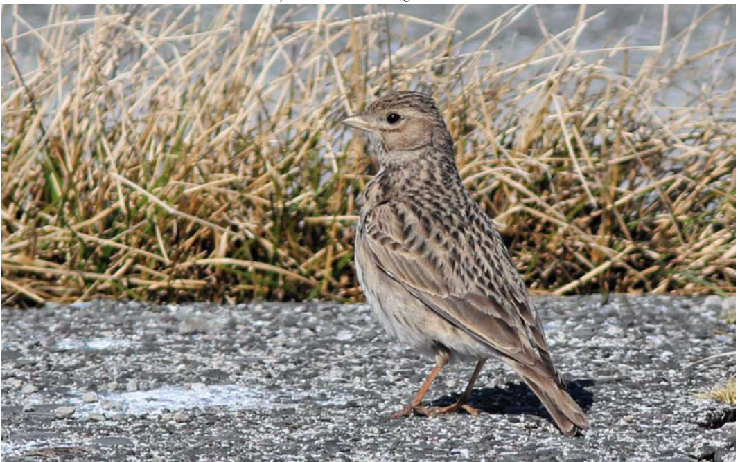
343 Lesser Short-toed Lark / Kleine Kortteenleeuwerik Calandrella rufescens , Hornøya, Finnmark, Norway, 30 May 2013