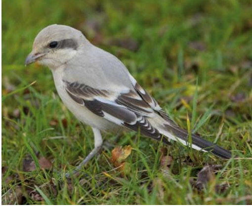
285 Steppeklapekster / Steppe Grey Shrike Lanius lahtora pallidirostris , Grainthorpe Haven, Lincolnshire, Engeland, 15 november 2008