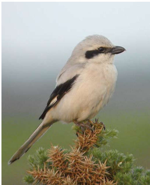
283 Steppeklapekster / Steppe Grey Shrike Lanius lahtora pallidirostris , Isle of Man, Brittannië, 17 juni 2003

juli-augustus 2011 (een exemplaar op Isle of Man, Brittannië, vanaf 17 juni 2003 bleef tot 12 juli). Bij vrijwel alle Europese gevallen betrof het eerstejaars vogels (in tegenstelling tot andere zeldzame Centraal-Aziatische klauwieren zoals Daurische Klauwier L. isabellinus en Turkestaanse Klauwier L. phoenicuroides die regelmatig in adult kleeed in West-Europa worden gezien). Er zit een stijgende lijn in het voorkomen in Europa, met zes gevallen in 1980-89, 20 in 1990-99 en 31 in 2000-09. Een belangrijke verklaring is de toegenomen veldkennis van een groeiend aantal vogelaars maar een werkelijke toename (bijvoorbeeld door een westwaartse uitbreiding van het verspreidingsgebied) is niet uitgesloten. Ook de soortstatus die pallidirostris heeft gekregen (als zelfstandige soort of ondersoort van Aziatische Klapekster) heeft ongetwijfeld bijgedragen aan een verhoogde opmerkzaamheid bij waarnemers in Europa.