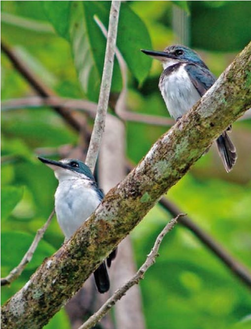
303 Tahiti Kingfishers / Tahitiijsvogels Todiramphus veneratus veneratus , male (left) and female, Tahiti, Society Islands, French Polynesia, 18 September 2006

The taxonomy of Polynesian Todiramphus kingfishers is a bit messy. We follow Dickinson & Renssen (2013) here but other arrangements are possible (eg, Fry et al 1992). In French Polynesia, five different taxa can be encountered. Two species are critically endangered and are now confined to only one island: Marquesan Kingfisher T godeffroyi on Tahuata in the Marquesas, and Tuamotu Kingfisher T gambieri on Niau in the Tuamotus. Both species have in common that they got extinct on other islands: Marquesan previously occurred on Hiva Oa and Fatu Hiva as well while the nominate subspecies of Tuamotu got extinct on Mangareva. The other three taxa can only be encountered in the Society Islands. The nominate subspecies of Chattering Kingfisher T tutus tutus occurs in forests in the Leeward Islands, like the famous island Bora Bora, sharing its distribution with the Grey-green Fruit Dove subspecies P p chrysogaster . It too can be easily seen in the forests at Fa'ahia archaeological site on Huahine, providing some fine nature in a beautiful backdrop. Chattering Kingfisher is also said to occur on the higher slopes of Tahiti (although it has never been reported from nearby Moorea) but con-