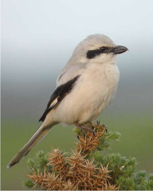
283 Steppeklapekster / Steppe Grey Shrike Lanius lahtora pallidirostris , Isle of Man, Brittannië, 17 juni 2003

juli-augustus 2011 (een exemplaar op Isle of Man, Brittannië, vanaf 17 juni 2003 bleef tot 12 juli). Bij vrijwel alle Europese gevallen betrof het eerstejaars vogels (in tegenstelling tot andere zeldzame Centraal-Aziatische klauwieren zoals Daurische Klauwier L. isabellinus en Turkestaanse Klauwier L. phoenicuroides die regelmatig in adult kleeft in West-Europa worden gezien). Er zit een stijgende lijn in het voorkomen in Europa, met zes gevallen in 1980-89, 20 in 1990-99 en 31 in 2000-09. Een belangrijke verklaring is de toegenomen veldkennis van een groeiend aantal vogelaars maar een werkelijke toename (bijvoorbeeld door een westwaartse uitbreiding van het verspreidingsgebied) is niet uitgesloten. Ook de soortstatus die pallidirostris heeft gekregen (als zelfstandige soort of ondersoort van Aziatische Klapekster) heeft ongetwijfeld bijgedragen aan een verhoogde opmerkzaamheid bij waarnemers in Europa.