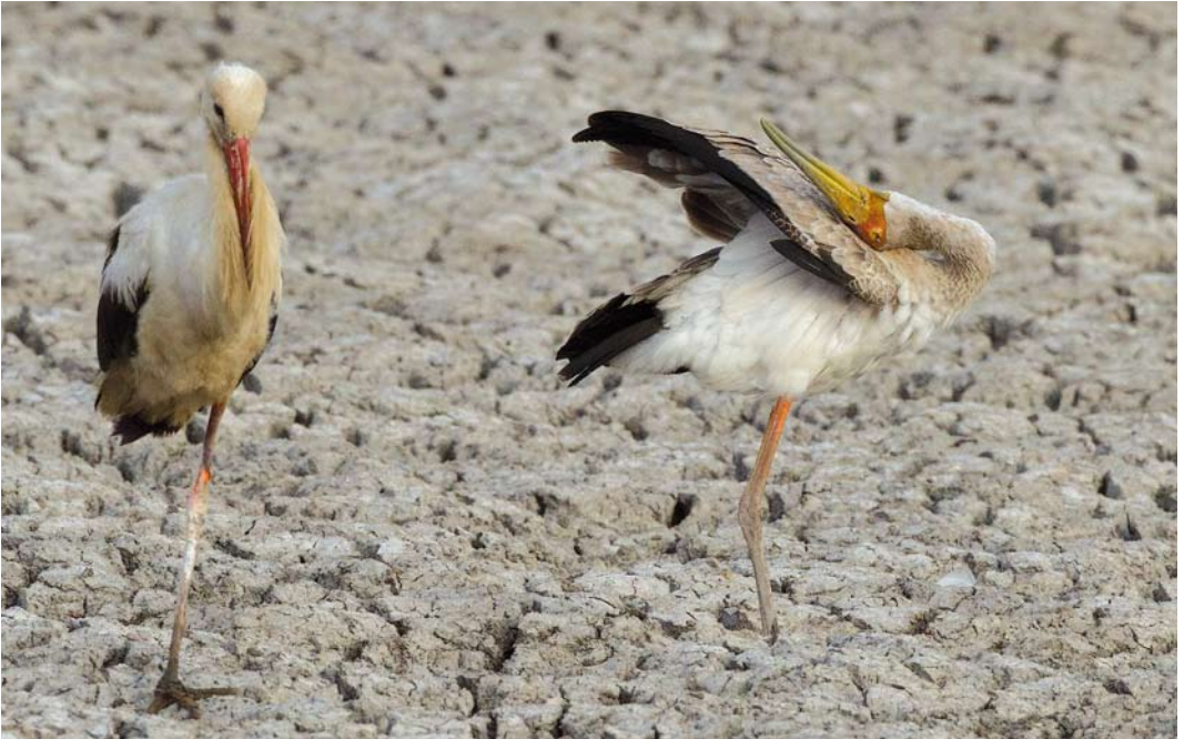
327 Yellow-billed Stork / Afrikaanse Nimmerzat Mycteria ibis , immature, with White Stork / Ooievaar Ciconia ciconia , Bet She'an valley, Israel, 6 July 2013