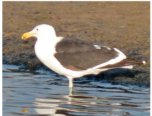
330-331 Ascension Frigatebird / Ascensionfregatvogel Fregata aquila , juvenile, Bowmore, Islay, Argyll, Scotland, 5 July 2013 332 African Openbills / Afrikaanse Gapers Anastomus lamelligerus , Kom Ombo, Egypt, 31 May 2013 333 Pacific Golden Plover / Aziatische Goudplevier Pluvialis fulva , adult male, Łaszka, Pomerania, Poland, 16 July 2013 334 Roseate Tern / Dougalls Stern Sterna dougallii , adult, Mietków reservoir, Silesia, Poland, 13 July 2013 335 Cape Gull / Afrikaanse Kelpmeeuw Larus dominicanus vetula , subadult, Peniche, Portugal, 22 May 2013