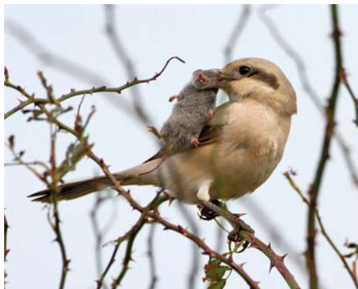
273 Steppeklapekster / Steppe Grey Shrike Lanius lahtora pallidirostris , eerstejaars, met Huisspitsmuis Crocidura russula als prooi, Buitendijk, Texel, Noord-Holland, 31 oktober 2012 ( Jankees Schwiebbe )