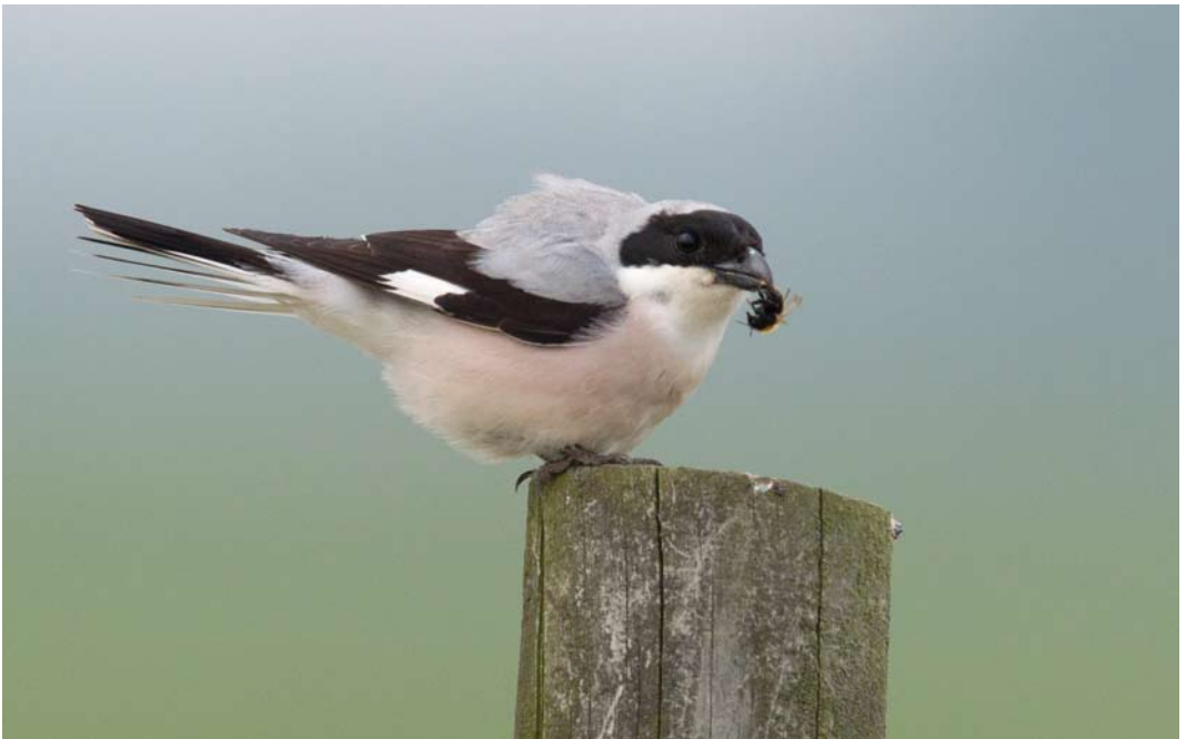
365 Kleine Klapekster / Lesser Grey Shrike Lanius minor , Voorhout, Zuid-Holland, 30 mei 2013