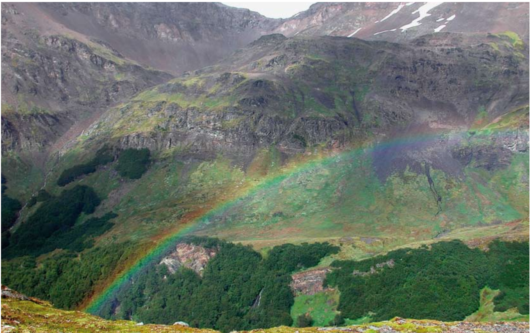
311 Landscape around Paso Garibaldi, Argentina, 31 January 2004 (Jan Bisschop)

Least Seedsnipe T. rumicivorus is perhaps the easiest seedsnipe to find, as it is the only species to be found at sea level, eg, in Peru and Argentina. In the south, it is an austral migrant (van Kleunen et al 2005). The similar Grey-breasted Seedsnipe T. orbignyianus is almost equally easy to connect with because it is common in suitable habitat in most of its range, although you mostly need to be