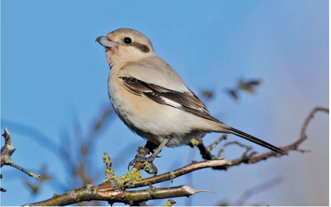
276 Steppeklapekster / Steppe Grey Shrike Lanius lahtora pallidirostris , eerstejaars, Buitendijk, Texel, Noord-Holland, 5 november 2012 (René Pop)

basis van: 1 te lange handpenprojectie (duidelijk korter bij Klapekster); 2 overwegend lichte snavel (overwegend donker bij Klapekster maar variabel); 3 lichte teugel (donker bij Klapekster); 4 bruin waas op vleugels, stuit en staart; en 5 lichtgrijze bovendelen met sterke zandkleur en weinig contrast tussen bovendelen en vuilwitte tot roomkleurige onderdelen.