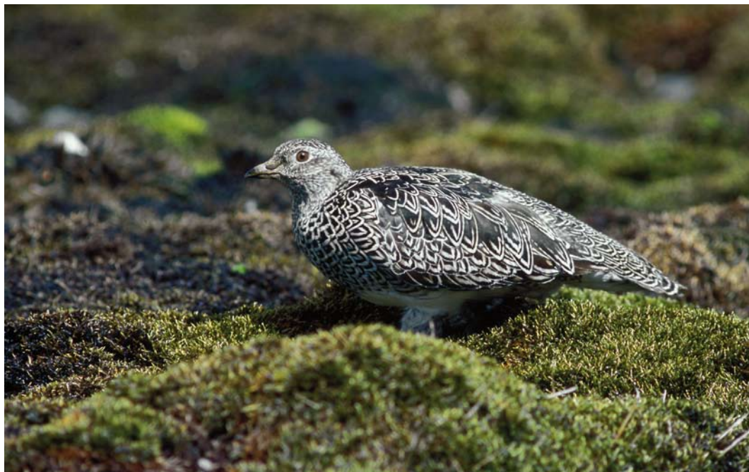
314 White-bellied Seedsnipe / Witbuikkwartelsnip Attagis malouinus , adult, Paso Garibaldi, Argentina, 31 January 2004