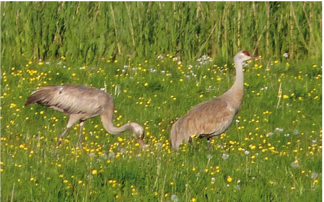
328 Sandhill Crane / Canadese Kraanvogel Grus canadensis , adult (right), with Common Crane / Kraanvogel G. grus , juvenile, Busemark Mose, Møn, Sjælland, Denmark, 27 May 2013