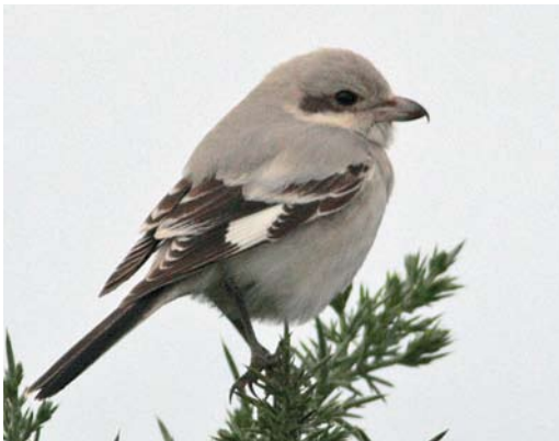
277 Steppeklapekster / Steppe Grey Shrike Lanius lahtora pallidirostris , St Martin's, Scilly, Engeland, 25 september 2009