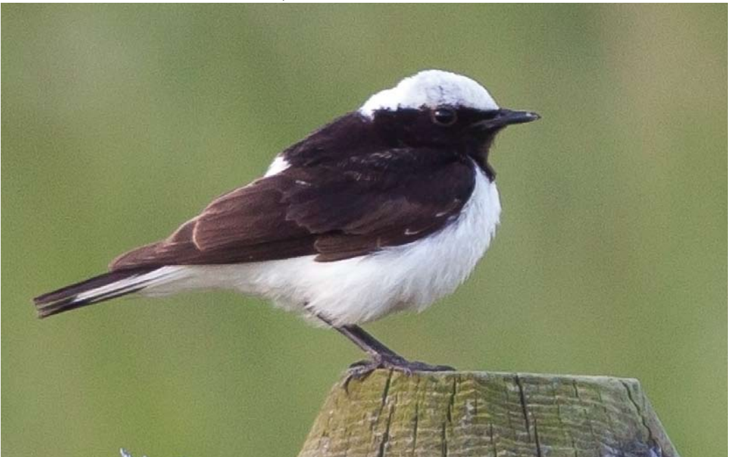
341 Pied Wheatear / Bonte Tapuit Oenanthe pleschanka , first-summer male, Ferwert, Friesland, Netherlands, 9 juli 2013