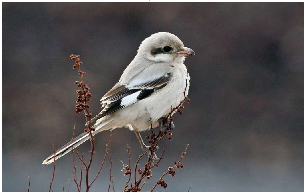
282 Steppeklapekster / Steppe Grey Shrike Lanius lahtora pallidirostris , Vivesholm, Gotland, Zweden, 28 oktober 2009