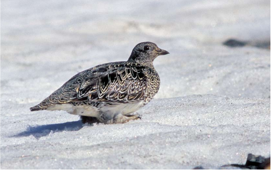
312-313 White-bellied Seedsnipe / Witbuikkwartelsnip Attagis malouinus , adult, Paso Garibaldi, Argentina, 31 January 2004 ( Jan Bisschop )