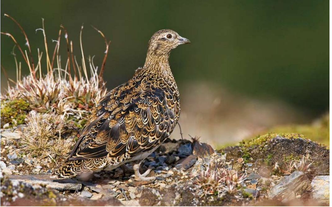
316-317 White-bellied Seedsnipe / Witbuikkwartelsnip Attagis malouinus , adult, Paso Garibaldi, Argentina, 8 March 2006