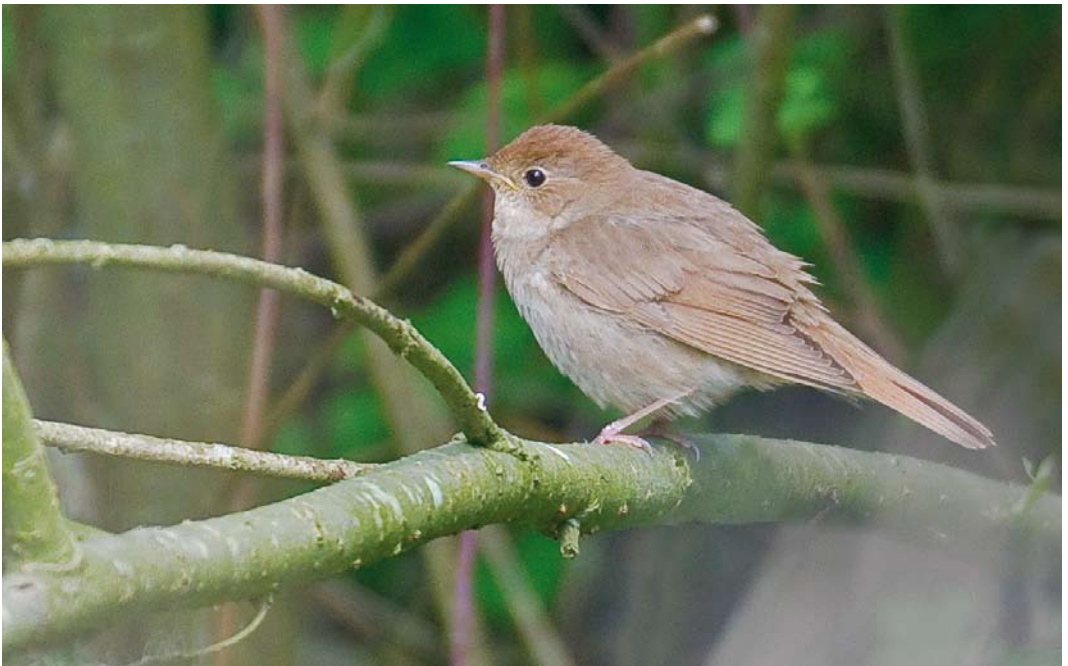
369 Noordse Nachtegaal / Thrush Nightingale Luscinia luscinia , Brabantsche Biesbosch, Noord-Brabant, 22 mei 2013