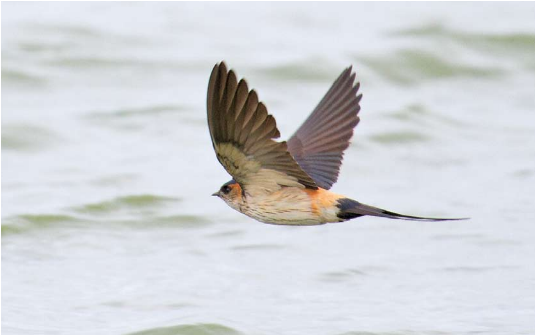
370 Vermoedelijke Amoerroodstuitzwaluw / presumed Asian Red-rumped Swallow Cecropis daurica daurica/japonica , Kennemermeer, IJmuiden, Noord-Holland, 26 mei 2013