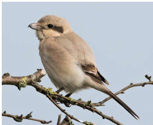
274 Steppeklapekster / Steppe Grey Shrike Lanius lahtora pallidirostris , eerstejaars, Buitendijk, Texel, Noord-Holland, 30 oktober 2012

birdpix.nl, www.dutchbirding.nl, www.waarneming.nl). Succesvol bij jagen en enkele 10-tallen prooien per dag vangend (Enno Ebels pers obs).