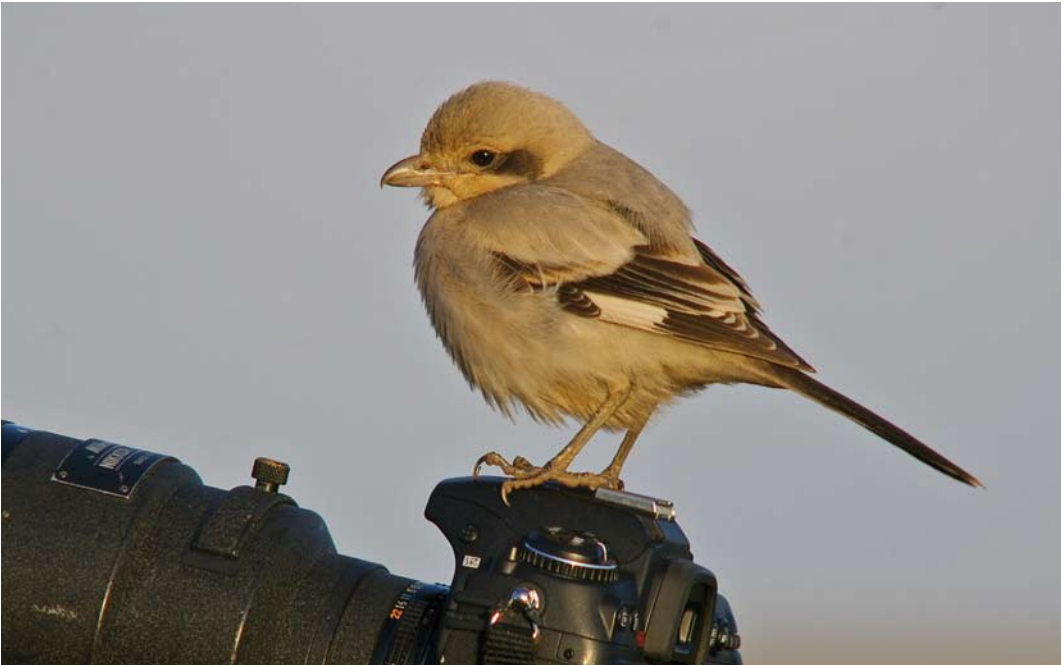
284 Steppeklapekster / Steppe Grey Shrike Lanius lahtora pallidirostris , Grainthorpe Haven, Lincolnshire, Engeland, 24 november 2008

De waarneming op Texel in oktober-november 2012 betrof het tweede geval voor Nederland. Van 4 tot 23 september 1994 verbleef een eerste-winter nabij De Cocksdoorp, eveneens op Texel. Ook bij deze vogel dacht men aanvankelijk met een onvolwassen Kleine Klapekster van doen te hebben (Wassink 1997).