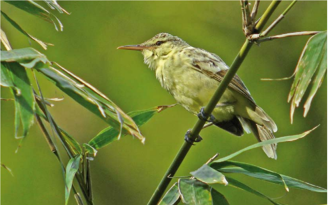
304 Tahiti Reed Warbler / Langsnavelkarekiet Acrocephalus caffer , yellow morph, Papenoo Valley, Tahiti, Society Islands, French Polynesia, 14 September 2006 ( Pete Morris ) 305 Tahiti Reed Warbler / Langsnavelkarekiet Acrocephalus caffer , brown morph, Papenoo Valley, Tahiti, Society Islands, French Polynesia, 14 September 2006 ( Pete Morris ) 306 Rimatara Reed Warbler / Rimatarakarekiet Acrocephalus rimatarae , Rimatara, Austral Islands, French Polynesia, 30 September 2010 ( Mark Van Beirs )