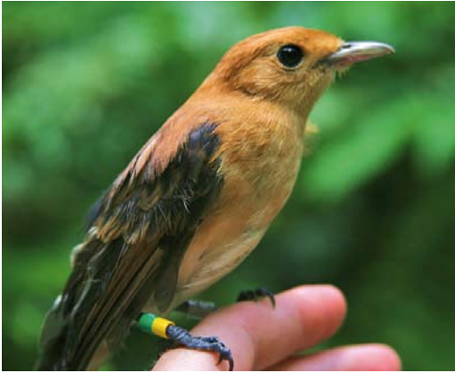
309 Tahiti Monarch / Tahitimonarch Pomarea nigra , immature, Papehue Valley, Tahiti, Society Islands, French Polynesia, 13 February 2009 (Tom Chestemme)