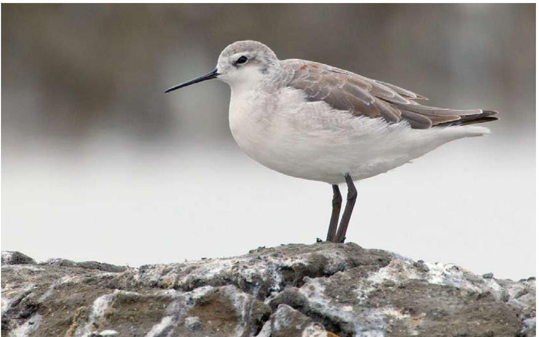
326 Wilson's Phalarope / Grote Franjepoot Phalaropus tricolor , adult, Aveiro, Portugal, 20 July 2013 (David Monticelli)