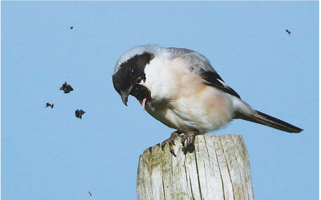
364 Kleine Klapekster / Lesser Grey Shrike Lanius minor , Voorhout, Zuid-Holland, 2 juni 2013 (Martin van der Schalk)