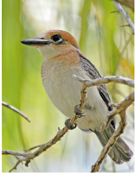
300 Chattering Kingfisher / Boraboraijsvogel Todarhamphus tutus tutus , Bora Bora, Society Islands, French Polynesia, January 2013 ( Fred Jacq ) 301 Tuamotu Kingfisher / Tuamotu-ijsvogel Todarhamphus gambieri gertrudae , juvenile, Niau, Tuamotu Islands, French Polynesia, 22 September 2006 ( Pete Morris ) 302 Tuamotu Kingfisher / Tuamotu-ijsvogel Todarhamphus gambieri gertrudae , adult, Niau, Tuamotu Islands, French Polynesia, 22 September 2006 ( Pete Morris )