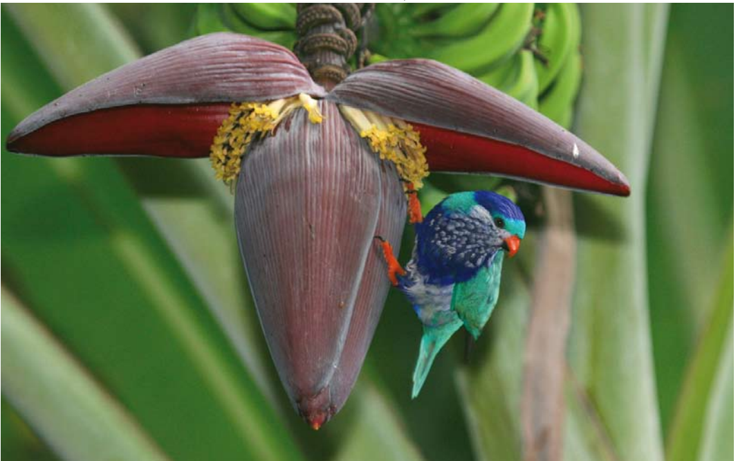
295 Ultramarine Lorikeet / Hemelsblauwe Lori Vini ultramarina , Ua Huka, Marquesas Islands, French Polynesia, October 2009 (Tammy Doukas)