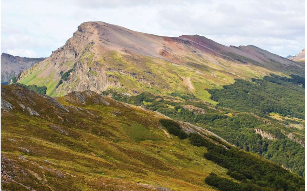
318-319 Landscape around Paso Garibaldi, Argentina, 8 March 2006 ( Marc Guyt )