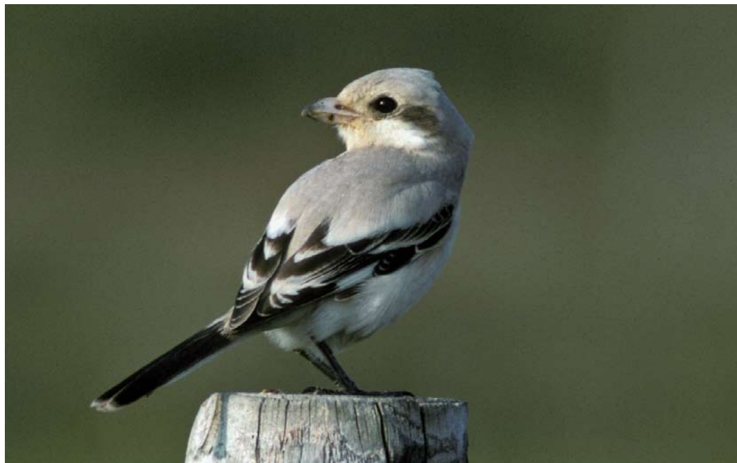
281 Steppeklapekster / Steppe Grey Shrike Lanius lahtora pallidirostris , Texel, Noord-Holland, 22 september 1994