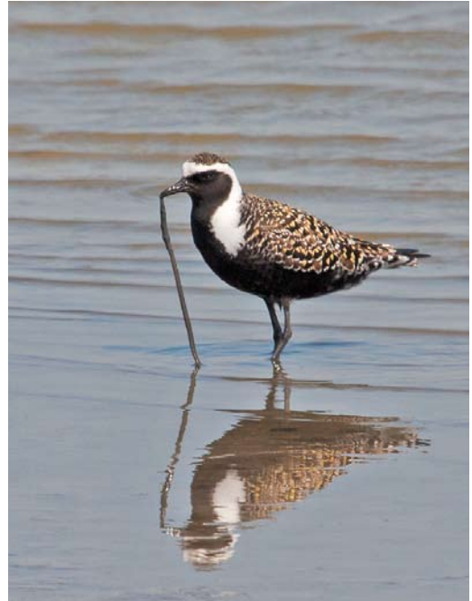
352 Kleine Geelpootruiter / Lesser Yellowlegs Tringa flavipes , Ezumakeeg, Friesland, 10 juni 2013 353 Amerikaanse Goudplevier / American Golden Plover Pluvialis dominica , adult-zomer mannetje, Camperduin, Noord-Holland, 7 juni 2013 354 Amerikaanse Goudplevier / American Golden Plover Pluvialis dominica , adult-zomer mannetje, Camperduin, Noord-Holland, 3 juni 2013