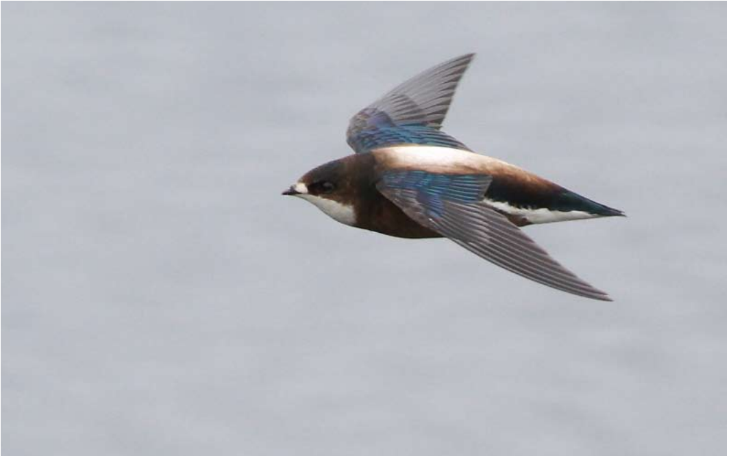
340 White-throated Needletail / Stekelstaartgierzwaluw Hirundapus caudacutus , first-summer, Tarbert, Harris, Outer Hebrides, Scotland, 26 June 2013 ( Josh Jones )