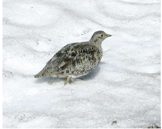
321 White-bellied Seedsnipe / Witbuikkwartelsnip Attagis malouinus , adult, Paso Garibaldi, Argentina, 31 January 2004

above the tree line. The species of the genus Attagis are much more difficult to find, because they are more secretive and more thinly distributed with mostly just a pair or a few individuals encountered. Rufous-bellied Seedsnipe A gayi usually occurs in the high alpine meadows above 4500 m up to as far as to the snow line (5500 m), where only few roads go. The best places to see this species are, eg, Papallacta pass in Ecuador and the high-altitude pass near Chivay in Peru. The fourth member, White-bellied Seedsnipe A malouinus prefers the same habitat but only occurs in extreme southern Patagonia (Argentina and Chile), an area with even fewer roads reaching into their preferred habitat and lower numbers of birders present or visiting. Within its relatively small range, it is very hard to encounter during the breeding season, making it a main target for avid birders visiting the region in that period. It may, in fact, be easier to find in the cold winter season because it then gathers in flocks at lower altitudes (down to sea level) after heavy snowfall (Fjeldså & Krabbe 1990, Jaramillo et al 2003). It exceptionally even leaves the mainland as it has been recorded in the Falkland Islands in 1783 and 1859 (Hayman et al 1986). The species is not threatened and its population appears to be stable; for this and other reasons, it is classified by BirdLife International (2013) as 'Least Concern'.