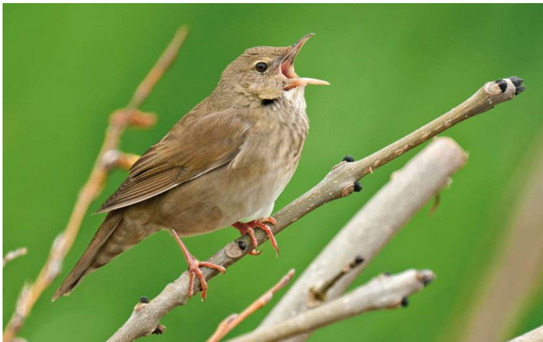
366 Krekelzanger / River Warbler Locustella fluviatilis , Leeuwarden, Friesland, 26 mei 2013