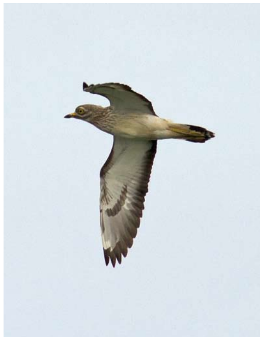
349 Dougalls Stern / Roseate Tern Sterna dougallii , adult-zomer, De Putten, Camperduin, Noord-Holland, 25 juni 2013 350 Griel / Eurasian Stone-curlew Burhinus oedicanus , Burghsluis, Zeeland, 14 mei 2013 351 Terekruijer / Terek Sandpiper Xenus cinereus , met Tureluur / Common Redshank Tringa totanus , Spaarndam, Noord-Holland, 28 mei 2013