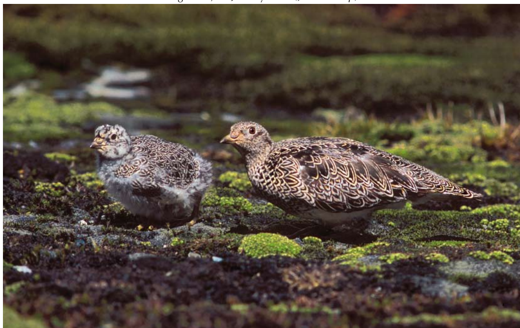
315 White-bellied Seedsnipes / Witbuikkwartelsnippen Attagis malouinus , adult with chick, Paso Garibaldi, Argentina, 31 January 2004