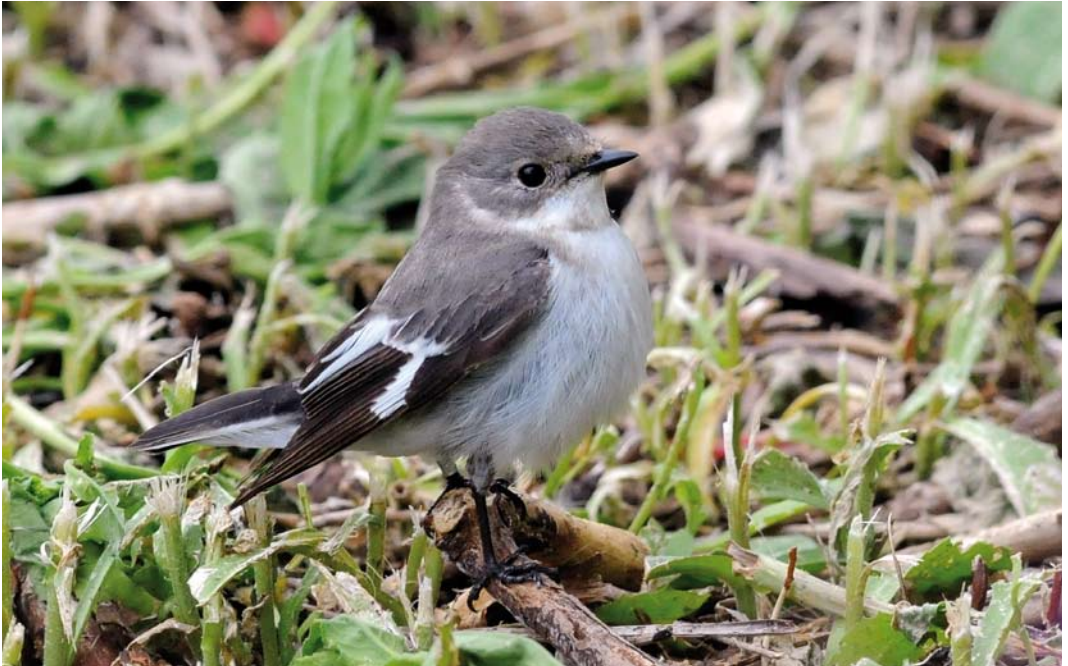
342 Collared Flycatcher / Withalsvliegenvanger Ficedula albicollis , female, Helgoland, Schleswig-Holstein, Germany, 26 May 2013