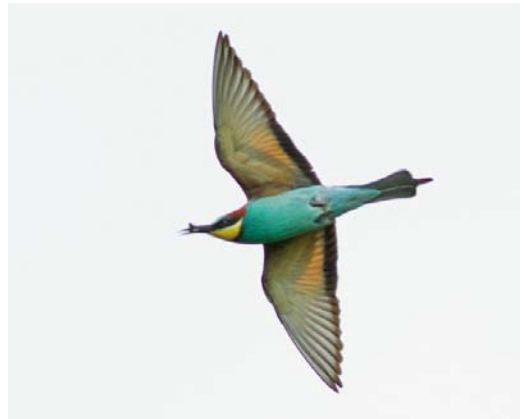
355 Woudaap / Little Bittern Ixobrychus minutus , mannetje, Rottemeren, Zuid-Holland, 11 juni 2013 356 Ralreiger / Squacco Heron Ardeola ralloides , adult, Onnerpolder, Groningen, 15 juni 2013 357 Dwergarend / Booted Eagle Aquila pennata , lichte vorm, Strabrechtse Heide, Noord-Brabant, 16 juni 2013 358 Bijeneter / European Bee-eater Merops apiaster , Zeist, Utrecht, 22 mei 2013

Noord-Holland, en een tweetal werd op 27 juni nog gefotografeerd bij Texel. Trektellers langs de kust telden in deze periode in totaal 21 exemplaren. Het mannetje Buffelkopeend Bucephala albeola van Barendrecht, Zuid-Holland, werd voor het laatst op 3 mei gemeld. Het mannetje Blauwvleugeltaling Anas discors dat vanaf 25 april bij Workum, Friesland, zwom, bleef tot 8 mei. Een mannetje Amerikaanse Wintertaling A. carolinensis bevond zich op 10 mei in het Easterskar (Oosterschar) bij Heerenveen, Friesland.