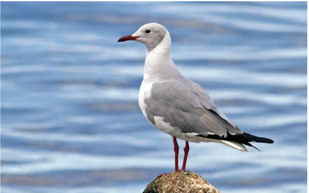
324 Grey-headed Gull / Grijskopmeeuw Chroicocephalus cirrocephalus , adult, Molfetta, Bari, Apulia, Italy, 4 June 2013