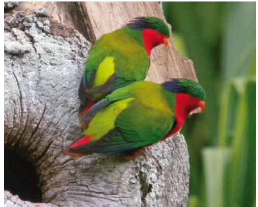
287 Tahiti Sandpiper / Tahitistrandloper Prosobonia leucoptera (collected in Tahiti, Society Islands, French Polynesia, in 1773; RMNH.AVES.87556), Naturalis Biodiversity Center, Leiden, Zuid-Holland, the Netherlands ( Naturalis Biodiversity Center ). The only remaining specimen of this species. 288 Grey-green Fruit Dove / Tahitiaanse Jufferduif Ptilinopus purpuratus purpuratus , Tahiti, Society Islands, French Polynesia, 30 August 2008 ( Tom Ghestemme ) 289 Polynesian Ground Dove / Tahitiaanse Patrijsduif Alopecoenas erythropterus , female, Tenararo, Tuamotu Islands, French Polynesia, 24 September 2010 ( Dave Williamson ) 290 Kuhl's Lorikeets / Kuhls Lori's Vini kuhlii , Rimatara, Austral Islands, French Polynesia, 30 September 2010 ( Dave Williamson )

demic, still-extant species. These include nine species of dove and pigeon (in three genera), three species of lorikeet Vini , two species of swiftlet Aerodramus , four species of kingfisher Todiramphus , five species of reed warbler Acrocephalus and four species of monarch Pomarea . Below, we will discuss these six groups. Many of these species are single-island endemics (table 1), and difficult to reach by the independent birder. We therefore especially present species that occur on islands that are easier to travel to.