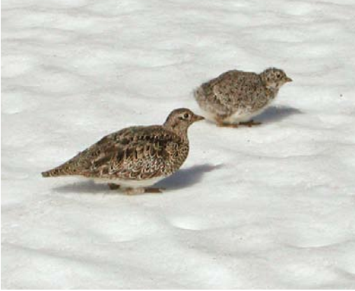
320 White-bellied Seedsnipes / Witbuikkwartelsnippen Attagis malouinus , adult with chick, Paso Garibaldi, Argentina, 31 January 2004