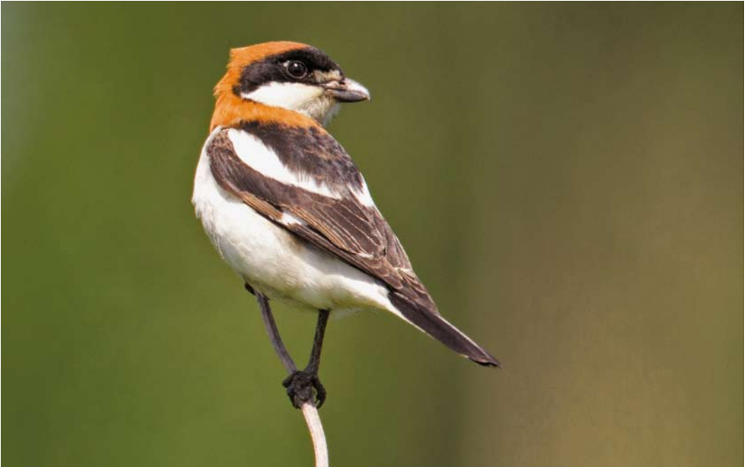
363 Roodkopklauwier / Woodchat Shrike Lanius senator , eerste-zomer mannetje, Poelgeest, Warmond, Zuid-Holland, 27 mei 2013 (René van Rossum)

Waterhoen P pusilla kon men in ieder geval terecht in Waverhoek, Utrecht (maximaal drie), en de omgeving van Peize (minimaal zeven), maar ook op enkele andere plekken werden territoria opgetekend. Voor het 13e achtereenvolgende jaar kwamen Kraanvogels Grus grus tot broeden in het Fochteloërveen, Drenthe/Friesland. Dit jaar waren er vier legfels, waarvan één in de eifase werd gepredeerd. Medio juni waren nog vier jongen in leven. Net als in 2012 werd ook succesvol gebroed op het Dwingelderveld, Drenthe. Eind juni werden hier twee jongen waargenomen. Minimaal één ontsnapte Jufferkraanvogel G virgo deed de harten van slechts weinig vogelaars sneller kloppen, al kon bij vluchtwaarnemingen – zoals op 3 mei boven Veendam, Groningen, en op 10 juni bij Raalte, Overijssel – een eventuele ring niet worden vastgesteld.