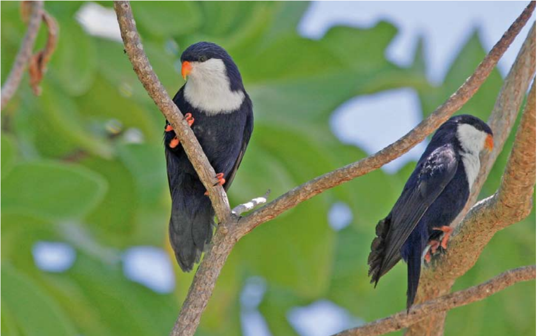
294 Blue Lorikeets / Saffierlori's Vini peruviana , Rangiroa, Tuamotu Islands, French Polynesia, 25 September 2006