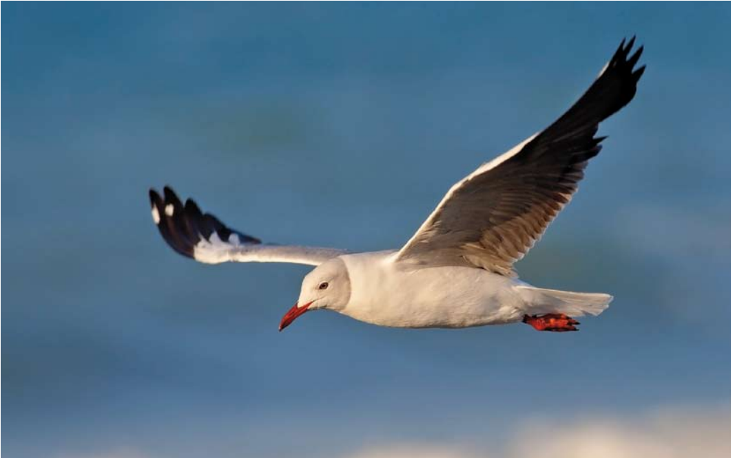
323 Grey-headed Gull / Grijskopmeeuw Chroicocephalus cirrocephalus , adult, Molfetta, Bari, Apulia, Italy, 12 June 2013