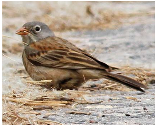
344 Greater Sand Plover / Woestijnplover Charadrius leschenaultii , adult, Blåvand, Syddenmark, Denmark, 6 June 2013 345 Eastern Black-eared Wheatear / Oostelijke Blonde Tapuit Oenanthe melanoleuca , male, Christiansø, Bornholm, Denmark, 1 June 2013 346 Grey-necked Bunting / Steenortolaan Emberiza buchanani , Ras Shukier, Hurghada, Egypt, 29 March 2013 347 Grey-necked Bunting / Steenortolaan Emberiza buchanani , Helgoland, Schleswig-Holstein, Germany, 10 June 2013

a number of pairs of Whiskered Tern Chlidonias hybrida nested again at Kropswolderbuitenpolder, Foxhol, Groningen, where 28 pairs produced c 60 juveniles in 2012, constituting Europe's north-westernmost colony of this species. A Roseate Tern Sterna dougallii at Höfn on 28 June was the first for Iceland. The first for Switzerland since 1863 at Yverdon, Vaud, on 16 May had been ringed as a nestling at Rockabill, Dublin, Ireland, on 21 July 2006 (before this year, this ringed individual had been seen only once before, at Rockabill, on 1 June 2010). The third for Poland (and the first inland) was an adult at Mietkowski reservoir, Lower Silesia, on 11-13 July which was ringed as a chick on Coquet Island, Northumberland, England, on 10 July 2010. Geolocators deployed on adult Arctic Terns S. paradisaea captured on the nest in 2011 in the Netherlands showed that during their 266-280 days 'abroad' they used known staging areas in the