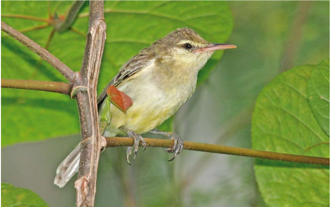
307 Northern Marquesan Reed Warbler / Noordelijke Markiezenkarekiet Acrocephalus percernis idae , Botanique Communal de Vaipae, Ua Huka, Marquesas Islands, French Polynesia, 16 September 2006

for the havoc that rats can wreck on island bird species (Thibault & Meyer 2001). Historically, as many as eight species were known from French Polynesia (Cibois et al 2004) but today only four remain, all single-island endemics. Two of them are hanging by a thread, Tahiti Monarch on Tahiti and Fatuhiva Monarch P. whitneyi on Fatu Hiva respectively, while Mohotani Monarch P. (mendozae) motanensis cannot be visited by the independent traveller as it occurs on uninhabited Mohotani in the Marquesas. The fourth species, Iphis Monarch P. iphis has some sort of thriving population on one Marquesan island only, namely Ua Huka, only because this island is free of Black Rats (see above under Ultramarine Lorikeet).