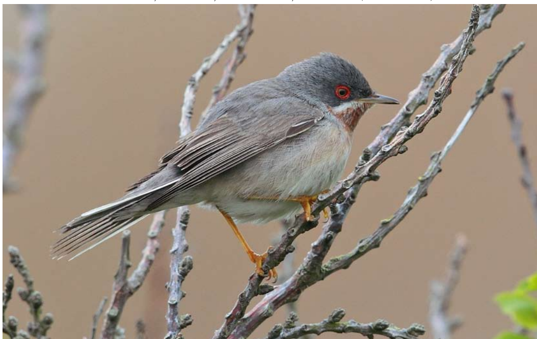
367 Balkanbaardgrasmus / Eastern Subalpine Warbler Sylvia cantillans albistriata , eerste-zomer mannetje, Mariëndal, Den Helder, Noord-Holland, 17 mei 2013 (Eric Menkveld)