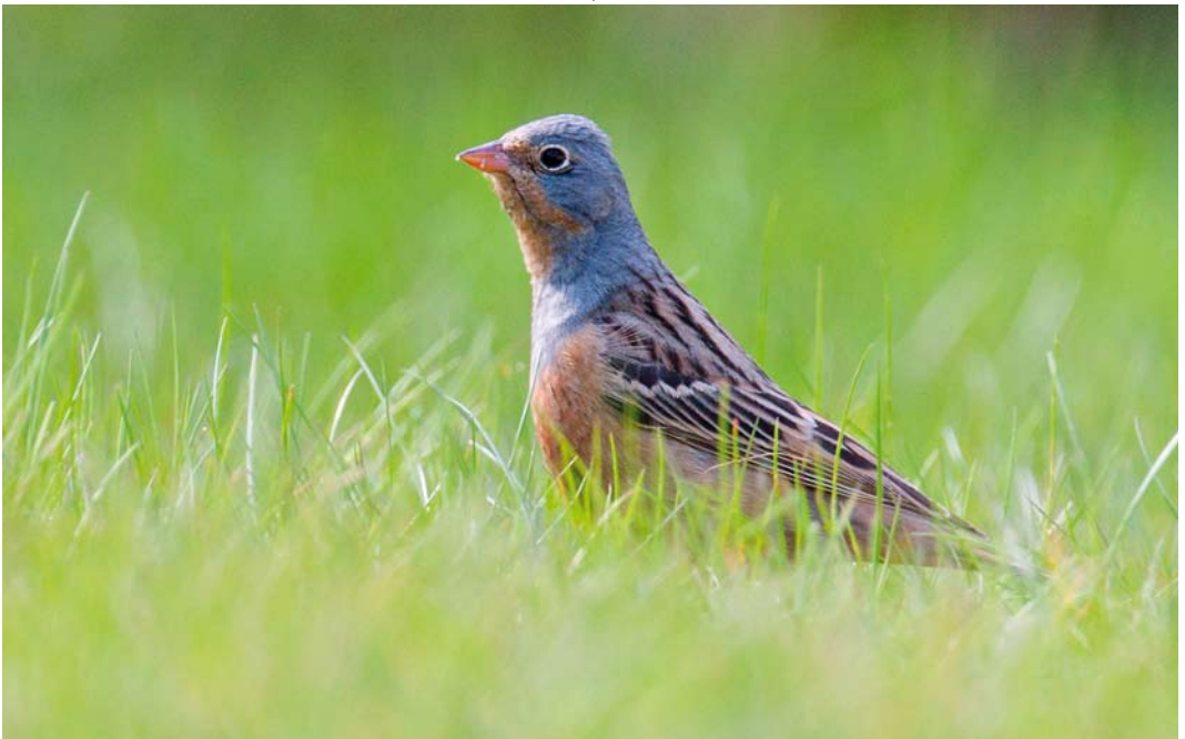
371 Bruinkeelortolaan / Cretschmar's Bunting Emberiza caesia , mannetje, Lauwersoog, Groningen, 5 mei 2013