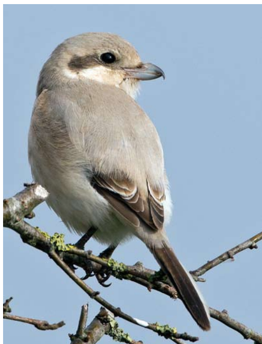
275 Steppeklapekster / Steppe Grey Shrike Lanius lahtora pallidirostris , eerstejaars, Buitendijk, Texel, Noord-Holland, 30 oktober 2012 ( Co van der Wardt )

en teveel getrapt (bovendien past de kleurverdeling op de staart niet op Kleine); 6 te lichte en te lange snavel; en 7 te lange poten, bruin in plaats van zwart. Klapekster kon worden uitgesloten op