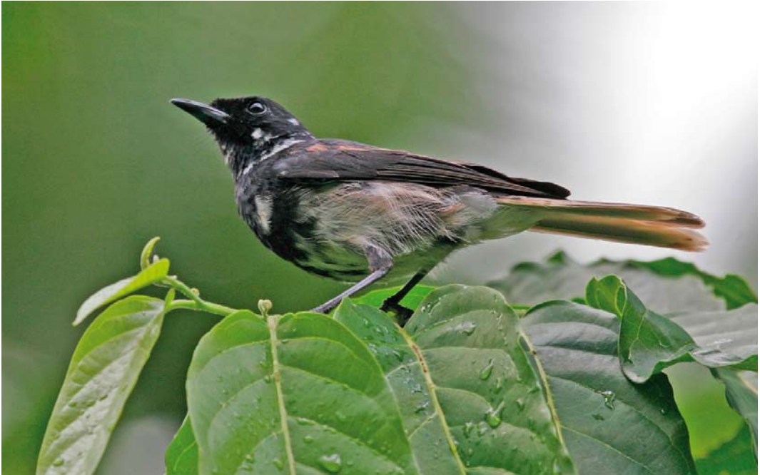
308 Iphis Monarch / Iphismonarch Pomarea iphis , Botanique Communal de Vaipae, Ua Huka, Marquesas Islands, French Polynesia, 16 September 2006

Horned Owl Bubo virginianus (in the Marquesas) may affect species groups like pigeons and doves, lorikeets, kingfishers and swiftlets (Holyoak & Thibault 1984).