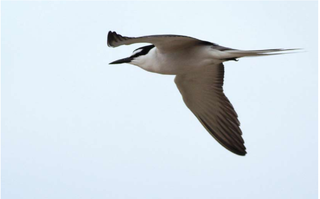
325 Bridled Tern / Brilstern Onychoprion anaethetus , adult, Farne Islands, Northumberland, England, 2 July 2013 (Josh Jones)