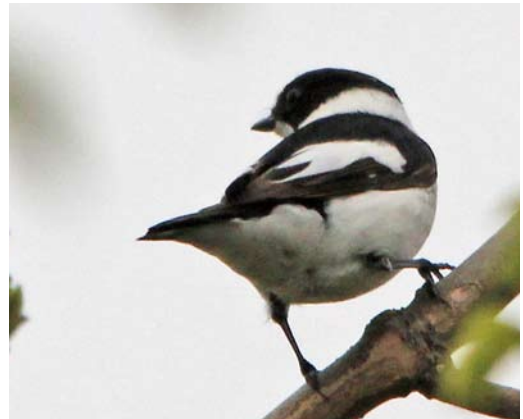
359 Grauwe Fitis / Greenish Warbler Phylloscopus trochiloides , Romeinenweerd, Venlo, Limburg, 7 juni 2013 (Huub Crommentuyn) 360 Roodstuitzwaluw / Red-rumped Swallow Cecropis daurica , Berkheide, Zuid-Holland, 3 mei 2013 (René van Rossum) 361 Sperwergrasmus / Barred Warbler Sylvia nisoria , tweede-kalenderjaar, Eastermar, Friesland, 19 juni 2013 (Arend Timmerman) 362 Withalsvliegenvanger / Collared Flycatcher Ficedula albicollis , eerste-zomer mannetje, Eemshaven, Groningen, 7 mei 2013 (Martijn Bot)

plaren in juni. In Noord-Holland werden Zwarte Ibissen Plegadis falcinellus gezien vanuit een taxiënd vliegtuig op Schiphol op 20 juni en vanuit een bus in de Beemster op 27 juni. Een Kuifduiker Podiceps auritus in zomerkleed liet zich van 22 juni tot in juli bewonderen bij Reusel, Noord-Brabant.