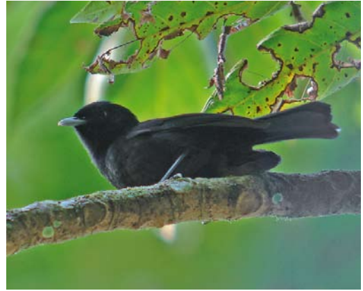
310 Tahiti Monarch / Tahitimonarch Pomarea nigra , adult, Tahiti, Society Islands, French Polynesia, 14 September 2006

For most people, the islands in the Society group will be the best known. Moorea, Bora Bora and Raiatea all make a fabulous honeymoon destination. Consequently, most of these islands are served by frequent flights (more than one daily) from Tahiti. Alternatively, several freighters will take tourists. Ferries also serve Moorea and Huahine.