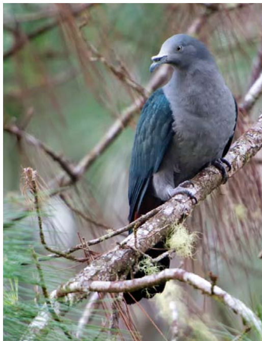
291 White-capped Fruit Dove / Witkapjufferduif Ptilinopus dupetithouarsii dupetithouarsii , Fatu Hiva, Marquesas Islands, French Polynesia, 20 July 2010 292 Marquesan Imperial Pigeon / Markiezenmuskaatduif Ducula galeata , Nuku Hiva, Marquesas Islands, French Polynesia, 15 April 2013 293 Atoll Fruit Dove / Atoljufferduif Ptilinopus coralensis , Tenararo, Tuamotu Islands, French Polynesia, 24 September 2010